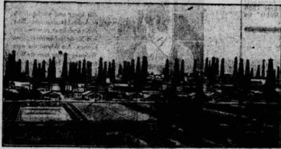
Sitzen der Arbeit. Ein Feld von Petroleumbohrern auf dem Signalhügel-Petroleumfeld bei Long Beach (Kalifornien), einem der reichsten Oelfelder der Welt, wo mehr als 1000 Petroleumquellen erschlossen sind.