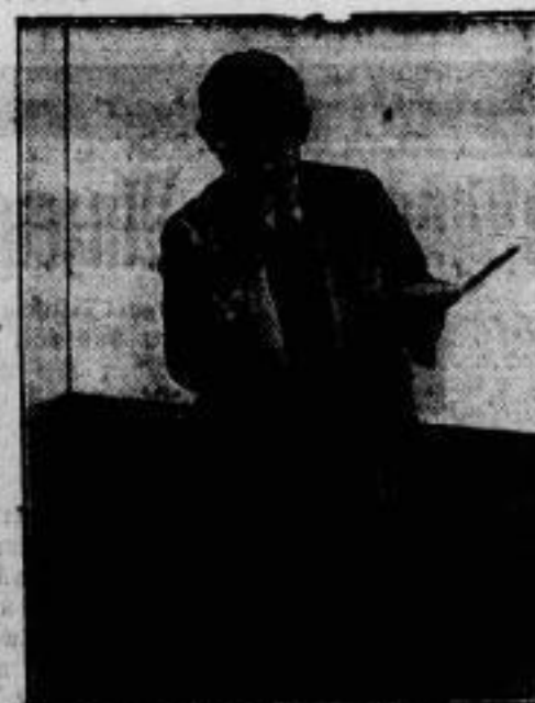
Reiseführer in Zürich!

Der sein Amt am 8. November antreten wird, ist Sir Can- non Stodd, der kürzlich von den Ratsherren der City von London gewählt wurde. Wir zeigen den neuen Lordmayor (Bürgerhaupt) mit dem gegenwärtigen Lordmayor Sir Char- les Batho und den Trägern des Lordmayor-Schwertes und des Amis-Rades nach der Wahl vor dem Rathaus.