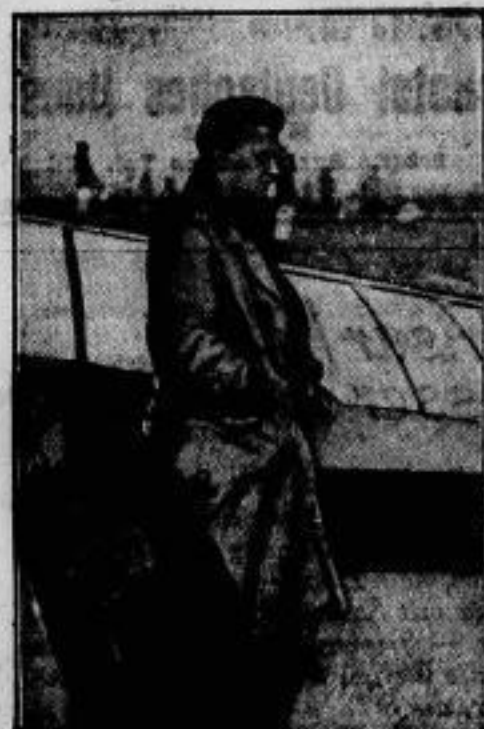
Segelflug über der Gochstadt.

Dem Kaiserlichen Flieger Karl Wager wurde am 30. September die erste Über- fliegung einer Gochstadt im Segelflug verleihen. Er flog vom Dornberg nach dem 20 Ki- lo- meter entfernten Rassel, überquerte die Stadt in etwa 50 Meter Höhe und landete nach halbhündigem Flug glatt in dem Flug- hafen Rassel.