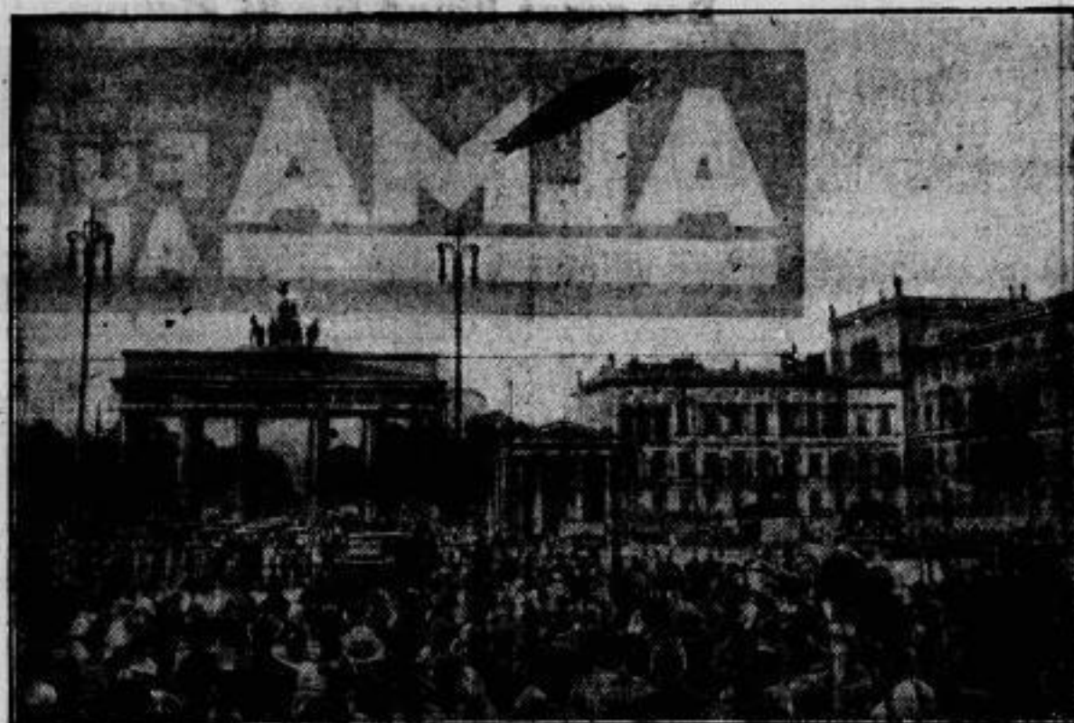
Die Berliner bewachen den „Graf Zeppelin“ beim Überfliegen des Brandenburger Tors.