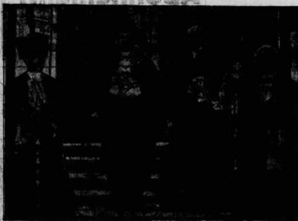
Der neue Oberbürgermeister von London.

Dem Kaiserlichen Flieger Karl Wager wurde am 30. September die erste Über- fliegung einer Gochstadt im Segelflug verleihen. Er flog vom Dornberg nach dem 20 Ki- lo- meter entfernten Rassel, überquerte die Stadt in etwa 50 Meter Höhe und landete nach halbhündigem Flug glatt in dem Flug- hafen Rassel.