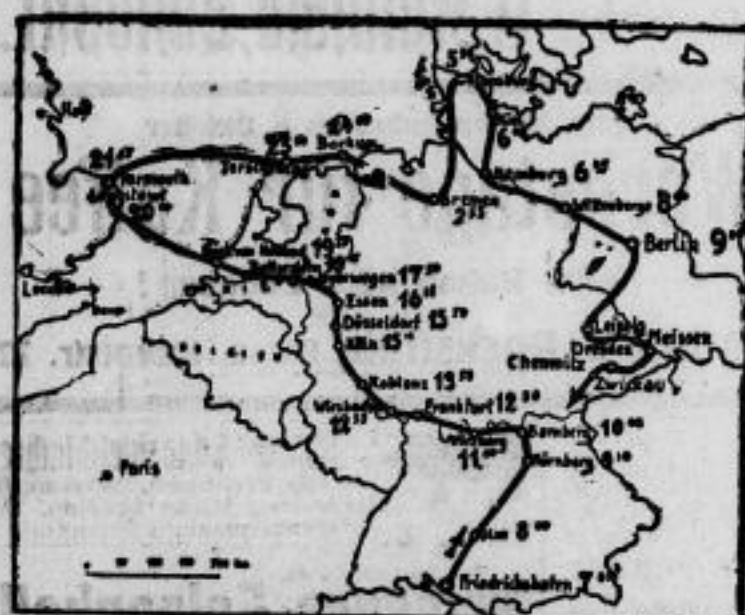
Der Flugweg des „Graf Zeppelin“ bis zum Mittag des 3. Oktobers mit den Zeiten, zu denen er die überflogenen Städte passiert hat.