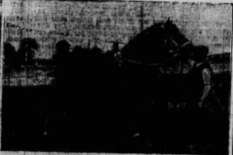
Am 1. Deutschen Tiermesse die auf dem Fuße- und Rinderhof in Berlin-Friedrichsfelde stattfand, wurde dieses Prachtexemplar hannoverscher Pferdezucht, ein siebenjähriger Blauschimmelwallach, mit dem ersten Siegerpreis ausgezeichnet.