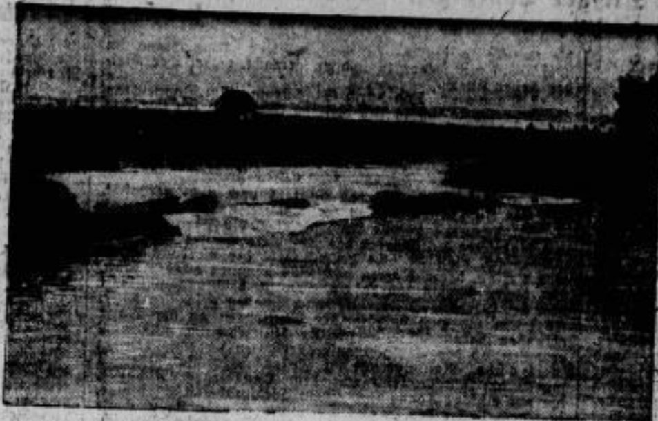
Die Ueberflutungs-Katastrophe an der belgischen Küste. folgte infolge des Bruches von Dämmen und Schleusen in der Gegend von Neuport und Ramscapelle 12- bis 13000 Hektar Land unter Wasser. Wir zeigen eine Bruchstelle, die man mit Sandfäden zu schließen sucht.