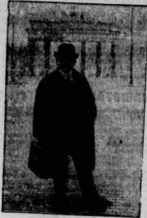
Herriot in Berlin. Der französische Unterrichtsminister Herriot ist am 3. Oktober in Berlin eingetroffen, um die Archive der Staatsbibliothek für sein neues Werk über Beethoven in Anspruch zu nehmen.