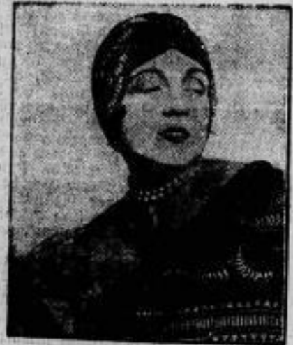
Mode von morgen. Schultertuch aus schwarzem Samt mit aufgenähten Silberplättchen.