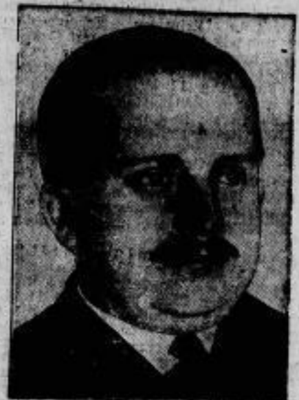
Der Internationale Verband für kulturelle Zusammenarbeit. der 1922 durch den Prinzen Karl Anton von Rodan (im Bilde) gegründet wurde, eröffnete am 1. Oktober in Prag seinen 5. Jahreskongress. Prinz Rodan ist noch jetzt der Generalsekretär des Verbandes.