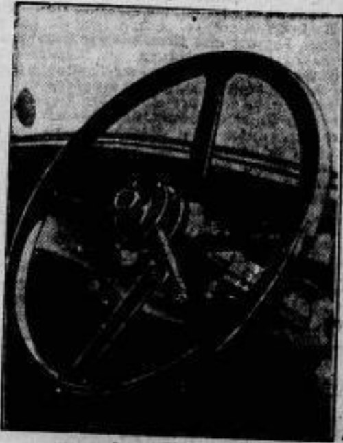
Eine unentbehrliche Erfindung im Automobilbau ist die neuartige Betriebsumschaltung, die durch die Betätigung eines kleinen Hebels am Steuerpedal mittels elektrischer Kraft erfolgt. Diese Konstruktion bedeutet natürlich der bisherigen Umschaltung gegenüber, die durch einen Hebel mittels Handkraft geschah, eine bedeutende Vereinfachung für den Fahrer und damit eine Erhöhung der Fahrleistung.