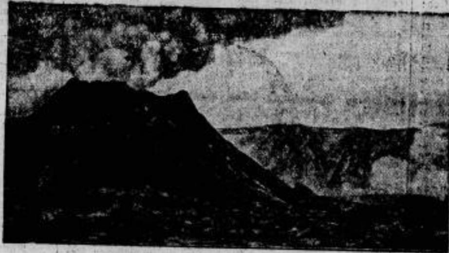
Das Kratzen der Landschaft. Der Krater des Vesuvius, aufgenommen von dem Lavafeld am Fuße des neuen Kraterkegels.