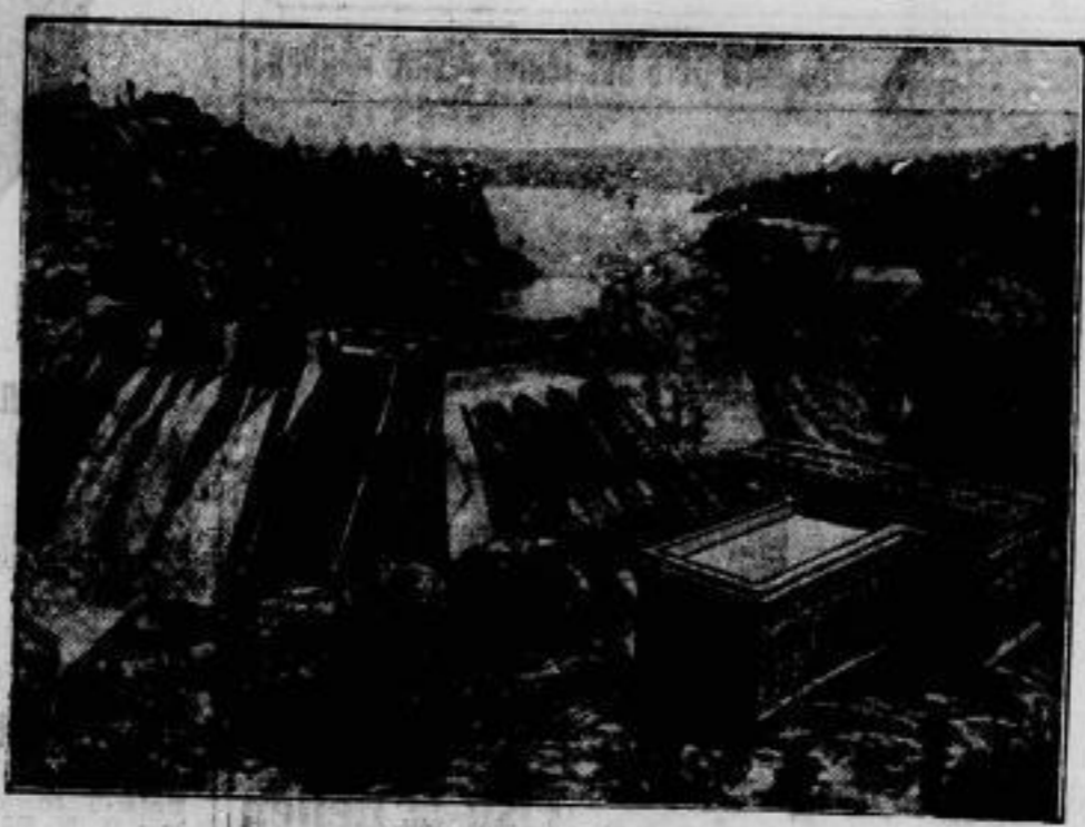
Stätten der Arbeit. Amerikas zweites größtes Wasserkraftswerk ist das von Long Lake unweit Spokane im Staate Washington, das 94000 Pferdekraft erzeugt. Der Wasserfall ist höher als der des Niagara.