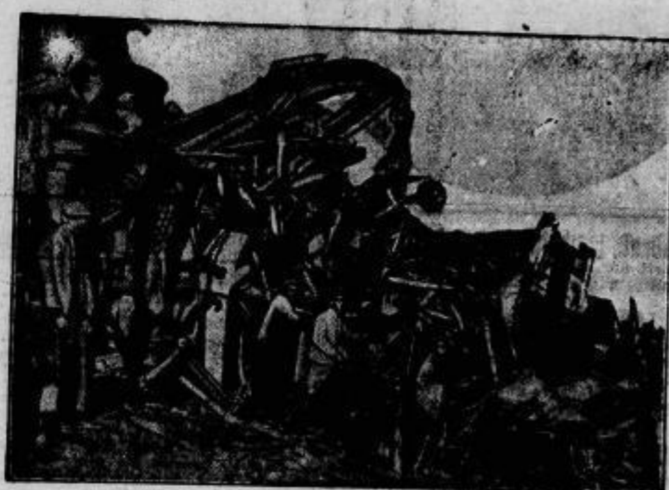
Ein furchtbares Eisenbahnunglück ereignete sich bei Madrigneras (Spanien), wo durch einen Zugzusammenstoß neun Personen getötet und mehr als 20 verletzt wurden. Das Trümmerhaud gibt ein anschauliches Bild von der furchtbaren Gewalt des Zusammenstoßes.