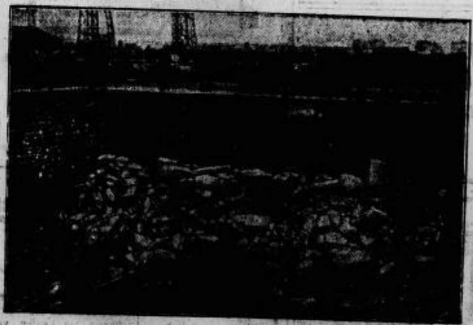
Bei der Hochschleusung an der belgischen Elbe in der Gegend von Neufort und Ranscapelle sucht man der eindringenden Wassermassen dadurch Herr zu werden, daß man durch das in Höhe gerammte Mauerwerk vor den geborstenen Schleusentoren einen Damm aus Betonblöcken aufschütten läßt.