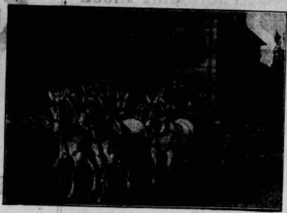
Die Parade der Geller Hengste, die alljährliche Zuchtprüfung des hervorragenden Pferdmaterials des Landgestüts Gelle (Cannover), fand am 4. Oktober statt. Wir zeigen das schönste Gespann der Schau, den Schimmel-Bierreuzer „Aler“, „Amateur“, „Amanbus“, „Aitruip“.