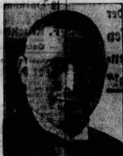
Zum Regierungspräsidenten von Sachsen wurde der bisherige Vizepräsident von Bochum, Stieler, ernannt, der dem Preussischen Landtag als Abgeordneter der Zentrumspartei angehört.