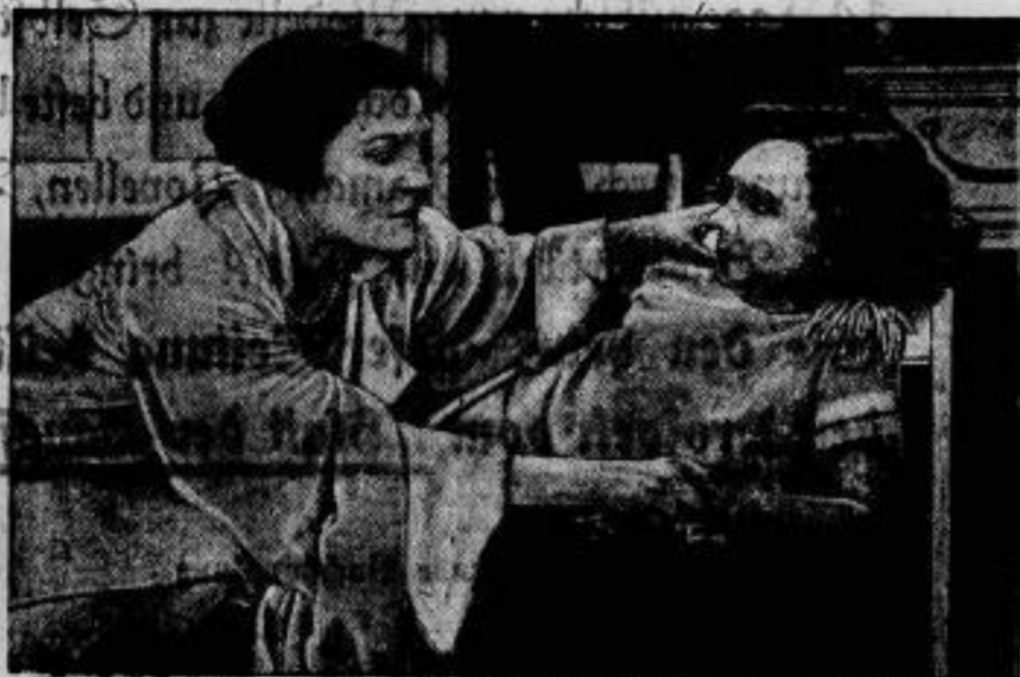
Ein Bild aus der Filmwand.

Die „treue Nymph“ heißt ein englischer Film, der demnachst in Deutschland gezeigt wird. Die Geschichte einer treuen Liebe, die gegen Ränke und Eifersucht zu kämpfen hat und — als sie endlich erkannt und erwidert wird — im Uebermaß des Glückes der „treuen Nymph“ den Tod bringt. Wir zeigen eine Eifersuchtszene zwischen der „treuen Nymph“ (rechts) und ihrer Rivale.