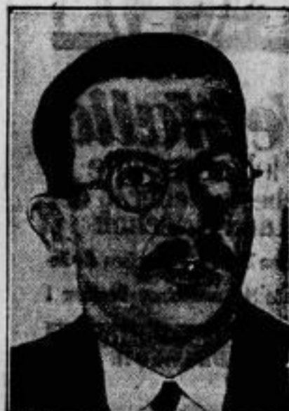
Morphium auf synthetischem Wege herzustellen, ist dem Berliner Chemiker Lang gelungen. Das synthetische Morphinum ist mit dem aus natürlichem Opium gewonnenen Produkt vollkommen identisch.

Die „treue Nymph“ heißt ein englischer Film, der demnachst in Deutschland gezeigt wird. Die Geschichte einer treuen Liebe, die gegen Ränke und Eifersucht zu kämpfen hat und — als sie endlich erkannt und erwidert wird — im Uebermaß des Glückes der „treuen Nymph“ den Tod bringt. Wir zeigen eine Eifersuchtszene zwischen der „treuen Nymph“ (rechts) und ihrer Rivale.