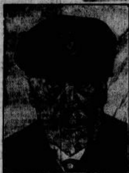
Dr. Hugo Eckener, der Führer des Luftfrachts.