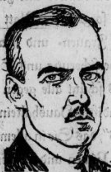
Sonntagsabgeordneter v. Kirchbach f.

Freiherr v. Kirchbach, der Landrat des Kreises Reibenburg, ist im Alter von 50 Jahren in Bad Nauheim gestorben. Freiherr v. Kirchbach gehörte dem Preussischen Landtag als Abgeordneter der Deutschnationalen Volkspartei und dem Ostpreussischen Provinziallandtag an.