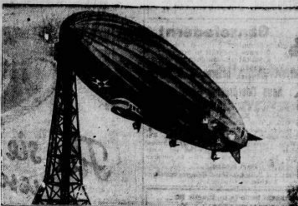
und legt sich an den Ankermaß.