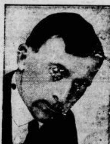
Als die New Yorker Metropolitan-Oper wurde Generalmusikdirektor Rosenkranz vom Wiesbadener Staatsopertheater berufen. Er wird seinen neuen Wirkungsbereich mit Beginn der Spielzeit 1929/30 übernehmen.

Freiherr v. Kirchbach, der Landrat des Kreises Reibenburg, ist im Alter von 50 Jahren in Bad Nauheim gestorben. Freiherr v. Kirchbach gehörte dem Preussischen Landtag als Abgeordneter der Deutschnationalen Volkspartei und dem Ostpreussischen Provinziallandtag an.