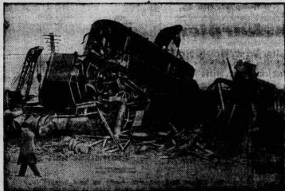
Eisenbahnkatastrophe in Schottland.

Durch einen Zusammenstoß, der mit 20-Kilometer-Geschwindigkeit zwischen dem Hochlandexpress und einem haltenden Güterzug bei Wamprey erfolgte, wurden die Lokomotivführer und Fahrer beider Züge getötet. Die Unglücksstätte bietet ein trübsames Bild der Zerstörung.