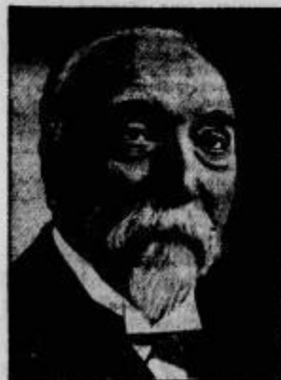
Streit um Combes.

Für Emile Combes (im Bilde), der 1905 als Ministerpräsident die Trennung von Kirche und Staat in Frankreich durchgeführt hat, wurde am 28. Oktober in Bona bei La Rochelle ein Denkmal eingeweiht, das unmittelbar nach der Feier durch eine Gruppe von Camelots du Roi durch Hammerschläge schwer beschädigt wurde.