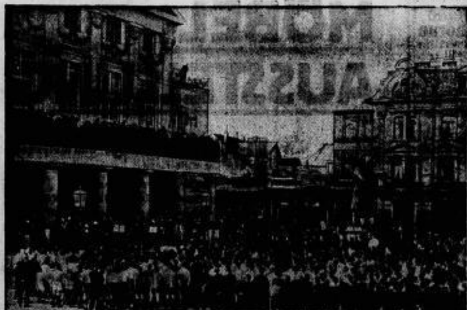
Die Fußballer in Weimar.

Der Deutsche Fußballbund, der größte deutsche Sportverband, hielt am 27. und 28. Oktober seinen Bundeskongress in Weimar ab. Mit dieser Tagung wurde die Ein-