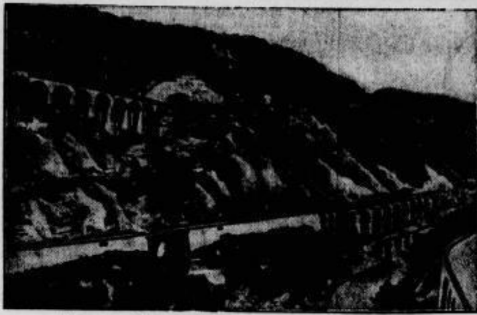
Die neue Eisenbahnlinie Nizza-Cort.

Die eine unmittelbare Verbindung zwischen der französischen Riviera und Piemont bzw. der Lombardei herstellt, wurde soeben durch den französischen Minister für öffentliche Arbeiten eingeweiht. Die Bahnlinie erforderte den Bau einer Reihe von Viadukten, von denen wir die von Bancoo und Eboulis (bei Ventimiglia) zeigen.