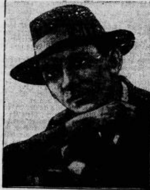
Tschechische Andenken eines deutschen Dichters.

die Gattin des ungarischen Ministerpräsidenten, hat ein Lustspiel „Das graue Kleid“ geschrieben, das vom Budapester Lustspielhaus zur Uraufführung angenommen wurde.