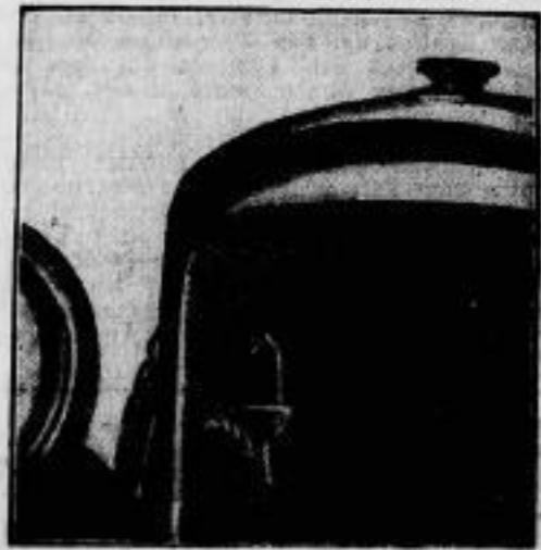
Ein Abzeichen für deutsche Kraftwagen, das auf Anregung des Reichsverbandes der Automobilindustrie geschaffen wurde, wird bei der am 8. November in Berlin beginnenden Internationalen Automobilausstellung der Öffentlichkeit gezeigt werden.