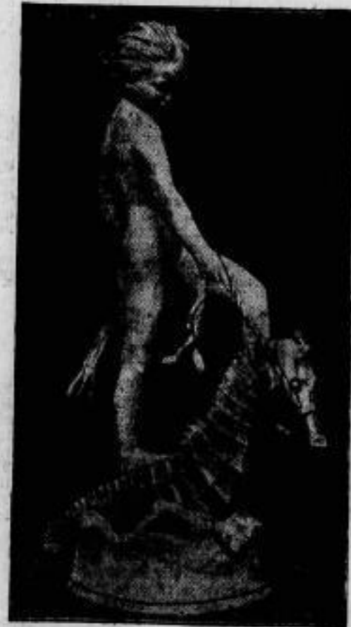
Aus dem Reiche der Kunst.

ist am 31. Oktober durch den Reichsarbeitsminister Bissel (im Bild), der auch die bisherigen Einigungsverhandlungen zwischen Arbeitgeber und Arbeitnehmern geleitet hat, für verbindlich erklärt worden.