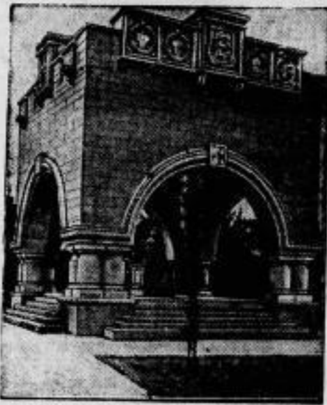
Ein Kriegerdenkmal für die Gefallenen von sechs Armeen

ein erfolgreicher vulkanischer Ausbruch des Pazifikgebirges im Rainier-Nationalpark (U.S.A.). Scheinbar ist dort das hölzerne Schweißhorn, dessen Klänge viele Kilometer weit hörbar sind, ebenso beliebt wie in seinem Ursprungsland.