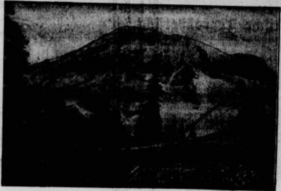
Der Mount Rainier,

Die eine unmittelbare Verbindung zwischen der französischen Riviera und Piemont bzw. der Lombardei herstellt, wurde soeben durch den französischen Minister für öffentliche Arbeiten eingeweiht. Die Bahnlinie erforderte den Bau einer Reihe von Viadukten, von denen wir die von Bancoo und Eboulis (bei Ventimiglia) zeigen.