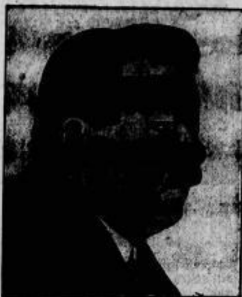
Friedrich Ebert, Reichspräsident vom 11. August 1919 bis 28. Februar 1925.