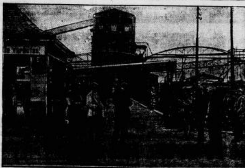
Im Kohlenkampf an Ruhr und Rhein. Die Werke feiern. Eines der geschlossenen Eisenwerke im Ruhrrevier, dessen Eingangstor von Arbeiterposten überwacht wird.