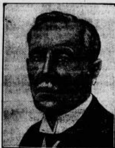
Minister Brüning. Der langjährige deutsche Finanzminister Konrad Brüning ist am 30. Oktober im Alter von 64 Jahren einem schweren Darmleiden erlegen. Brüning wurde kurz vor der Revolution Mitglied des Staats- rates und hat vom Februar 1919 bis Fe- bruar 1928 das deutsche Finanzministerium verwaltet. Bild links.