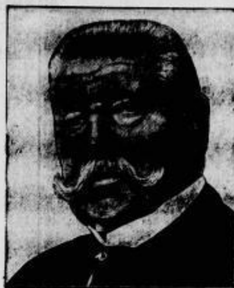
von Hindenburg, Reichspräsident seit dem 11. Mai 1925.