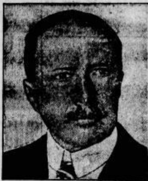
Reichspräsident Haase, Reichspräsident vom 11. März bis 10. Mai 1925.