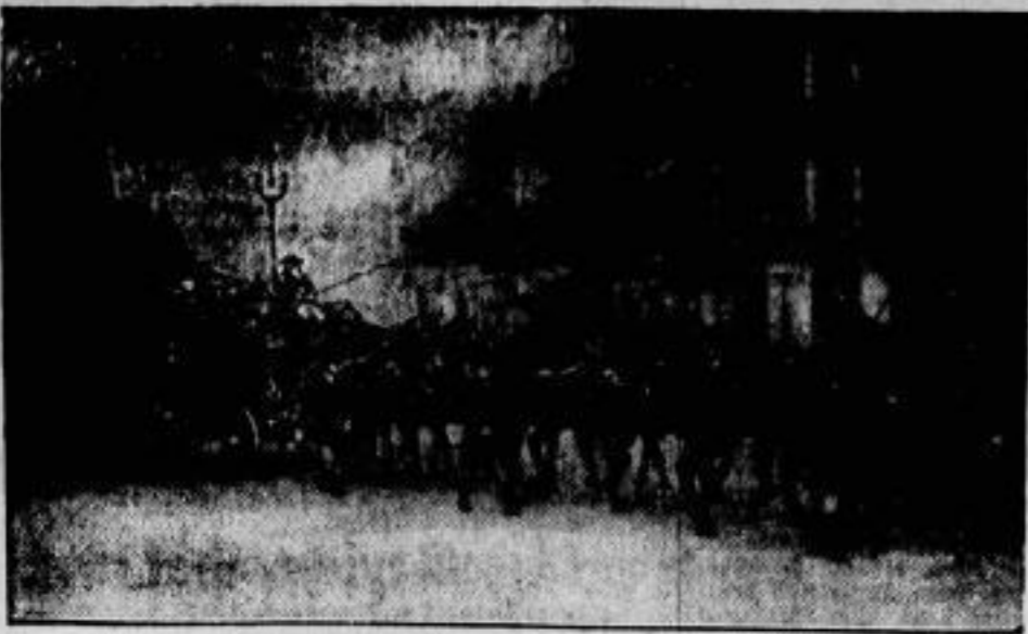
Die Einführung des neuen Lord Mayors von London. Sir Rynaston Studd, fand am 10. November in der durch alte Tradition gebilligten Form statt. Hunderttausende von Zuschauern umsäumten den Weg vom Rathaus zum Justizpalast, wohin der neue Oberbürgermeister sich zur Eidesleistung begab.