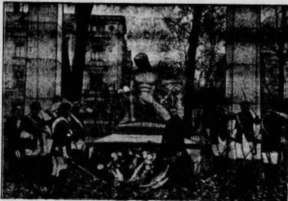
Zur Erinnerung an Langemard,

Der ehemals russische Ministerpräsident Treshow, der 1916 der Nachfolger des Ministerpräsidenten Stürmer wurde, ist in Riga an einem Schlaganfall gestorben.