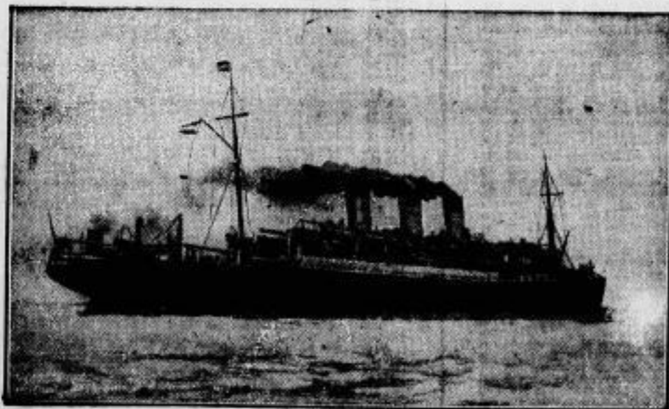
Brand auf einem deutschen Passagierdampfer.

Während der Ueberfahrt des deutschen Dampfers „Cap Volonio“, der am 11. November in Rio de Janeiro eintraf, brach an Bord ein Brand aus, der erst nach großen Schwierigkeiten gelöscht werden konnte. Während geraumer Zeit mußten die Maschinen angehalten werden, bis der durch das Feuer verursachte Schaden repariert war.