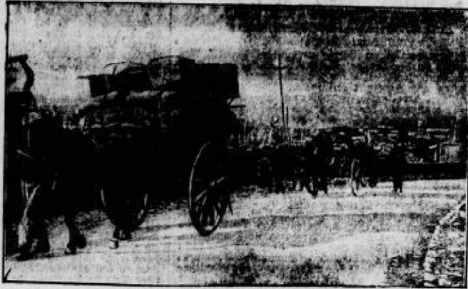
Die Flucht vor der Lava. Die Einwohner der durch den Lavaausbruch des Ketna bedrohten Ortschaften versuchen bei der Räumung ihrer Häuser möglichst viel von ihrer Habe zu retten. Die traurigen Sätze der Flüchtlinge auf den Landstrassen erinnern an die trostlosen Bilder des Krieges.