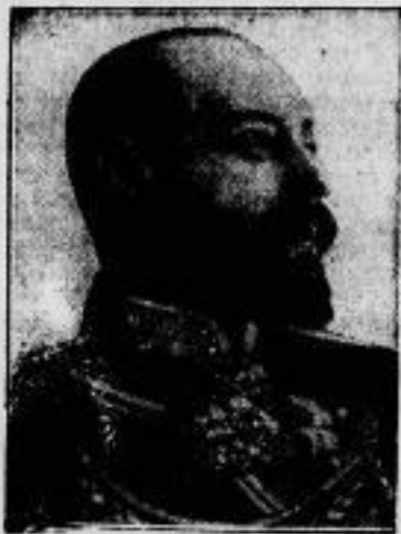
Der frühere russische Ministerpräsident Treshow f.

Der ehemals russische Ministerpräsident Treshow, der 1916 der Nachfolger des Ministerpräsidenten Stürmer wurde, ist in Riga an einem Schlaganfall gestorben.