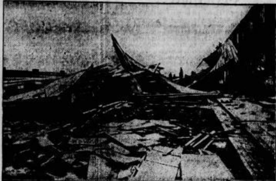
Die Trümmerstätte eines durch den Sturm zum Einsturz gebrachten Gebäudekomplexes, der sechs Wohnhäuser umfaßte, bei Elberfeld.