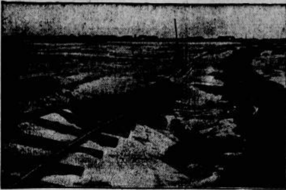
Der Bahnkörper der Kleinbahn Westerland-Örnsum auf Sylt, der durch die Sturmflut zerstört wurde.