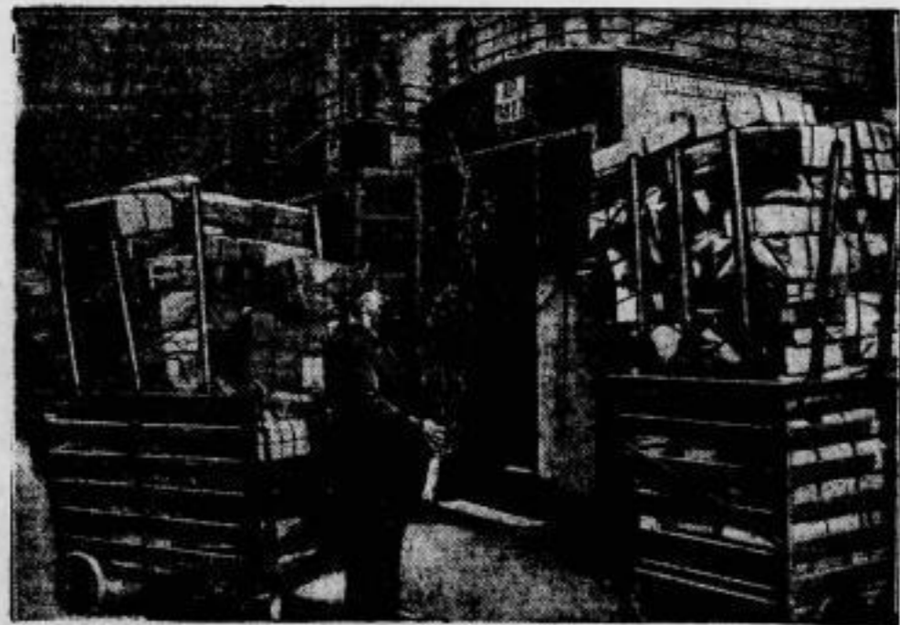
Dem Weihnachtstief entgegen,