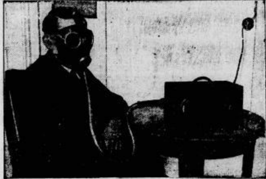
Trost für Asthmatiker "A eine neuerdings von Herzen konstruierte Maske, die Krankheitserreger in der Größe von einhunderttausendstel Millimeter noch zurückhält und den Kranken absolut keim- freie Luft zuführt. Die dauernde Behandlung hat aus- gezeichnete Erfolge gezeigt. Auch bei schweren Asthma- anfällen gewährt die Maske, die an jede Vordrüse an- geschlossen werden kann, große Erleichterung."