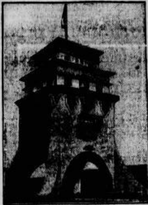
Ein Fliegerdenkmal als Fliegerleuchtturm Dem Gedenken des als Nationalheld ge- feierten mexikanischen Fliegerhauptmannes Miguel Carranza, der mit seinem Flugzeug durch einen Blitz getroffen wurde, ist in La- Juana (Mexiko) ein Turm errichtet worden, der gleichzeitig als Leuchtturm für nächtliche Flieger dient.