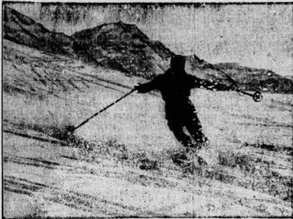
Der Winter ist da, und in den Bergen, auf denen schon der erste Schnee liegt, beginnt der Wintersport.