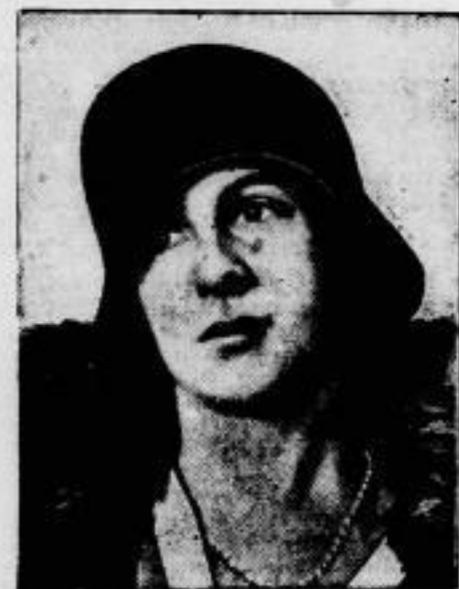
Jeanette Lindbergh, die Frau des Nationalhelden von U. S. A., soll sich mit der 25-jährigen Miss Elizabeth Morrow, der Tochter des amerikanischen Botschafters in Mexiko, verlobt haben.