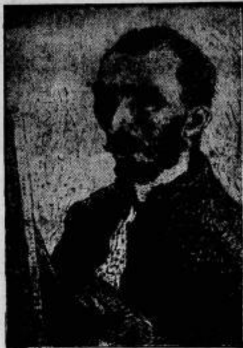
Der Kampf um die Echtheit der Van Gogh's,

die zuerst von dem Amsterdamer Kunsthändler de la Falck bestritten wurde, ist vollständig unentschieden. Auch das hier angelegte bekannte Selbstporträt des Meisters soll eine Fälschung sein.