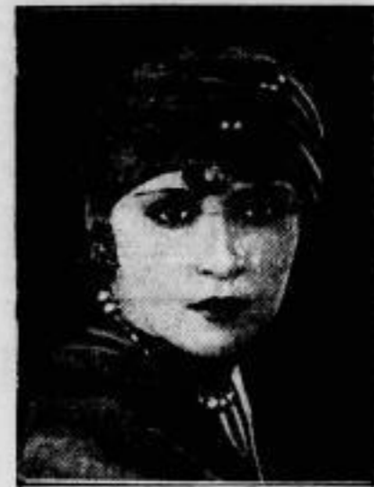
Olga Brink, die gefeierte Berliner Filmschauspielerin, und mehrere andere Personen sind nach dem Genuß eines von einem Magnetenpathen verordneten Nervenkraftmittels unter schweren Verbrennungs- und Vergiftungserscheinungen erkrankt.