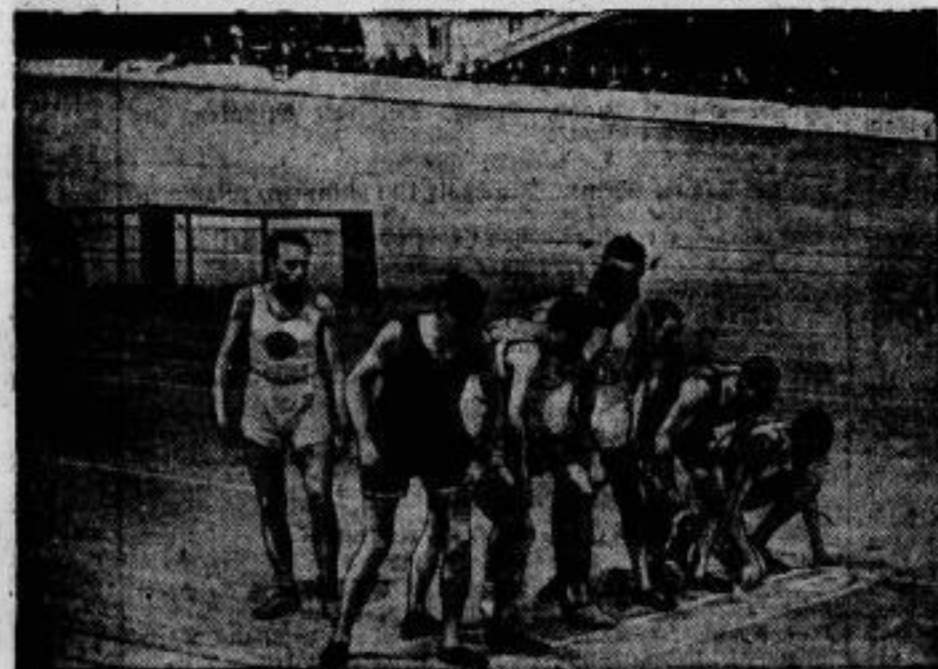
Beim 17. Hallenwettkampf,

Vom 1. Dezember ist auf seinem Bankbilletts bei Ostfeld unweit Hamburg der Vater Graf Vossold von Kalkreuth im Alter von 78 Jahren gestorben. Graf Kalkreuth wirkte als Direktor an der Kunstschule in Weimar, später in Karlsruhe. Um die Jahrhundertwende übernahm er die Leitung der Stuttgarter Akademie. Als erster Präsident des Deutschen Künstlerbundes hat Kalkreuth lange Zeit den Platz eines Führers und Repräsentanten der jüngeren deutschen Künstlerwelt eingenommen.