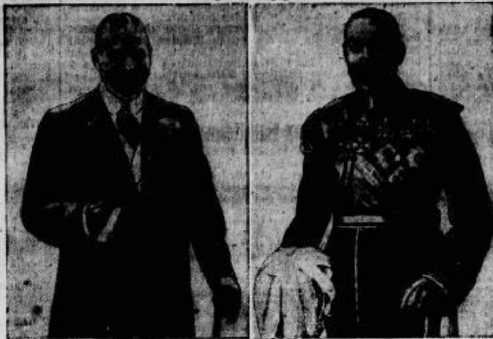
In Zivil und — Der König in Uniform.