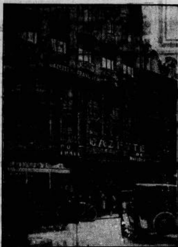
Die Finanzschwindel der „Gazette du Franc“ in Paris, in den eine Reihe prominenter Persönlichkeiten verwickelt sind, hat in ganz Frankreich ungeheure Erregung hervorgerufen. Die Nachricht von dem Skandal, bei dessen Untersuchung ein Defizit von 120 Millionen Franken fest- gestellt wurde, verursachte natürlich einen Sturm der Gesche- digen auf das Gebäude der „Gazette du Franc“ (im Bilde).