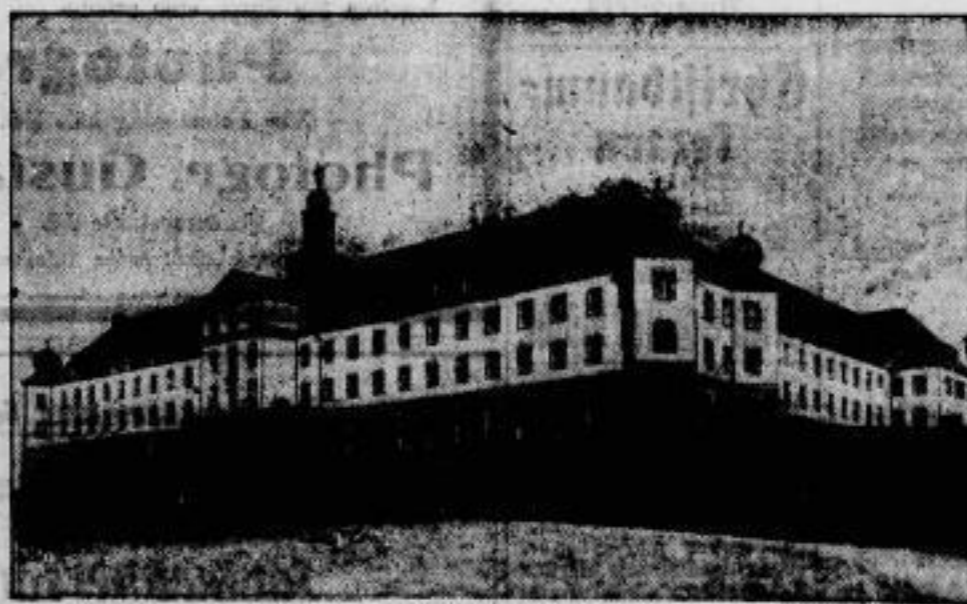
Deutschlands größtes Friedensseminar in Bensberg bei Köln wurde soeben fertiggestellt.