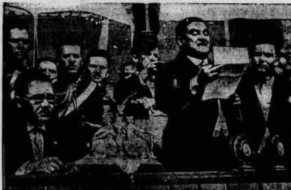
Amidantizität des mexikanischen Staatspräsidenten.

Vorles Ol, der neue Präsident von Mexiko, beim Verlesen seiner Antrittsrede, an die anschließend er den Eid auf die Verfassung ablegte.