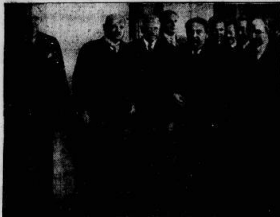
Schulter an Schulter in Lugano.

Ein Bild von der Tagung des Völkerbundes (von links): Staatssekretär v. Schubert, Reichsaußenminister Dr. Stresemann, französischer Außenminister Briand (der vierte), italienischer Delegationsführer Senator Scialoja.