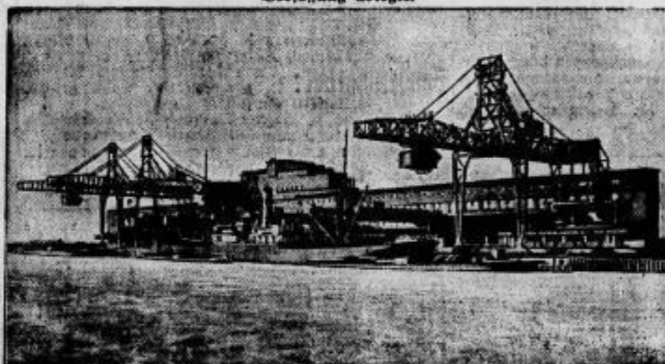
Eine neue Speicher- und Verladeanlage im Bremer Kali-Ofen.

Um den berechtigten Wünschen des Publikums nach sachgemäßen Gerichtsentscheidungen in Verkehrsangelegenheiten zu entsprechen, wird beim Amtsgericht Berlin-Mitte eine besondere Abteilung für Verkehrsangelegenheiten eingerichtet, deren Leitung Amtsgerichtsrat Dr. Kronheim übernehmen wird. Dr. Kronheim hat sich als Straßenbahnfahrer ausbilden lassen und nimmt zurzeit einen Kursus im Kraftwagenfahren.