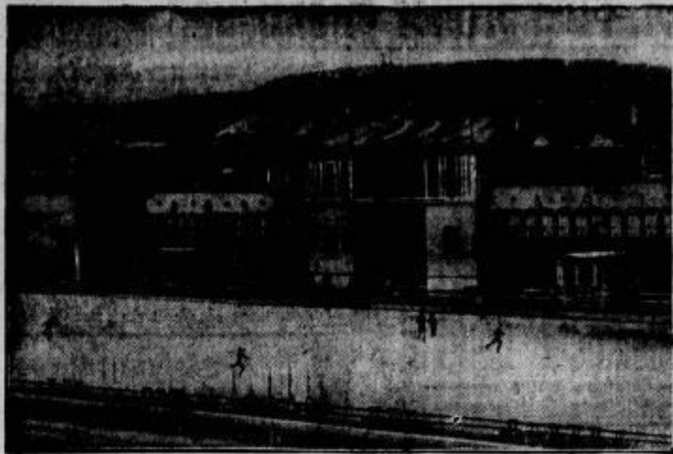
Die neue Freiluft-Straßenbahn in Stöckl bei Wien am Fuße des Wiener Waldes.