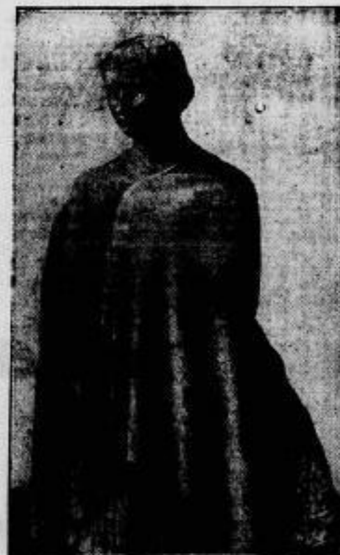
Aus dem Reiche der Kunst.

Die vom Bremer Staat für den ständig wachsenden Export deutschen Kalis nach Übersee errichtet wurde, ist am 14. Dezember ihrer Bestimmung übergeben worden. Die Lager der Anlage, in denen täglich 5000 Tonnen Kali verladen werden können, fassen 120 000 Tonnen.