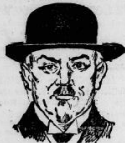
Eine neue katholisch-elfässische Partei soll am 17. Dezember von den aus der Elfässischen Katholischen Volksvereingung ausgetretenen Parteimitgliedern unter dem Vorsteher des französischen Unterstaatssekretärs für Elfäß-Verbringen, Oberkirch (im Bilde), gegründet werden.

Ein Bild von der Tagung des Völkerbundes (von links): Staatssekretär v. Schubert, Reichsaußenminister Dr. Stresemann, französischer Außenminister Briand (der vierte), italienischer Delegationsführer Senator Scialoja.