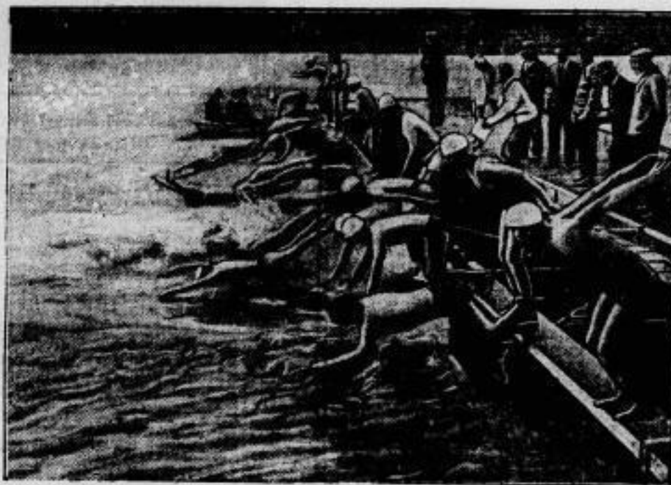
In Rom findet alljährlich ein Wettschwimmen im Tiber statt, dessen Temperatur auch in den kältesten Wintern nicht unter 10 Grad Celsius sinkt.