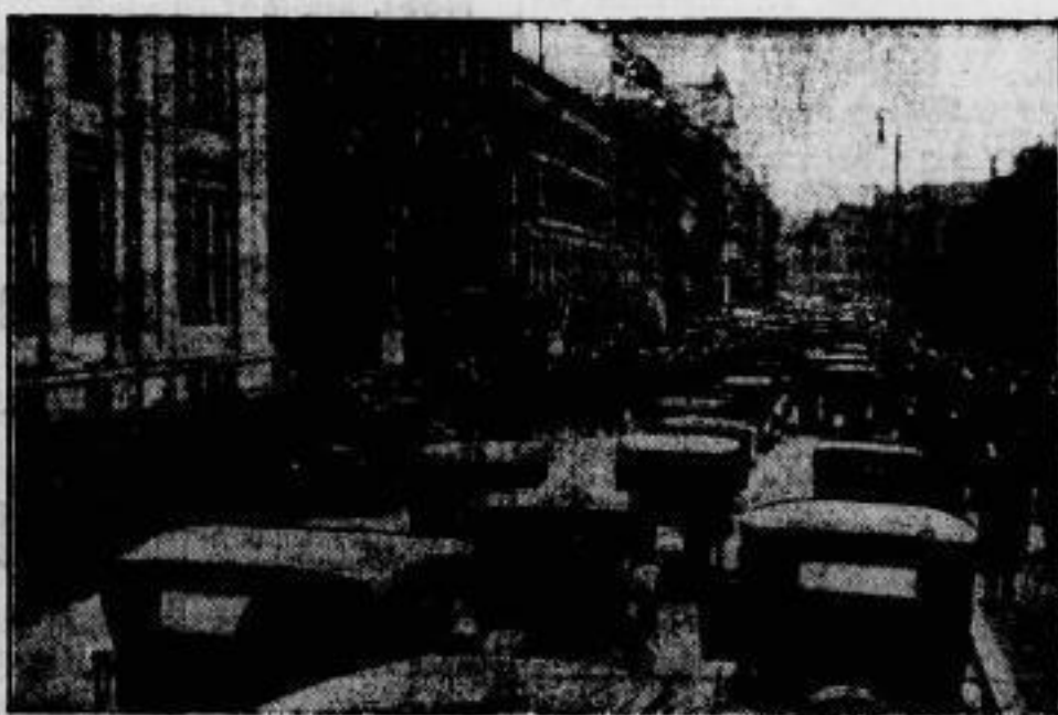
Norwegens Trauer um Amundsen. Die „3 Minuten Schweigen“, mit denen am 14. Dezember in Norwegen das Gedächtnis Amundsens geehrt wurde, war ein überwältigender Ausdruck der Trauer um den Nationalhelden, der bei einem Rettungsversuch für die schiffbrüchige Mannschaft des Nordpolarschiffes „Italia“ sein Leben geopfert hat. Wir zeigen die in andächtigem Schweigen verharrende Menge in der Karl-Johann-Gate, der Hauptstraße von Oslo.