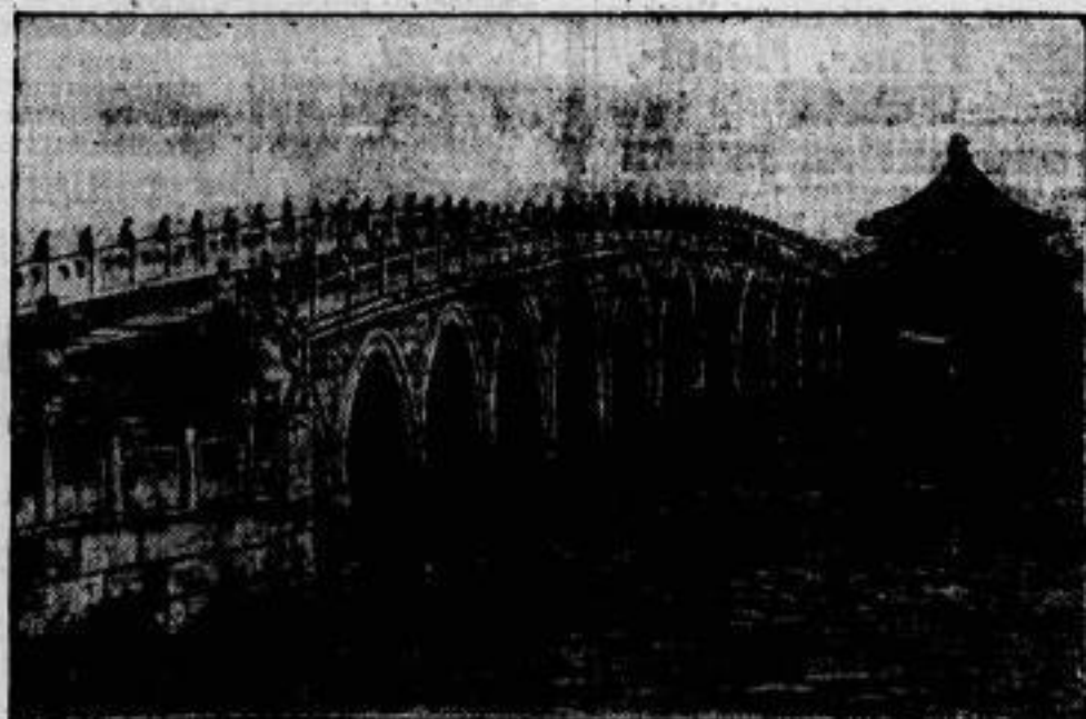
Reiterwerke der Architektur. Ein Bild aus Alt-China. Marmorbrücke am Kaiserlichen Sommerpalast bei Peking.