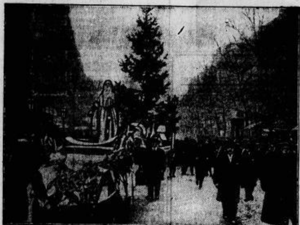
In Paris wird ein Weihnachtsmann mit dem Weihnachtsbaum durch die Straßen gefahren.