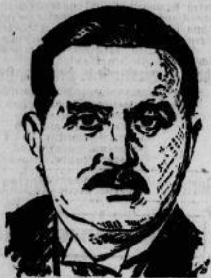
Der Präsident von Paraguay, Guggiar, der die Mobilisierung von zehn Jahrgängen angeordnet hat.