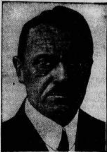
Zum dritten Mal wenatspräsident von Danzig wurde Dr. Heinrich Sahn, der durch den Volksstag der Freien Stadt am 18. Dezember wiederum gewählt wurde.