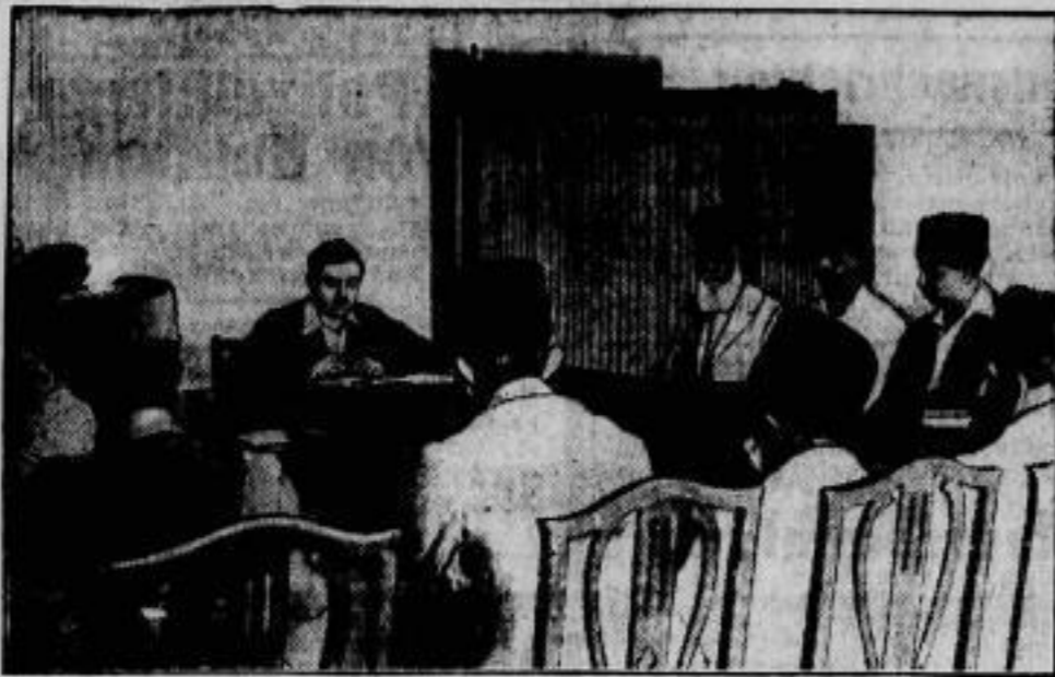
König Aman Allah (im Hintergrund) mit seinen Ratgebern.

tanen verwickelt. Gerade seine Reformbestrebungen, die nur mit denen des Zaren Peters des Großen verglichen werden können, weckten die Unzufriedenheit des Landes, das für die Absichten des Königs kein Verständnis hatte.