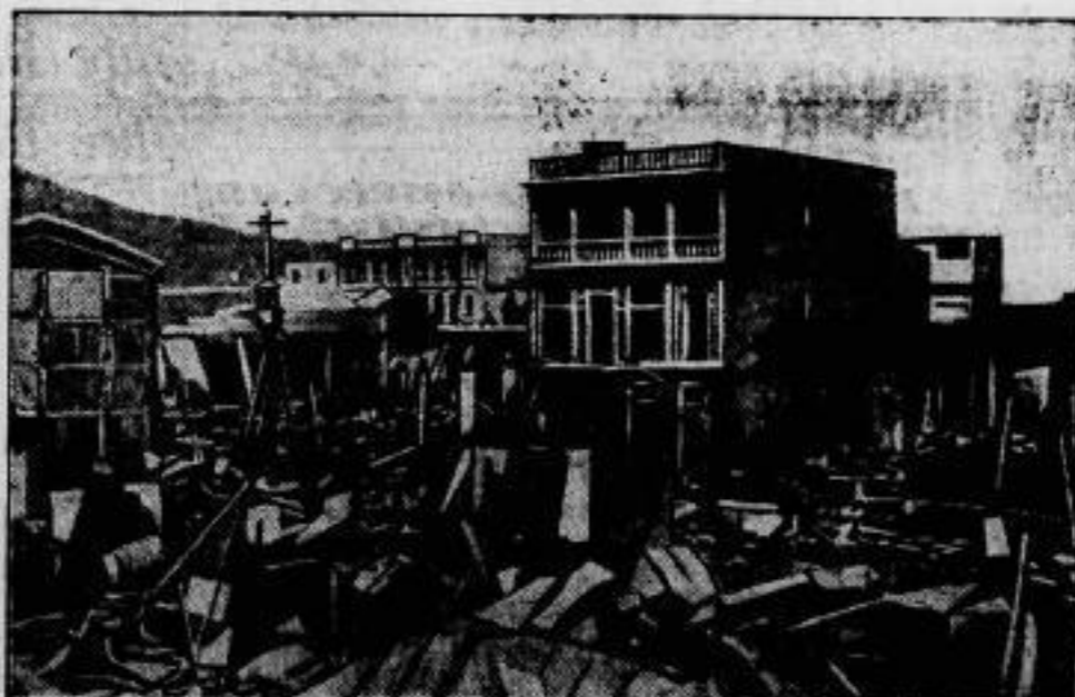
Das erste Bild von dem Erdbeben in Chile, das vor einigen Wochen blühende Landstriche verwüstete. Besonders zu leiden hatte Talca (im Bilde), eine Stadt von 40 000 Einwohnern in der die meisten Häuser zerbröckelt und 150 Personen getötet wurden.