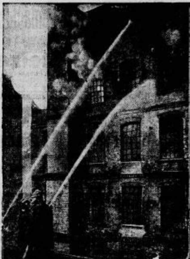
Brandkatastrophe in Berlin. Am 18. Dezember brach in einem Industriehaus im Süden Berlins ein Brand aus, der infolge Explosion der dort verarbeiteten Mengen von Zelluloid in wenigen Minuten die gesamten 4 Stockwerke ergriff. Mehr als 30 Personen, von denen drei bereits ihren Verletzungen erliegen sind, wurden teils durch Brandwunden, teils beim Herabspringen auf den Hof schwer verletzt.