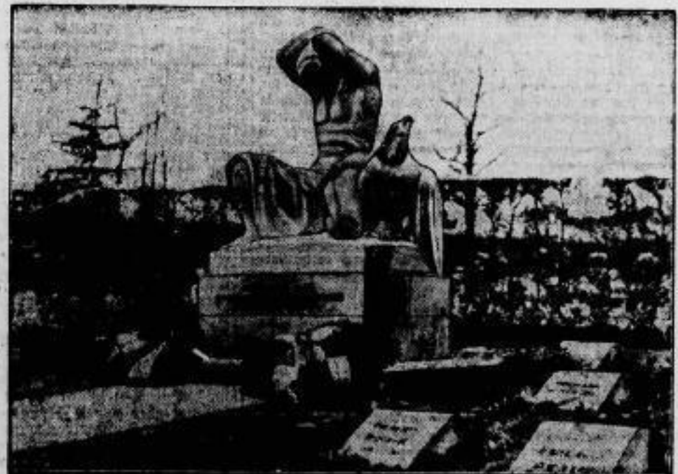
Den Opfern der Ruhrbefehung. den am Osterfestabend 1923 von den Franzosen erschossenen 13 Kruppischen Arbeitern, wurde auf ihrer Begräbnisstätte in Essen ein Denkmal gesetzt.