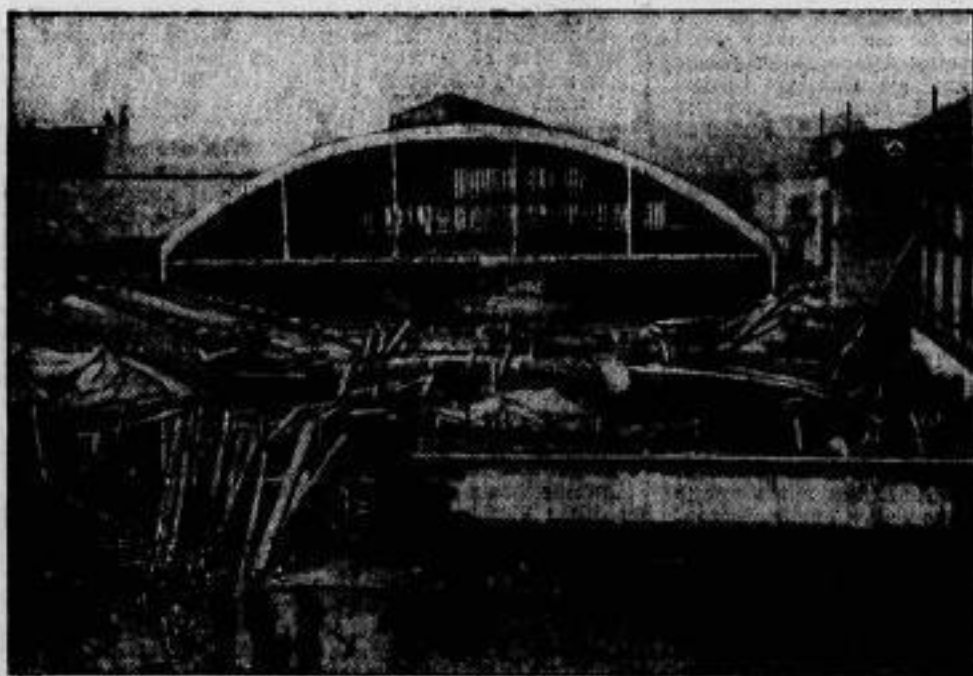
Eine neue Einkurzleischtoppe in Frankreich ereignete sich am 24. Dezember in Saumur, wo ein auf dem Gelände der Kavallerieschule errichteter Beton-Neubau von 60 Metern Länge und 20 Metern Höhe einstürzte und 20 Arbeiter unter sich begrub. Acht Tote und fünf Verletzte sind die Opfer dieses neuen Einkurzungsunglücks.