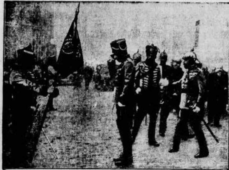
Jugendweibe in Spanien. König Alfons von Spanien weihte feierlich das neue Waffensmuseum in Madrid ein.