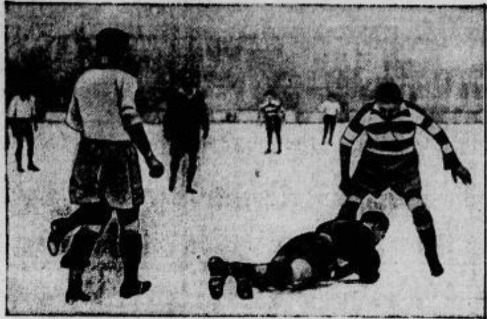
Hertha-B. S. C. gegen Teplitzer F. C. Das Spiel des Berliner Meisters Hertha-B. S. C. gegen den Teplitzer Fußballklub W., das am ersten Vortag in Berlin ausgetragen wurde, endete unentschieden 1:1. Dieses Ergebnis ist für die deutsche Mannschaft um so ehrenvoller, als die Tschechen als eine der stärksten Berufsspielmannschaften des Kontinents gelten. — In unserem Bilde hat sich der Teplitzer Torwart auf den Ball geworfen, ein Hertha-Spieler sperrt.