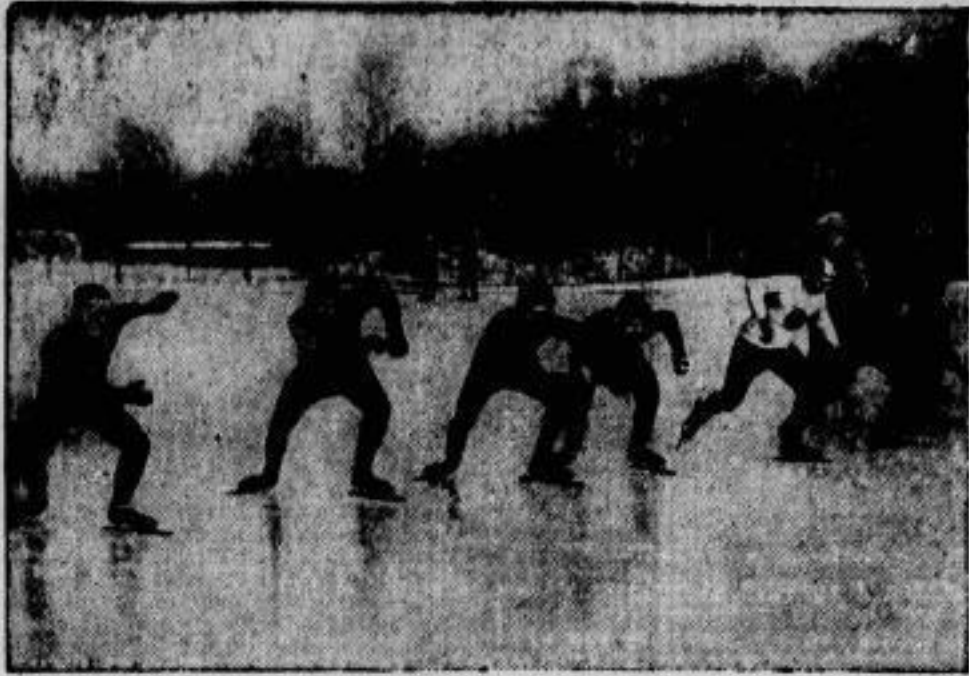
Ein Massenlauf zum Eiswettlauf nach amerikanischem Vorbild wurde zum erstenmal bei der im 28. Dezember in Berlin abgehaltenen Werbeveranstaltung des Brandenburgischen Eisportverbandes durchgeführt. Wir zeigen den Start zum 1500-Meter-Lauf, in dem Müller (welcher Sweater) vom Berliner Sp.-Cl. überraschend führt.