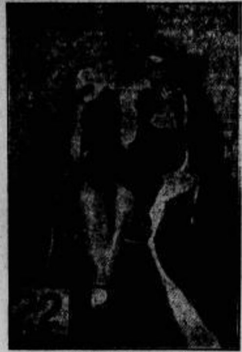
Ist sie die Schöne? Irma Oßler, die (mal wieder) neu gewählte deutsche Schönheitskönigin, die als „Miss Germany“ Deutschland bei der internatio- nalen Schönheitskonkurrenz in Amerika ver- treten wird.

Die Gaskatastrophe, durch die Duisburg am Neujahrstage betroffen wurde, hat eine Reihe von Toten und zahlreiche Schwertrante als Opfer gefordert. Das Unglück ist auf das Blähen des Schweihnachts eines Gasleitungsrohres zurückzuführen. — Unser Bild zeigt die Unfallschätte. Rechts das Unglücks- haus, dessen Bewohner dem Gas zum Opfer fielen.