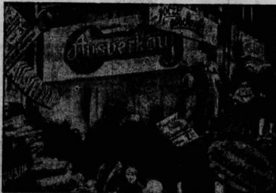
Wochentags der Frauen.

Die Stadt steht im Zeichen der Inventurausverkäufe.