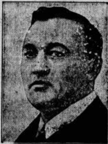
Regierungsrücktritt in Belgrad. Der jugoslawische Ministerpräsident Dr. Radosch hat am 30. Dezember die Gesam- demission des Kabinetts gegeben. Die Ent- scheidung über die Annahme der Demission wird erst in einigen Tagen fallen.