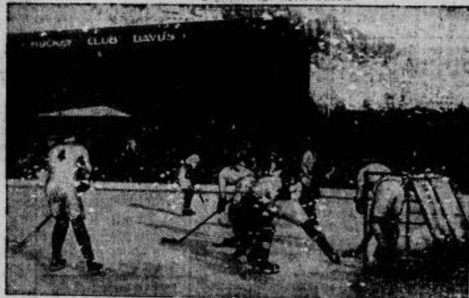
Das Entscheidungsspiel um den Spangler-Pokal

das in Davos zwischen dem Berliner Schlittschuhklub und der Mannschaft der Universität Cambridge ausgetragen wurde, endete mit dem Sieg der deutschen Spieler 1:0. Der Berliner Schlittschuhklub hat damit in dem Wettbewerb um die Davoser Trophäe, um die er fünfmal und jedesmal in der Schlussrunde gekämpft hat, jetzt dreimal gesiegt und damit den Pokal endgültig gewonnen. Unser Bild gibt ein Kampfbild vor dem englischen Tor wieder.