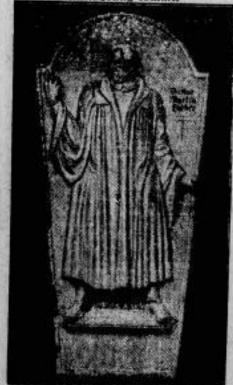
Luther in Stein.

Die Stadt steht im Zeichen der Inventurausverkäufe.