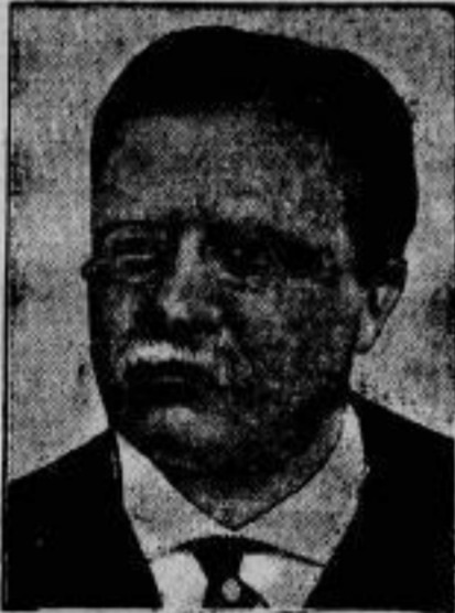
Der Todestag Theodor Roosevelts, des Präsidenten der Vereinigten Staaten, fällt sich am 4. Januar zum zehnten Male.