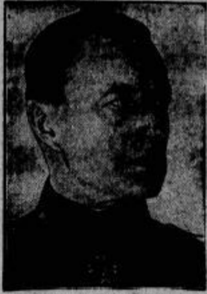
Generalleutnant v. Stölpnagel, der bisherige Infanterieführer des Wehr- kreises 7 (Stuttgart) übernimmt das Kom- mando des Reichsregiments IV (Dresden).