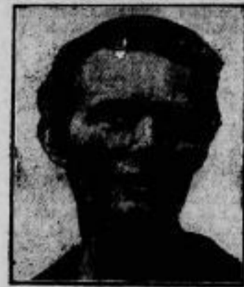
Erster Unfall der Frau Dr. Lüders. Die demokratische Reichstagsabgeordnete Frau Dr. Lüders verunglückte beim Robeln mit ihrem kleinen Sohn. Der Schlitten eines überholenden Radlers traf sie im Rücken und führte eine außerordentlich schmerzhaftes Nierenquetschung herbei.

arbeiteten die Eindringler, die dem Postamt der Station Rattum bei Breslau einen Besuch abstatteten und hierbei 15 000 Mark erbeuteten. — Links: der gepregte Geldschrank. Rechts: die Verwüftung, die durch die Sprengung in dem Amtszimmer angerichtet wurde.