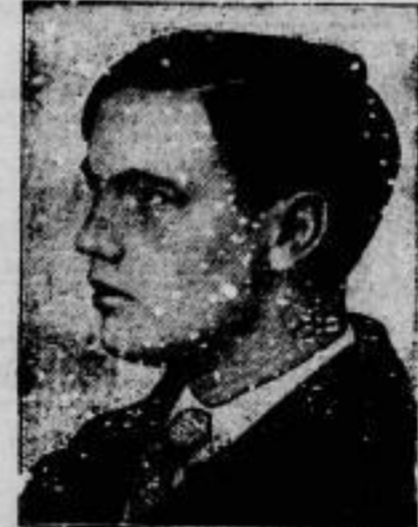
Französische Musik an deutschen Bühnen. Ein junger französischer Komponist, Georges Antheil, schrieb die Musik zu „Oedipus“, der Tragödie des Sophokles, die am 4. Januar im Berliner Staatstheater zur Aufführung kommt.

das in Davos zwischen dem Berliner Schlittschuhklub und der Mannschaft der Universität Cambridge ausgetragen wurde, endete mit dem Sieg der deutschen Spieler 1:0. Der Berliner Schlittschuhklub hat damit in dem Wettbewerb um die Davoser Trophäe, um die er fünfmal und jedesmal in der Schlussrunde gekämpft hat, jetzt dreimal gesiegt und damit den Pokal endgültig gewonnen. Unser Bild gibt ein Kampfbild vor dem englischen Tor wieder.