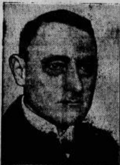
Aus der Reichsmarine ausgeschieden ist der Befehlshaber der Streitkräfte der Nordsee, Konteradmiral Souchon, dem hierbei der Charakter als Vizeadmiral verliehen wurde.