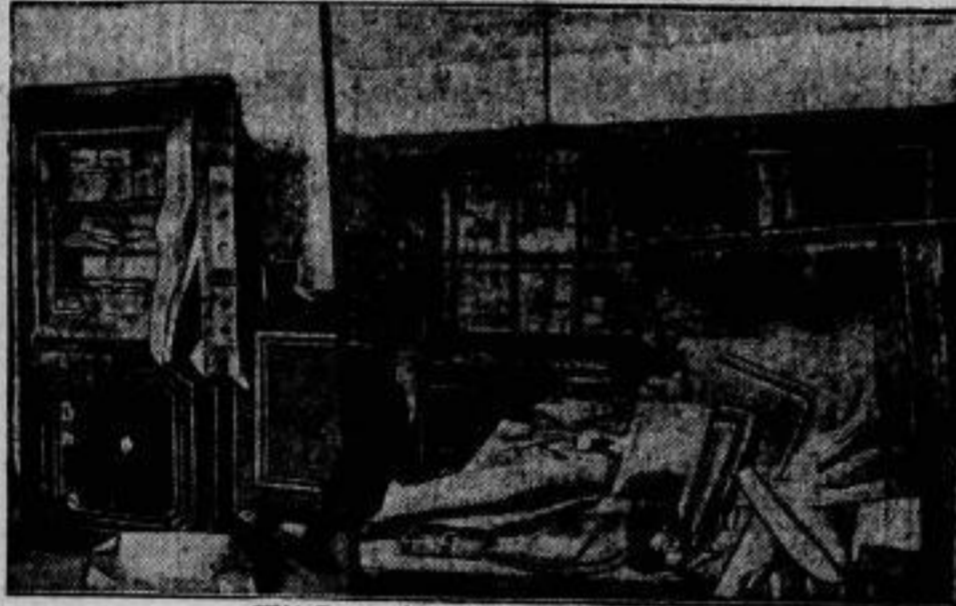
Mit Dynamit gegen den Bankräuber

arbeiteten die Eindringler, die dem Postamt der Station Rattum bei Breslau einen Besuch abstatteten und hierbei 15 000 Mark erbeuteten. — Links: der gepregte Geldschrank. Rechts: die Verwüftung, die durch die Sprengung in dem Amtszimmer angerichtet wurde.