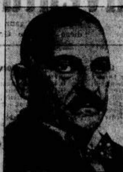
Über von links nach rechts.