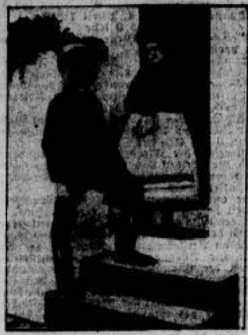
Burgenländisches Webzeug aus Wülfnig am Neufeldersee.