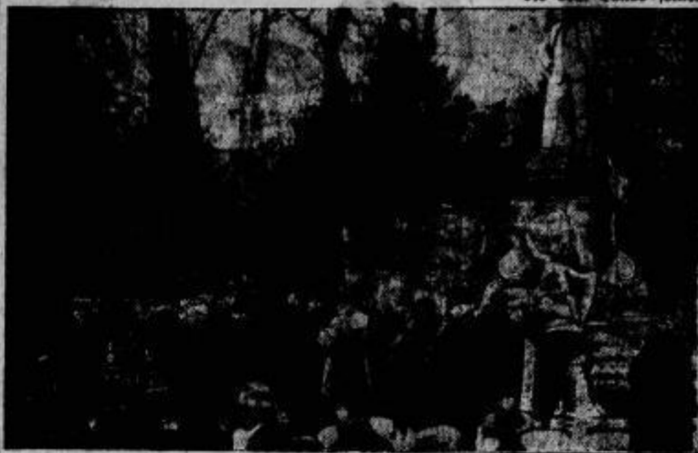
Beisetzfeier in Berlin. Am Lessing-Denkmal im Berliner Tiergarten fand am 22. Januar, dem 100. Todestage des Dichters, eine Beisetzfeier statt, bei der Oberbürgermeister Böhm im Namen der Stadt Berlin und Ludwig Fulda für die Dichterkademie Kränze niederlegten.