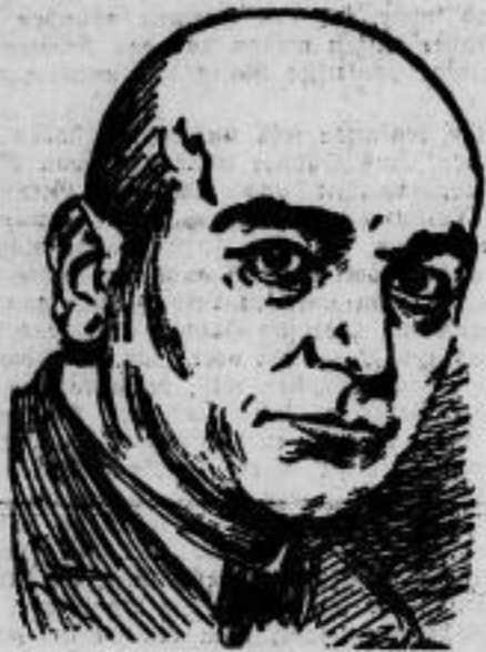
Der Sejm-Abgeordnete Miß, der Führer des Deutschen Volksbundes in Böhlich-Oberschlesien, wurde wegen angeblichen Landesverrats verhaftet. Der Volksbund hat beim Völkerverband Beschwerde eingelegt, die bei der im Zeichen der Winderbeitenfrage stehenden Wärsatung verhandelt werden soll.