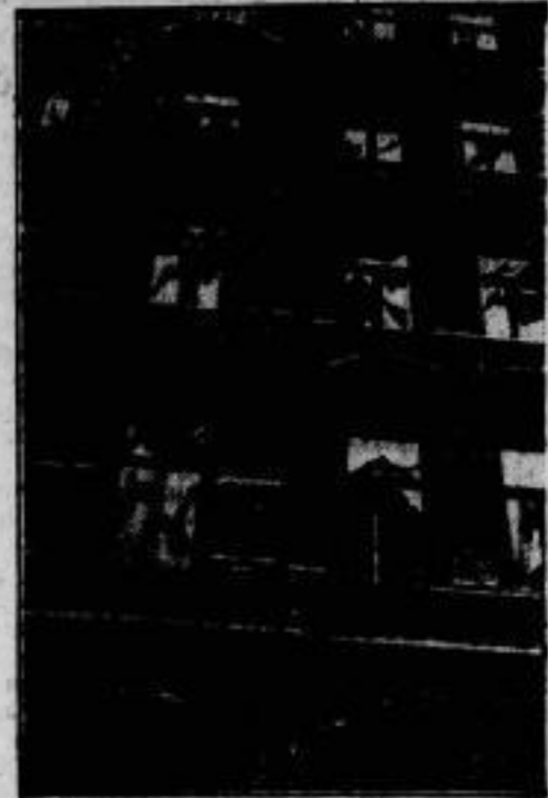
Wie die Häuser in der Nachbarschaft aussehen.