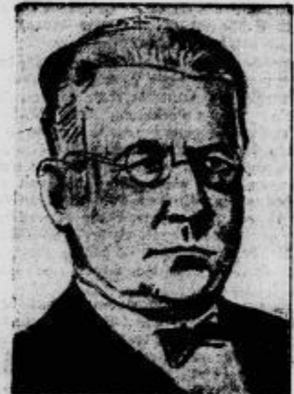
Reichstagsabgeordneter Saenger f. Der sozialdemokratische Reichstagskandidat für Oberbayern-Schwaben, Alwin Saenger, ist an den Folgen einer Operation am 18. Februar im Alter von 47 Jahren gestorben.