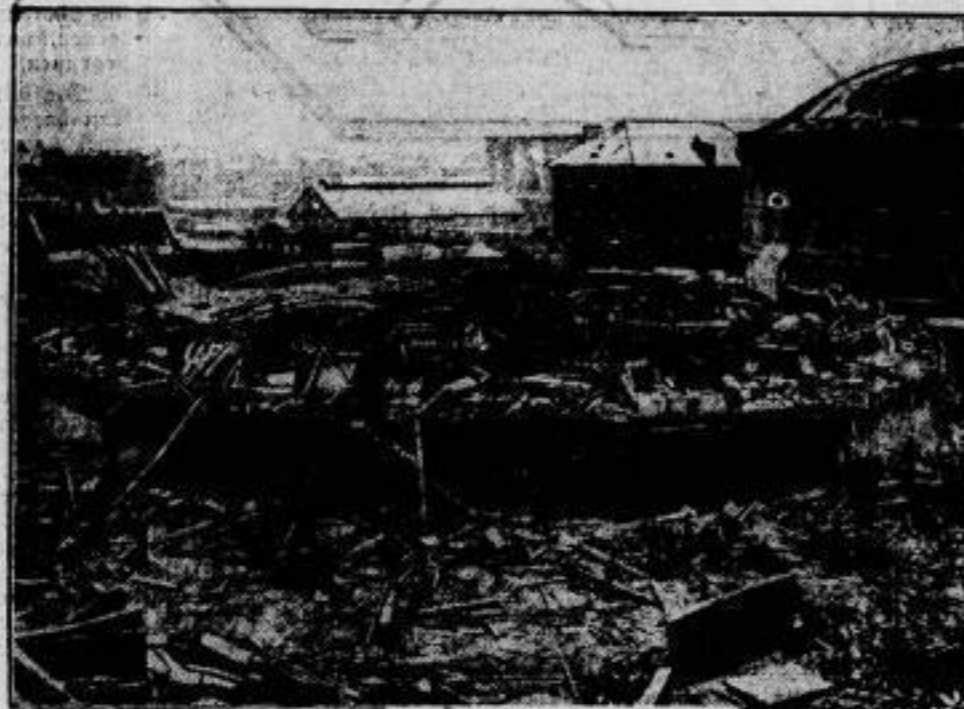
Die Trümmerstätte am nächsten Morgen.