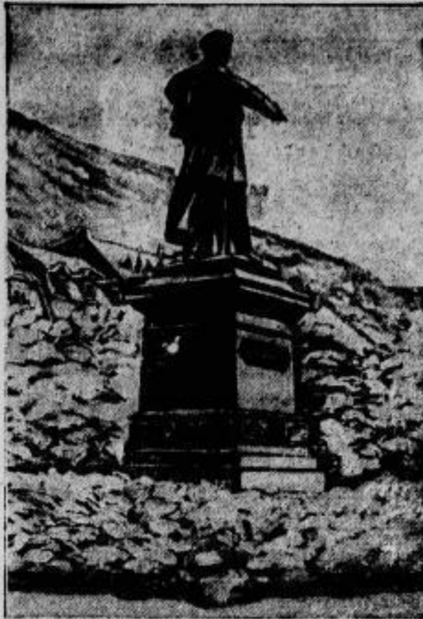
Durch das drohende Hochwasser des Rheins gefährdet ist das Räderdenkmal in Cöln, das zum Gedenken an den in der Neujahrnacht 1818/19 hier erfolgten Uebergang Blüchers über den Rhein errichtet wurde. Jetzt wird das Denkmal durch behelfsmäßige Schutzwehren in Verteidi- gungszustand versetzt.