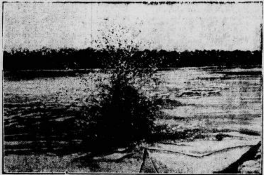
Im Kampfe gegen die Vereisung der Flüsse, zur Abwendung des drohenden Hochwassers, werden Explosionen des Eises — wie wir sie zeigen — die wirk- samste Waffe bieten. Die Maßnahmen zu solchen Explosionen werden daher überall an den großen Flüssen vorbereitet.