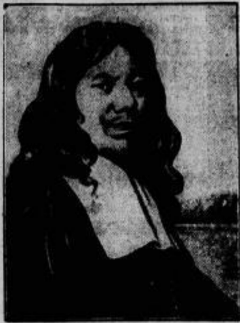
Der 250. Todestag von Jan Steen, dem großen niederländischen Genremaler, wird in diesem Monat in Holland mit großen Gedenkfeiern begangen. — Wir zeigen des Malers Selbstbildnis, das im Amster- damer Reichsmuseum hängt.