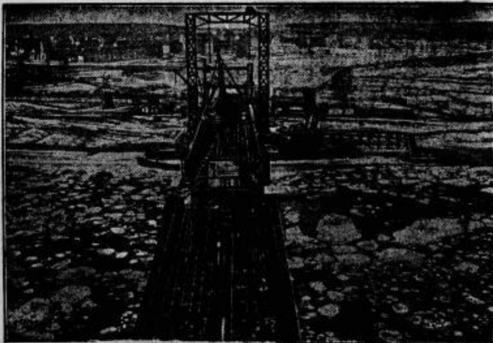
Der Bau der neuen Wiener Rheinbrücke in einer Höhe von 60 Metern über dem mit Eisbänken bedeckten Strom.