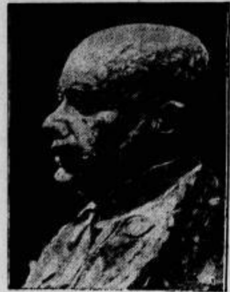
Gunnar Heiberg †. Der berühmte norwegische Schriftsteller Gunnar Heiberg, dessen Dramen im letzten Jahrzehnt des vergangenen Jahrhunderts großes Aufsehen erregten, ist nach längerer Krankheit im Alter von 71 Jahren in Oslo gestorben. — Die hier gezeigte Skizze des toten Dichters ist ein Werk des Bildhauers Gustav Vigeland.