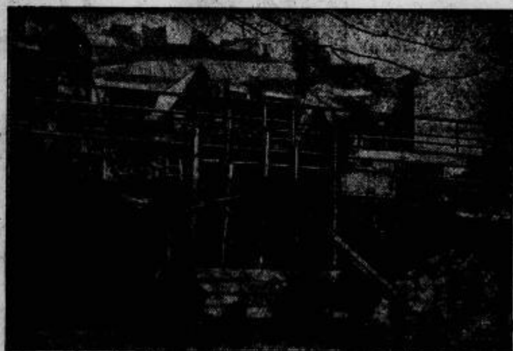
Verteidigungsmaßnahmen gegen das brohende Schneewetter werden jetzt überall an den großen Plätzen getroffen. In Budaörs am Rhein wurden Eisenbahn-Unterführungen, durch die das Wasser bis in die Stadt ergießen könnte, verbarrikadiert.