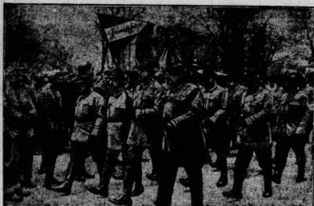
Der Aufmarsch der Heimwehren am 24. Februar.