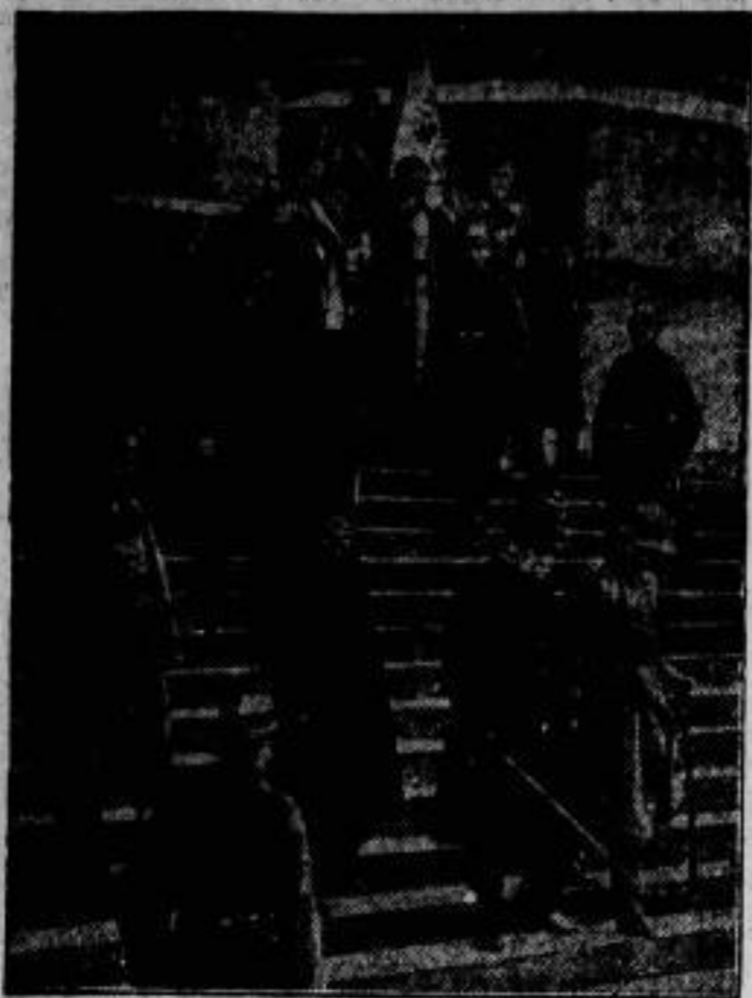
Reichspräsident von Hindenburg verläßt mit seinem Sohn, Oberleutnant v. Hindenburg (rechts), Reichswehrminister Groener und dem stellvert. Chef der Heeresleitung, General v. Tschischwitz (links), das Reichstagsgebäude nach der Gedenkfeier.