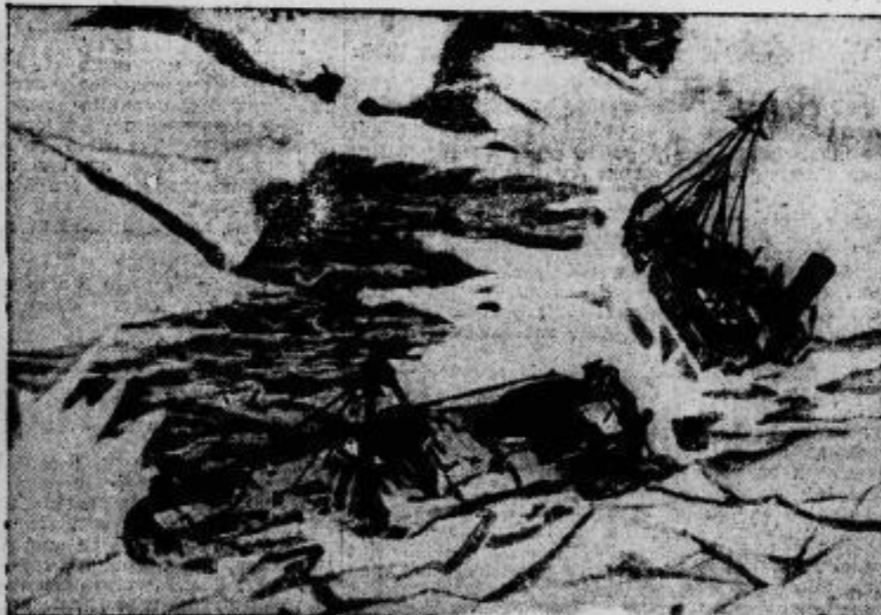
Durch die Gewalt des Eises zerissen wurde der Dampfer „Dallara“, der vor vier Wochen in der Weichselmündung auf Grund lief und jetzt unter dem Druck der Eismassen in zwei Teile brach.