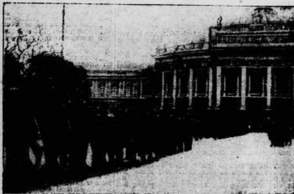
Die gleichzeitige Kundendemonstration des Republikanischen Schutzbundes.