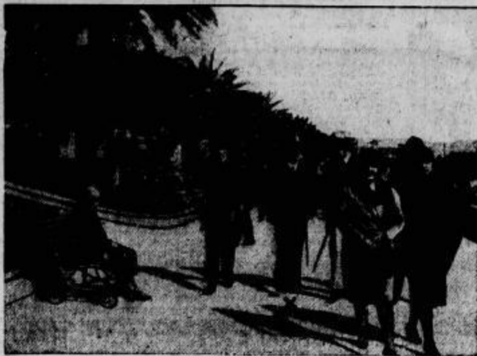
Strefemann in San Remo. Der Reichsaußenminister (><), der sich nach der Genfer Tagung des Völkerbundesrates zur Erholung nach San Remo begeben hat, beim Spaziergang auf der dortigen Kurpromenade.