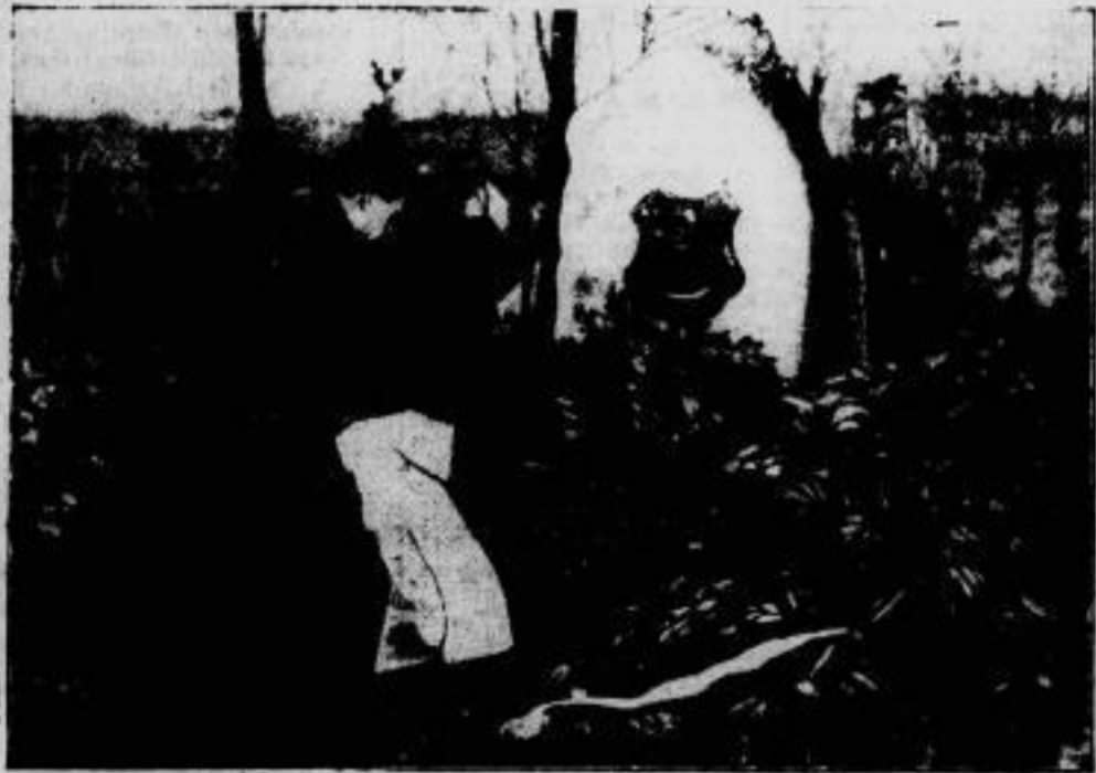
Kanada ehrt Gänsefeld. Im Auftrage des Deutsch-kanadischen Verbandes von Saskatchewan legte Chefredakteur Bött auf Regina (Kanada) einen Kranz am Grabe des Ozeanfliegers von Gänsefeld nieder, im Gedenken an die Landung der Ost-West-Flieger auf der kanadischen Insel Greenly-Insel.