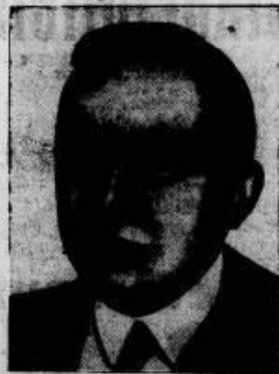
Der neue Verwaltungsdirektor der Charité in Berlin ist Oberregierungsrat von Bamberg.