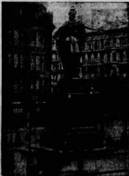
Hollischland — und doch außer Rand gelehrt ist die „Verolina“, die Jahresteilung ihre Hand schlugen über den Berliner Alexanderplatz hielt und dann wegen der grundlegenden Umgestaltung des Platzes entfernt werden mußte. Jetzt soll die Brunnensäule verteidigt werden.