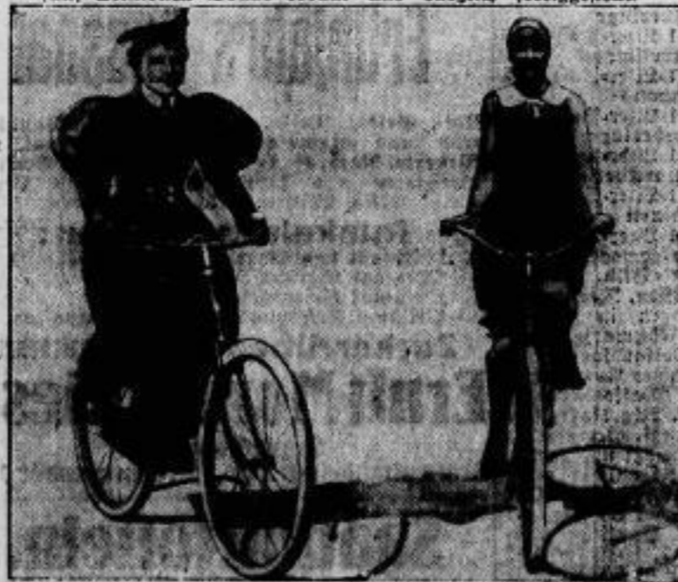
Einmal und jetzt. Mehr kann man hierzu nicht sagen!