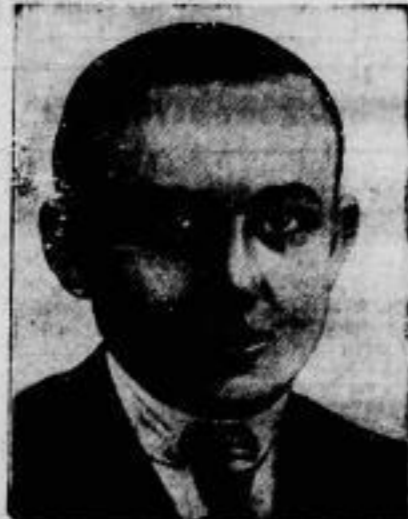
Unschuldig zum Tode verurteilt?

Das Feld des Rosenberg-Jagdrennens, das das Hauptereignis des ersten Rennfestes in Berlin-Karlsdorf am 11. April war, nimmt den Wassergraben.