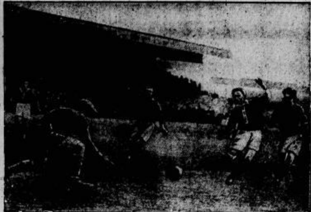
Ein unentschiedenes Spiel Nachdem am 21. April in Berlin eine der Spitzenmannschaften aus dem Weltmeisterlande Uruguay, die Rampla Juniors, den Berliner Tennis-Vorussen, das sie mit aller- dings hervorragender Technik, aber in durchaus unfairem Kampfstilweise 1:0 gewannen. — Im Bilde: der Torwäch- ter der Gäste schlägt einen Angriff von Tennis-Vorussen ab.