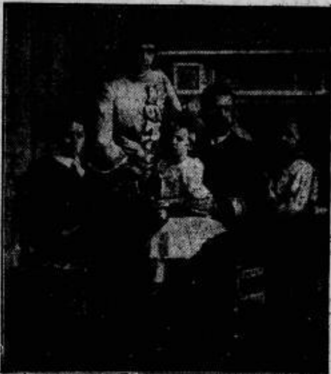
Sam Tage des Prinzen Heinrich von Preußen. Ein Bild aus vergangenen Tagen: Prinz Heinrich mit seiner Gemahlin, der Prinzessin Irene von Hessen und bei Rhein, und seinen Kindern, (von links) den Prinzen Waldemar, Heinrich und Sigismund.