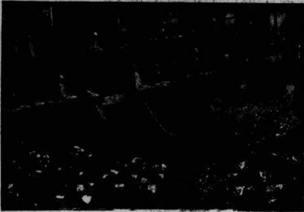
Die Hundertjahrfeier des Deutschen Archäologischen Instituts. wurde am 21. April durch einen Festakt im Reichstags- gebäude im Beisein zahlreicher Archäologen Deutschlands und des Auslandes, des gesamten diplomatischen Korps und der Vertreter der Regierung bezeugt. Im Bilde: die Rede des preussischen Kultusministers Weder. Links auf der Ministerstafel (von rechts) Reichsaussenminister Dr. Stresemann und Reichsinnenminister Seegering.