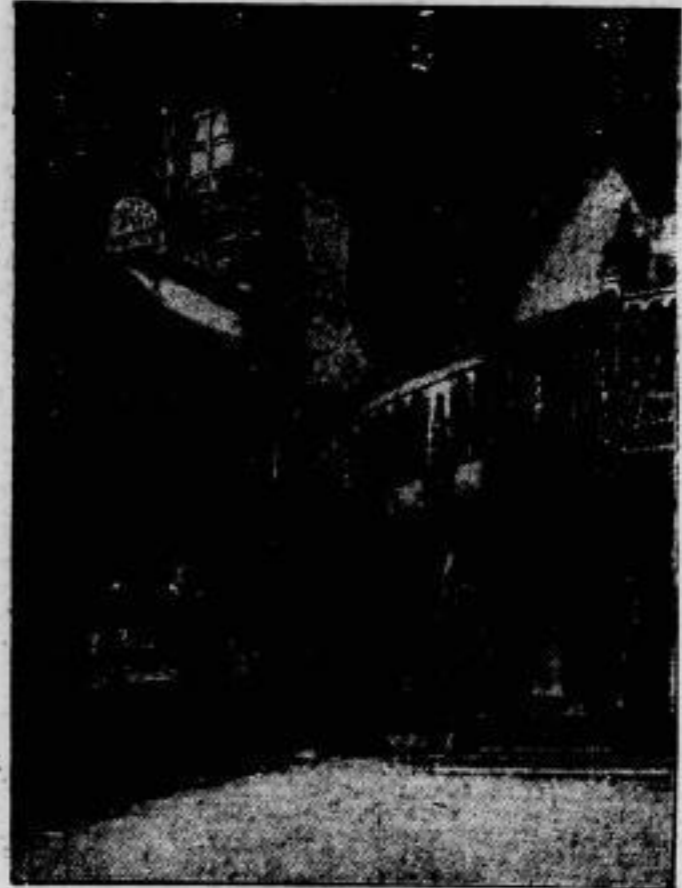
Meisterwerke der Architektur. Aus der alten Gassestadt Danzig Die „Danziger Ziele“.