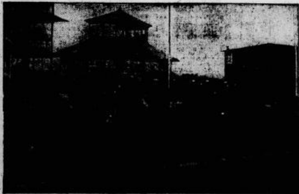
Das Dudenstad-Rennen in Berlin-Mariendorf am 21. April sah als Sieger „Signal“, der in unserem Bilde vor „Dahlia“ und „König Lear“ führt.