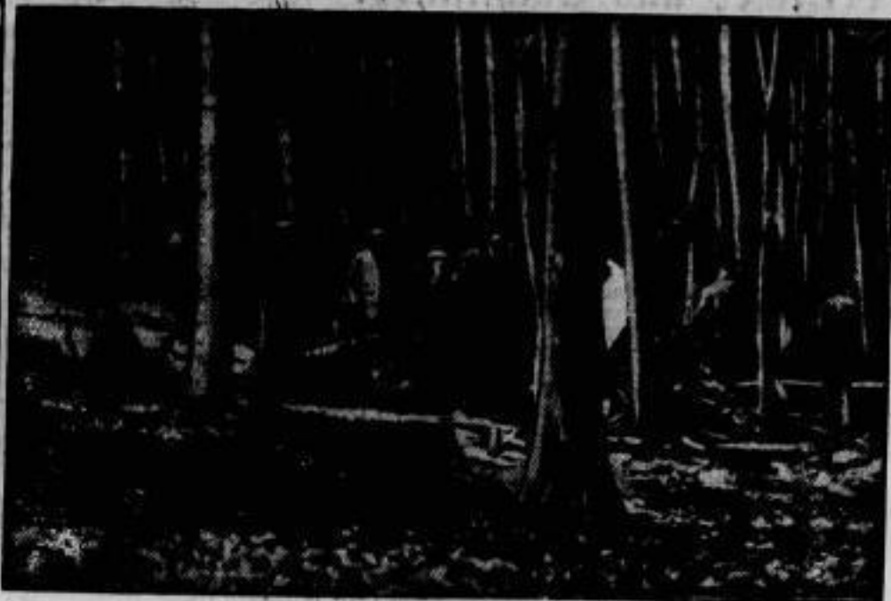
Hier verheiratete das tschechische Passagierflugzeug der Linie Prag-Kassel-Rhein-Rotterdam, das am Him- melfahrtstage in Regenwolken die Orientierung verlor und bei dem Dorfe Eiterhagen unweit Kassel in dichten Buchen- wald stürzte. Die Maschine wurde vollkommen zerschmet- tert, ihre drei Insassen auf der Stelle getötet.