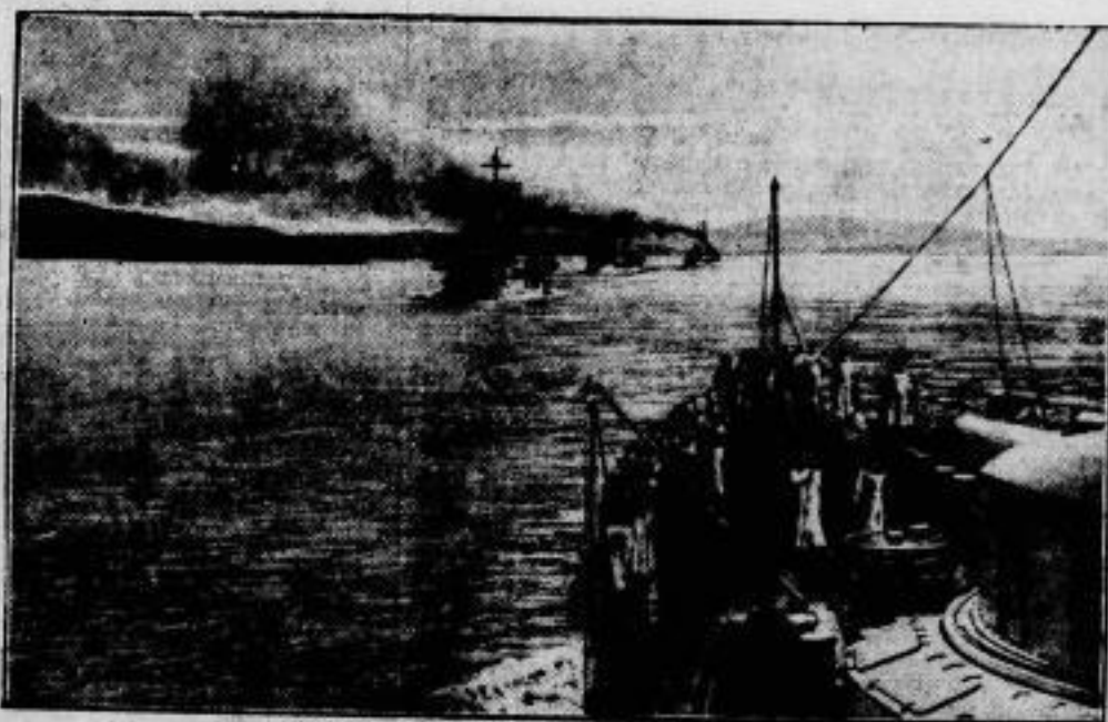
Die Spanienreise eines deutschen Geschwaders der Linienschiffe „Schleswig-Holstein“, „Sachsen“, „Elsah“ und „Hessen“ sowie der 2. und 4. Torpedobootschiffsflotte, ist erfolgreich zu Ende geführt. — Unser Bild, das von einem Fahrteilnehmer aufgenommen wurde, zeigt das Geschwader der Linienschiffe in der Krosabucht an der Nordwestküste Spaniens.