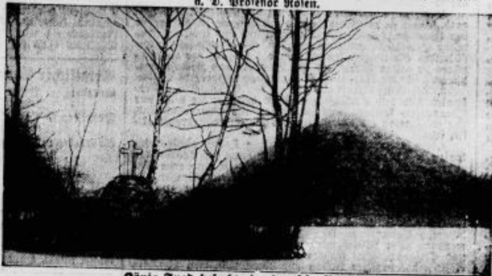
König Fuad besucht eine deutsche Pyramide. Nach Beendigung des offiziellen Programms besucht König Fuad den einstigen Besitz des Fürsten Hermann von Büdler, Mustau, Schloß Mustau in der Bauh. Fürst Büdler (1785-1871) war einer der feinsinnigsten Geister seiner Zeit, ein hervorragender Kenner ägyptischer Kultur und ein Freund des Fürsten Nebemeh III, des Vaters des Königs Fuad. Von einer Ägyptenreise brachte er eine junge arabische Skavin nach Deutschland, die im Park von Mustau begraben liegt. Dort liegt auch sein Grab in der Nähe einer Pyramide.