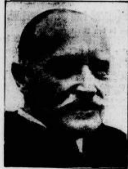
Rücktritt des britischen Botschafters in Washington?

Nach Berichten aus Washington erwartet man in dortigen Diplomatenkreisen die Abberufung des britischen Botschafters Sir Osme Howard.