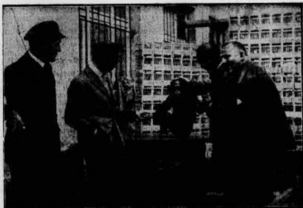
Der meistphotographierte Fahrgast des „Graf Zeppelin“ ist das Gorillawelsche „Zust“, das schon den letzten, wegen Motorschadens abgebrochenen Amerikaflug mitgemacht hat. Außer ihm sind unter den Passagieren des Luftschiffes noch mehrere Hundert aus dem Tierreich: ein weiterer Gorilla, vier Tauben und 600 Kanarienvögel (in den Bauern im Hintergrunde des Bildes).