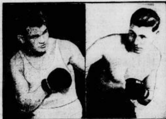
Um die Europameisterschaft. Nachdem der Kampf um die Europameisterschaft im Schwergewicht — am 31. Juli in Brüssel — infolge Disqualifikation des Italiens Panfili mit dem Siege des Titelhalters Pierre Charles (rechts) geendet hat, wird Charles am 7. September in Berlin gegen Franz Diener (links) antreten, der ihn gleichfalls um die Meisterschaft herausgefordert hat.