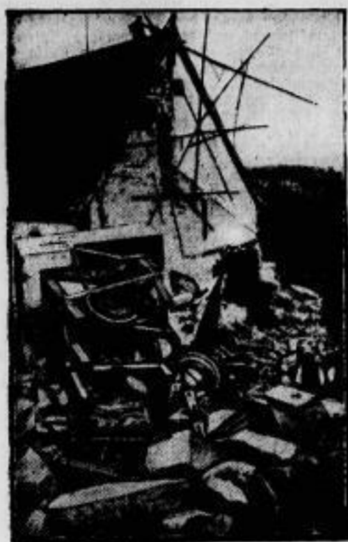
Einsturz eines Kirchturmes. In Welsenburg bei Konstanz stürzte der erst vor wenigen Jahren renovierte und erhöhte Kirchturm in sich zusammen. Glücklicherweise kamen Menschen nicht zu Schaden.