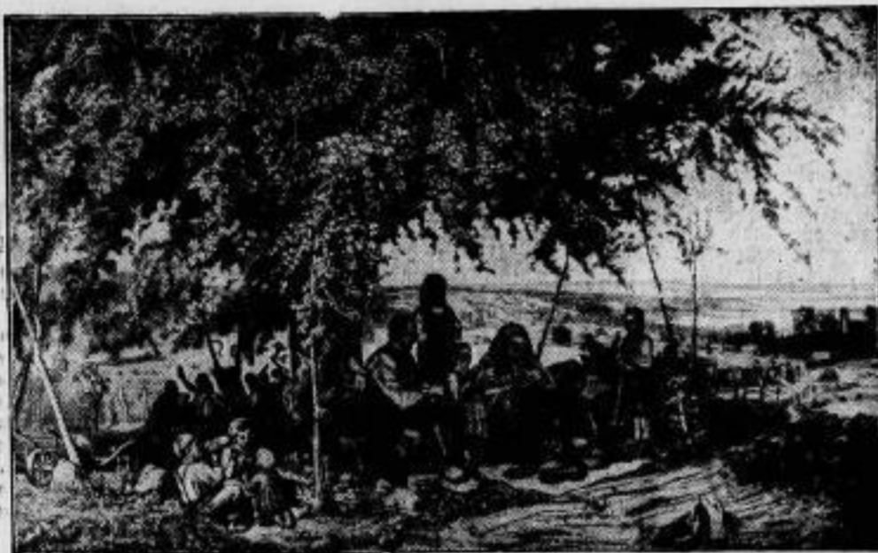
Aus dem Reiche der Kunst. „Rittagsruhe in der Ernte“, ein in der Gemäldegalerie Stuttgart befindliches Werk von Theodor Schüz.