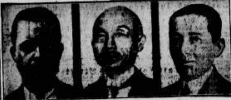
Wilson, Erster Sekretär an der amerikanischen Botschaft in Paris — Amerikanischer Vertreter bei der Konferenz. Balfour, Japans Delegierter beim Völkerbund — Führer der japanischen Konferenzdelegation. Titulescu, rumänischer Gesandter in London — rumänischer Konferenzdelegierter.