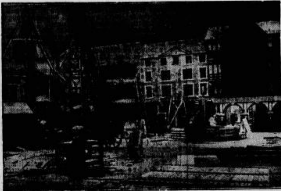
Zur Reklameschau, die in Verbindung mit dem Weltreklamekongress vom 10. August bis 8. September in Berlin stattfindet, wird zur Darstellung der Entwicklung der Zivilisation „Die alte Stadt“ (im Bilde) und „Die neue Stadt“ aufgebaut.