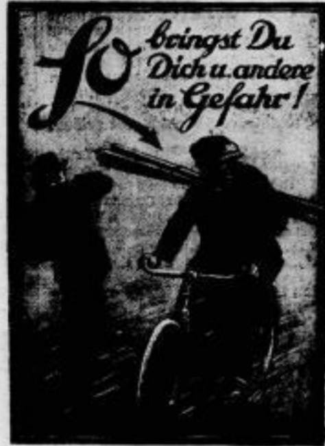
Was du nicht willst, daß man dir tu'... Um zur Vermeidung unnötiger Unfälle zu erziehen, gibt der Verband der Deutschen Berufsgenossenschaften durch seine Unfallverhütungsbild-Gesellschaft lehrreiche Bilder heraus, die jeder beherzigen sollte.