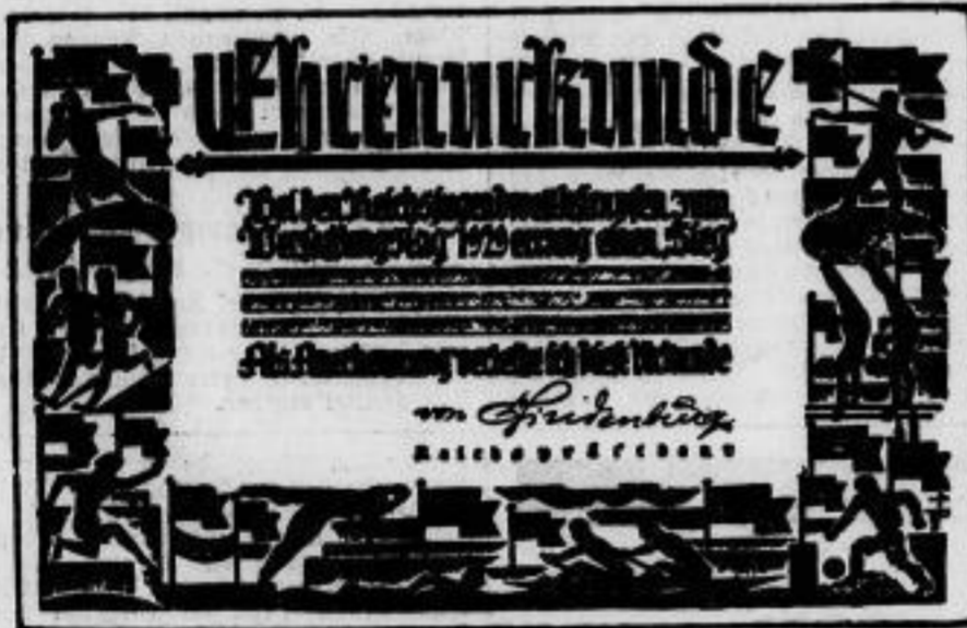
Zur Feier des zehnjährigen Verfassungstages werden Reichsjugendwettkämpfe veranstaltet, deren Preisträger eine von Hans Bape (Münster i. W.) entworfene Ehrentafel des Reichspräsidenten von Hindenburg erhalten.