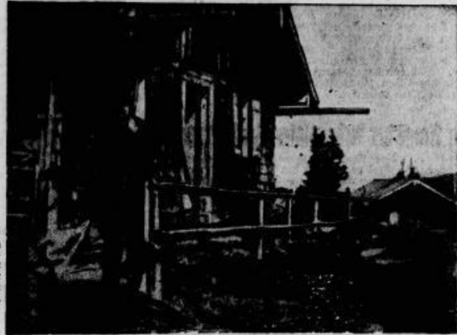
Hindenburg erholt sich. Der Reichspräsident verbringt seinen Urlaub — wie all- jährlich — in Dietramszell in den bayerischen Bergen, wo er wieder die Gamsjagd ausüben kann.