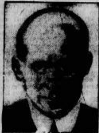
Gegen eine Rheinlandkommission sprach sich auf der Gauger Konferenz Ministerialdirektor Gaus vom Ber- liner Auswärtigen Amt in einer zweifelhafte Rede aus, in der er ausführte, daß eine solche Kommission unnötig und juristisch nicht haltbar sei.