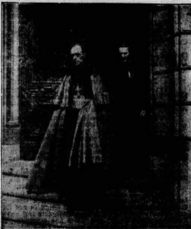
Nach dem Austausch der Ratifikationsurkunden zum Konordat verläßt der päpstliche Nuntius Pacelli das Preussische Staatsministerium, wo dieser Staatsakt am 18. August in besonders feierlicher Form vollzogen wurde.