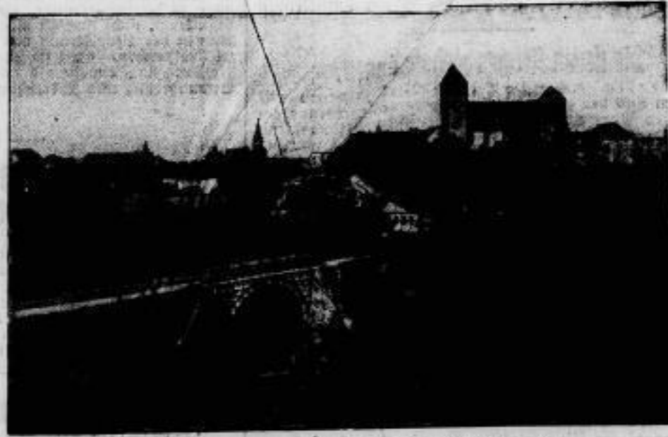
Rastenburg 600 Jahre alt. Das alte ostpreussische Städtchen, dessen Geschichte bis in die Ordnungszeit zurückgeht, begeht vom 17.—19. August die Feier seines 600jährigen Bestehens.