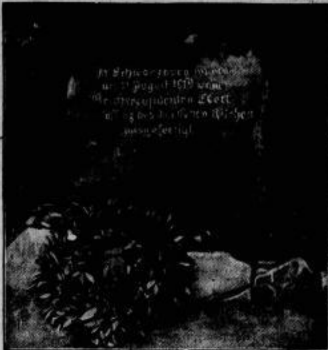
Zur Erinnerung an den 11. August 1919 wurde in Schwarzburg in Thüringen ein Verfassungs- gedenkstein errichtet, der die Inschrift trägt: „In Schwarzburg wurde am 11. August 1919 vom Reichs- präsidenten Ebert die Verfassung des Deutschen Reiches ausgefertigt.“