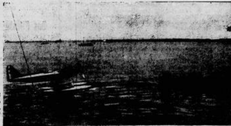
Die Vorbereitungen für den Schneider-Pokal, den großen Schnelligkeitswettbewerb für Flugzeuge, wer- den in allen Ländern mit großem Eifer getroffen. In Eng- land werden besondere Hoffnungen auf das hier geeignete Wasserflugzeug gesetzt, das jetzt seine Probeflüge bei South- hampton aufgenommen hat. Man erwartet von ihm eine Stundengeschwindigkeit von 500 Stundenkilometern.