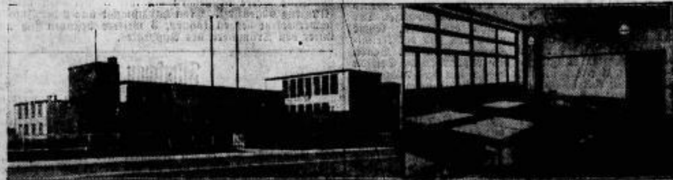
Ein vorbildlicher Schulbau ist Magdeburgs jüngster Neubau, die Volksschule in der Wilhelmstadt, die am 18. August feierlich eingeweiht wird. — Links: die Gesamtansicht des schönen Gebäudes. Rechts: einer der Klassenräume mit Einzeltischen und Stühlen statt der früheren Bänke.