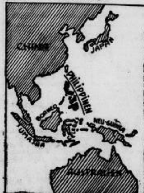
Die Philippinen bleiben amerikanisch. Im amerikanischen Senat wurde überraschend der Antrag eingebracht, die Unabhängigkeit der Philippinen zu proklamieren. Nach längerer Debatte wurde der Antrag abgelehnt.

Reliefdruck als Ersatz für Stahlstich ohne Platte und ohne Gravur. Buchdruckerei Langer & Winterlich, Riesa.