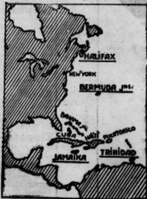
Entmilitarisierung englischer Marinestützpunkte? Aus Washington wird gemeldet, daß der englische Ministerpräsident MacDonald den Vereinigten Staaten wahrscheinlich die Entmilitarisierung der englischen Marinestützpunkte Halifax, Bermuda, Jamaica und Trinidad als Zeichen des guten Willens und der Friedensbereitschaft Englands anbieten werde.