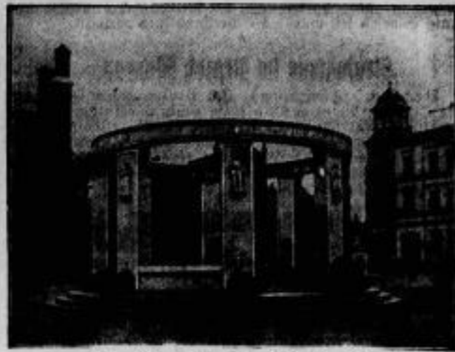
Ein Ehrenmal in Schneidemühl für die im Weltkriege gefallenen Soldaten der Provinz Grenzmark Posen-Westpreußen wurde kürzlich feierlich enthüllt.