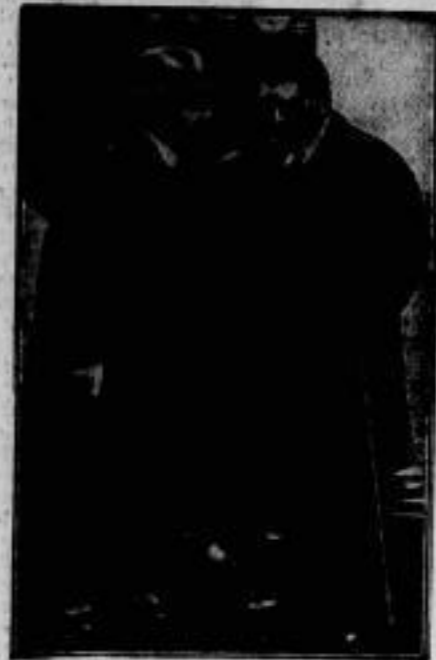
Herriot spricht in Berlin. Edouard Herriot (rechts), der ehemalige französische Ministerpräsident und jetzige Bürgermeister von Lyon, ist in Berlin eingetroffen, um auf Einladung der Pan-europäischen Union über die Organisation Europas zu sprechen. Er wurde auf dem Bahnhof von dem Berliner französischen Botschafter, de Margerie (links), empfangen.