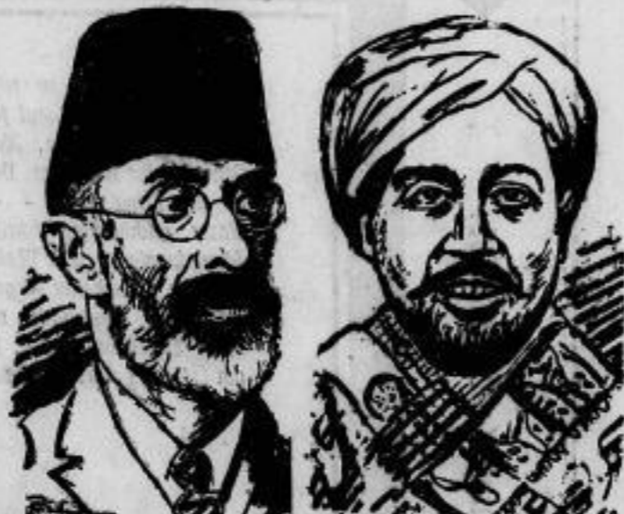
Wendung im afghanischen Bürgerkrieg. Kabul, die Hauptstadt Afghanistans, wurde am 3. Oktbr. von den Truppen des früheren Kriegsministers Habib Khan (links) besetzt. Der bisherige Gewalttäter Habibullah (rechts), der Besieger Amanullahs, flüchtete in eine Zitadelle.