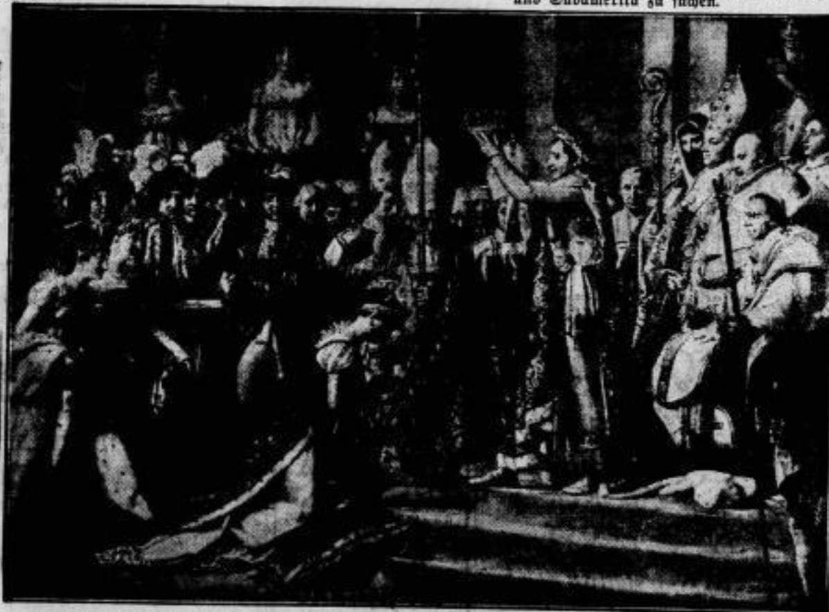
Die Krönung Napoleons I. zum Kaiser der Franzosen, die am 2. Dezember vor 125 Jahren in der Kirche Notre Dame zu Paris stattfand. Die Salbung wurde durch Paph Pius VII vollzogen, die eigentliche Krönung dagegen durch Napoleon selber, der sich und seiner Gemahlin Josephine mit eigener Hand die Krone auf das Haupt setzte. Diesen Augenblick hat die Meisterhand des Malers Louis David in dem hier gezeigten bekannten Gemälde festgehalten, das jetzt im Louvre zu Paris hängt.