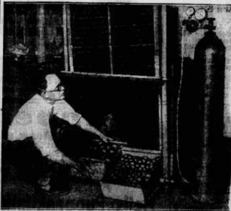
Ein Apparat zur künstlichen Reifung von Früchten wurde in Amerika erfunden. In einem Behälter werden unreife Früchte durch Ethylen gas in sehr viel kürzerer Zeit, als die Sonne dies bewirkt, zur Reife gebracht. Dieses Verfahren hat den unschätzbaren Vorteil, daß unreifes Obst während des Verlandes über weite Entfernungen künstlich zur Reife gebracht werden kann, so daß es am Bestimmungsort frisch gereift eintrifft.