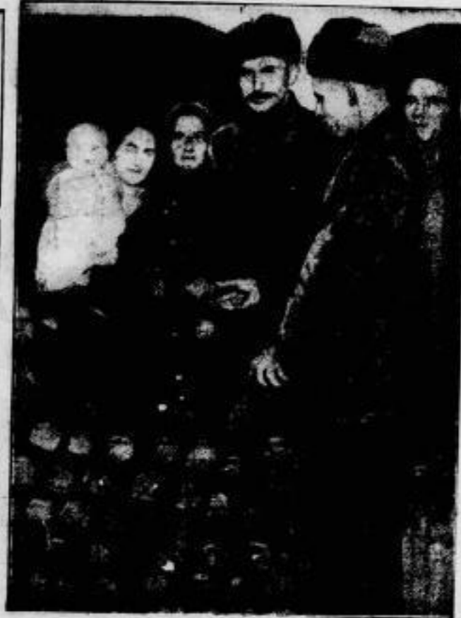
Das erste deutsche Boot für die deutsch-russischen Vannerstättlinge, die während des Winters in Deutschland Zuflucht finden, um im Frühjahr eine neue Heimat in Kamaha und Südamerika zu suchen.