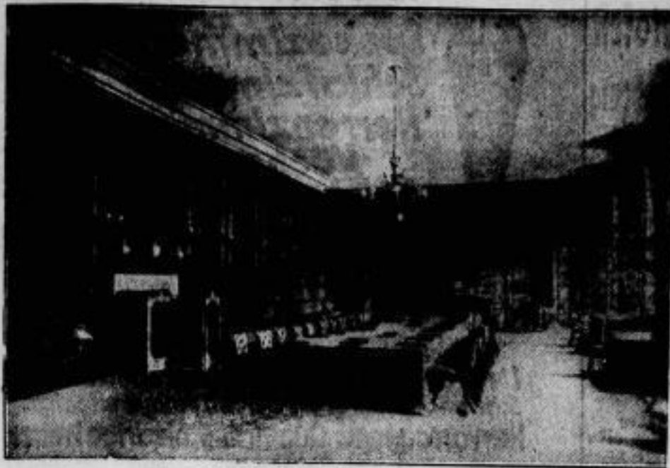
Der Schauplatz der Londoner Flottenkonferenz, die im Januar von England, den Vereinigten Staaten, Japan, Frankreich und Italien zum Zwecke der Einschränkung der Flottenrüstungen abgehalten wird, soll der vom König von England zur Verfügung gestellte Sitzungssaal des St.-James-Palastes sein.