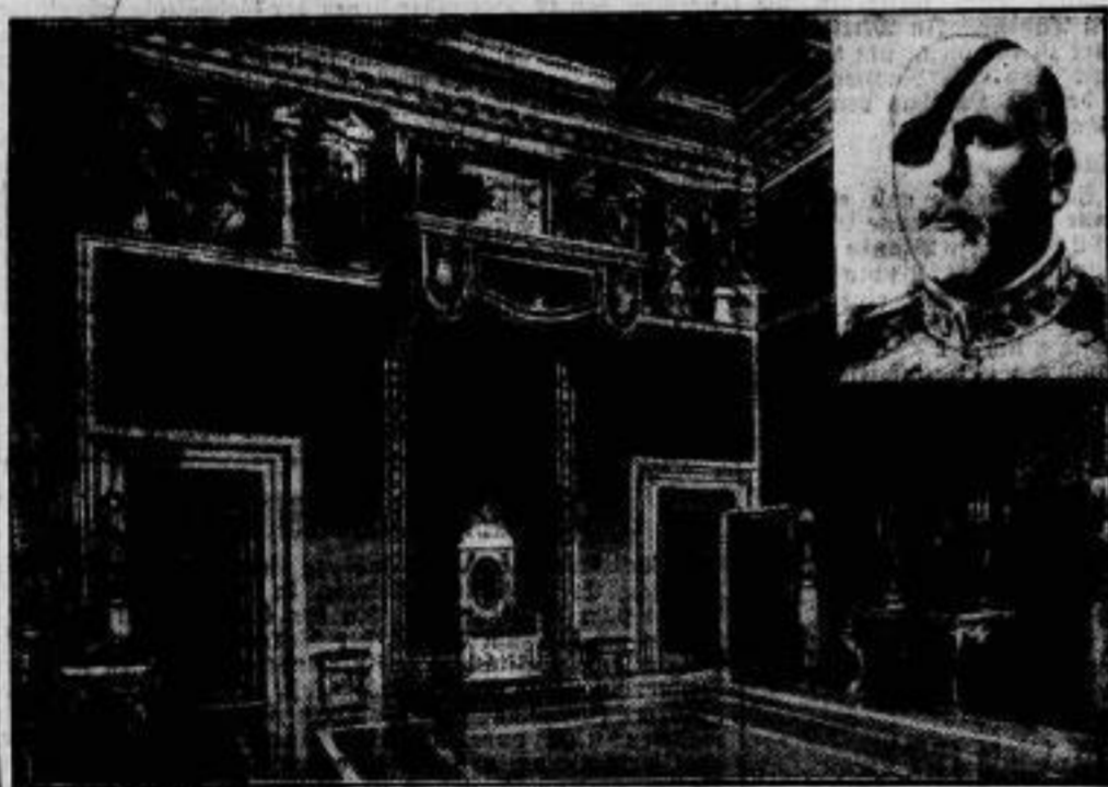
Hier verabschiedeten sich König und Papst.