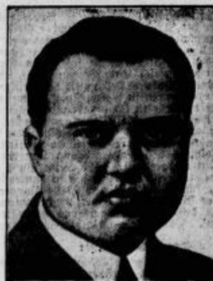
Mörder zum Zweck des Versicherungsbetruges.

Vom Bau der größten deutschen Seeschleuse, der Nordschleuse in Bremerhaven, die auch den größten Passagierdampfern — namentlich den neuen Lloyd-Dampfern „Bremen“ und „Europa“ — das Einlaufen in die Binnenhäfen Bremerhavens ermöglichen soll. Die Vollendung des Riesenwerkes ist für 1923 veranschlagt. Jetzt fertiggestellt ist die hier gezeigte Torkammer des Außenhauptes, in der der Schlebsponton für den Abstieg der Schleusenkammern sich bewegen wird.