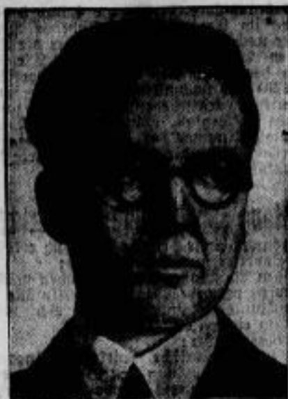
Der Träger des diesjährigen Goncourt-Preises, des bedeutendsten französischen Literaturpreises, ist der junge französische Romanschriftsteller Marcel Aymon.