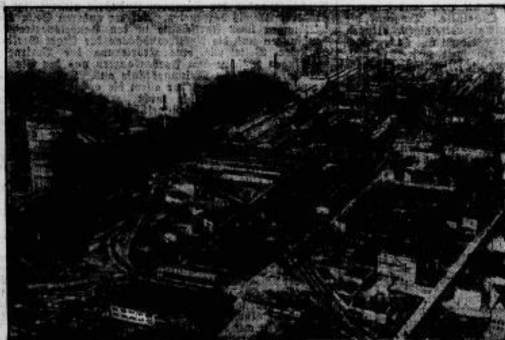
Der Schauplatz einer folgenschweren Explosion

wurde in Lübeck der größte Bagger der Welt. Auf zwei Pontons ruhend, ragt er 34 Meter empor. Seine 47 Fimer von je 500 Litern Inhalt können in der Stunde 450 Kubikmeter Boden fördern. Der Bagger, der 2 1/2 Millionen Mark gekostet hat, wird an die Hafenverwaltung von Rouen geliefert.