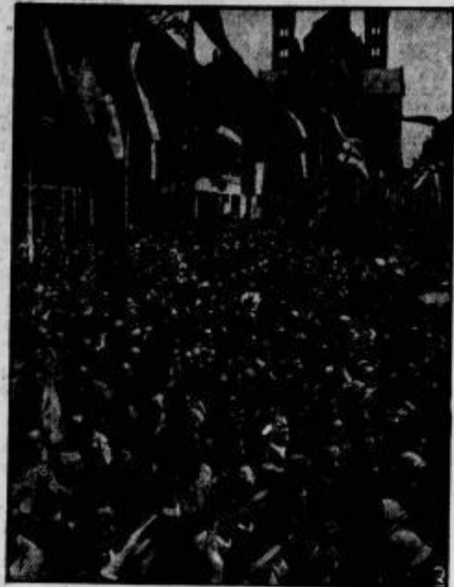
Der Jubel der Bevölkerung, die den Reichspräsidenten begeistert begrüßt, kannte keine Grenzen.