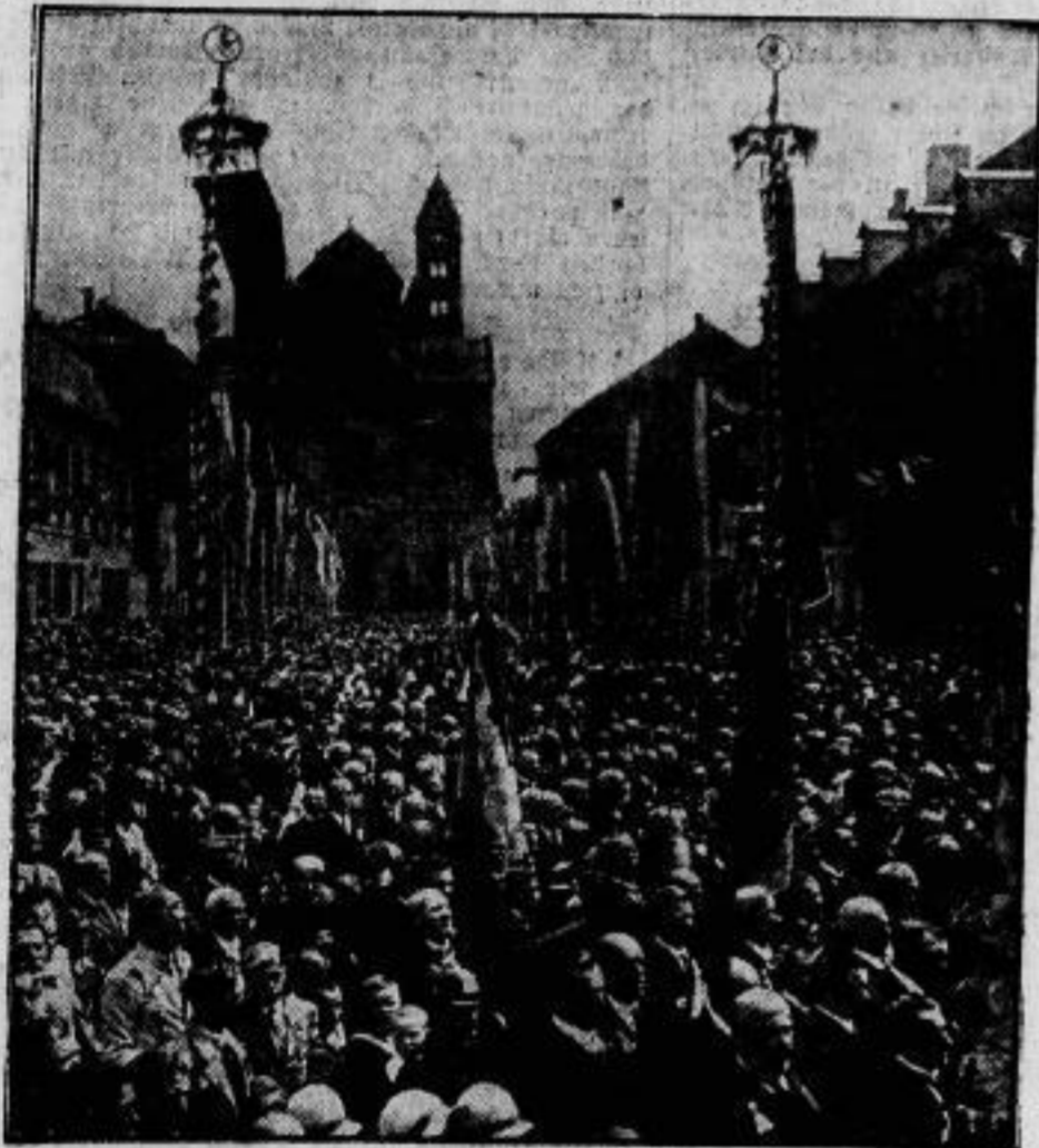
Die festlich bewegte Menge in der reich geschmückten Hauptstraße Speyers.