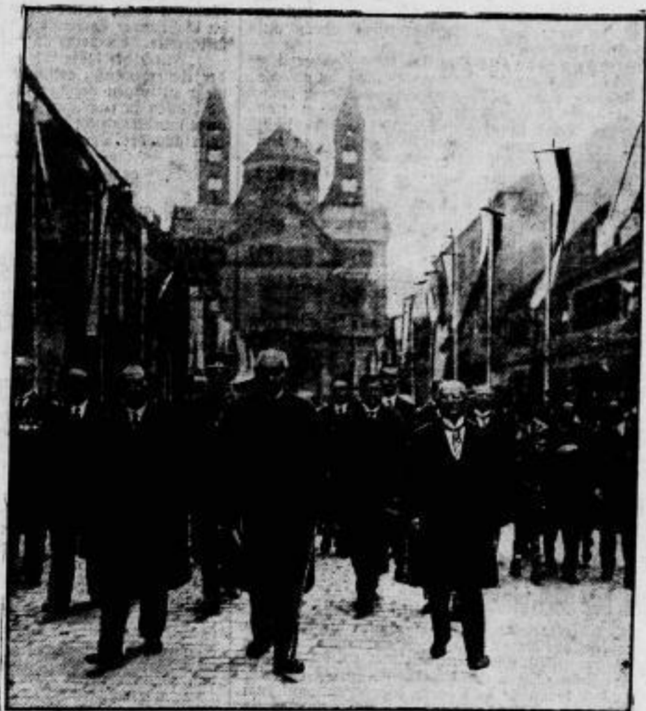
Nach dem Domgang in Speyer. Neben dem Reichspräsidenten Dr. Curtius und Dr. Held.