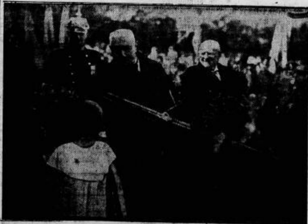
Ein Blumenstrauß aus Kinderhand für den Reichspräsidenten. Neben ihm der bayerische Ministerpräsident Dr. Held.