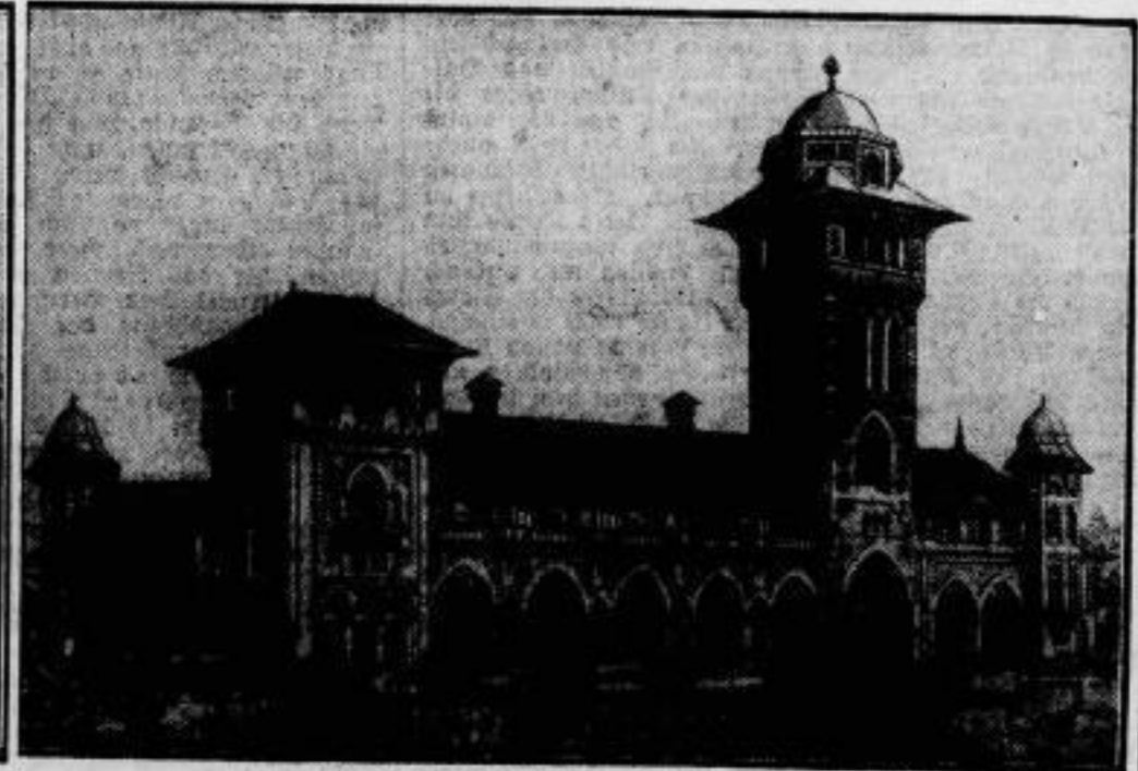
Semal Paschas künftiger Palast, der gegenwärtig in Yeniseher (Neu-Angora) für den Diktator-Präsidenten der türkischen Republik gebaut wird.