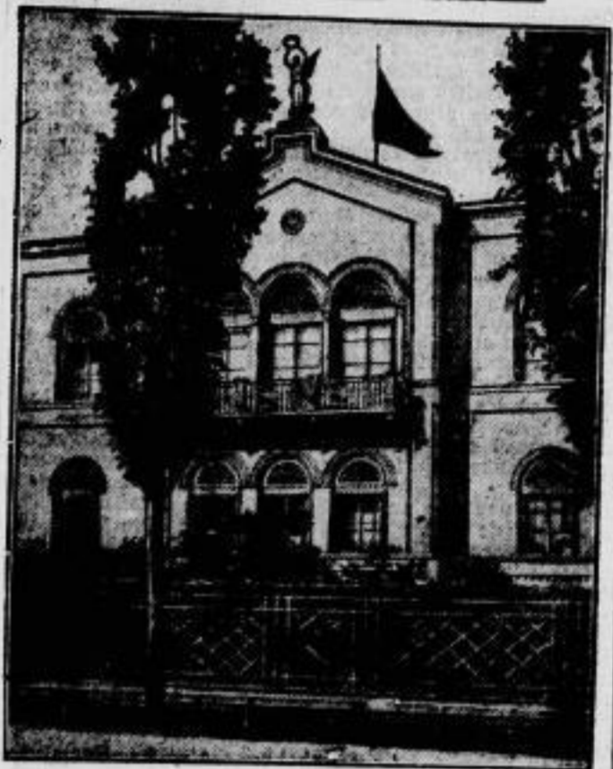
Bild links. Die erste Eisenbetonkirche Deutschlands ist die Petri-Nikolai-Kirche in Dortmund, die — nach den Entwürfen der Dortmunder Architekten Pinno und Grund geschaffen — kürzlich vollendet wurde und am 12. Oktober eingeweiht werden soll. Bild rechts. Das Sterbehaus des Prinzen Leopold von Bayern, des Eroberers von Warschau, der vor wenigen Tagen im Alter von 84 Jahren in seinem Münchener Palais verschied und dort bis zu seiner Beisetzung aufgebahrt wurde.

Oberer Reihe von links nach rechts. Siegfried Dux , der bekannte ostpreussische Schriftsteller, wird am 5. Oktober 60 Jahre alt. Der neue Vorsitzende der Reichstagsfraktion des Deutschen Landvolks — dies ist der abgeforderte Name der Christlich-Nationalen Bauern- und Landvolkpartei — ist der Abgeordnete Döbrich-Thüringen. Braunschweigs neuer Innenminister ist der nationalsozialistische Amtsgerichtsrat Franz Kiel, dem bei der am 1. Oktober vorgenommenen braunschweigischen Regierungswahl das Innen- und das Kultusministerium übertragen wurden. Er möchte wieder König sein. Der frühere König Georg von Griechenland hat plötzlich seine Ansprüche auf den Thron geltend gemacht und seiner Ueberzeugung Ausdruck gegeben, daß das griechische Volk ihn früher oder später zurückrufen werde.