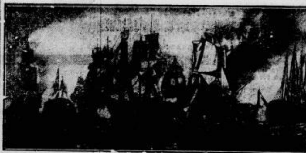
Zum 125. Jahrestage der Seeschlacht bei Trafalgar, in der am 21. Oktober 1805 die englische Flotte unter Nelson die vereinigte französisch-spanische Flotte vernichtend schlug. Dieser Sieg, den England mit dem Tode seines größten Seehelden — Lord Nelson — bezahlen mußte, begründete Englands Vorherrschaft zur See während des 19. Jahrhunderts.

(Nach einem Gemälde des Engländers Clarkson Stanfield)