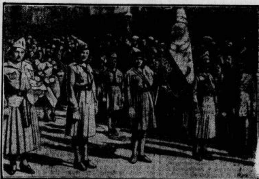
Das „Fest der Masse“ in Madrid, das unter Teilnahme der ganzen Bevölkerung, der Regierung und des diplomatischen Korps dieser Tage gefeiert wurde, sah in seinem Aufzuge auch junge Mädchen als „Regionäre“, die ihre Fahne mit großer Würde trugen.

(Nach einem Gemälde des Engländers Clarkson Stanfield)