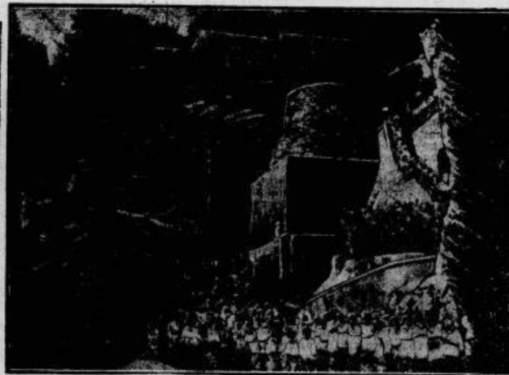
Die 2000-Jahrfeier zu Ehren Vergils, dessen 2000. Geburtstag jetzt in ganz Italien begangen wird, begann mit einer Feier an dem bei Neapel gelegenen Grab dieses größten altrömischen Dichters.