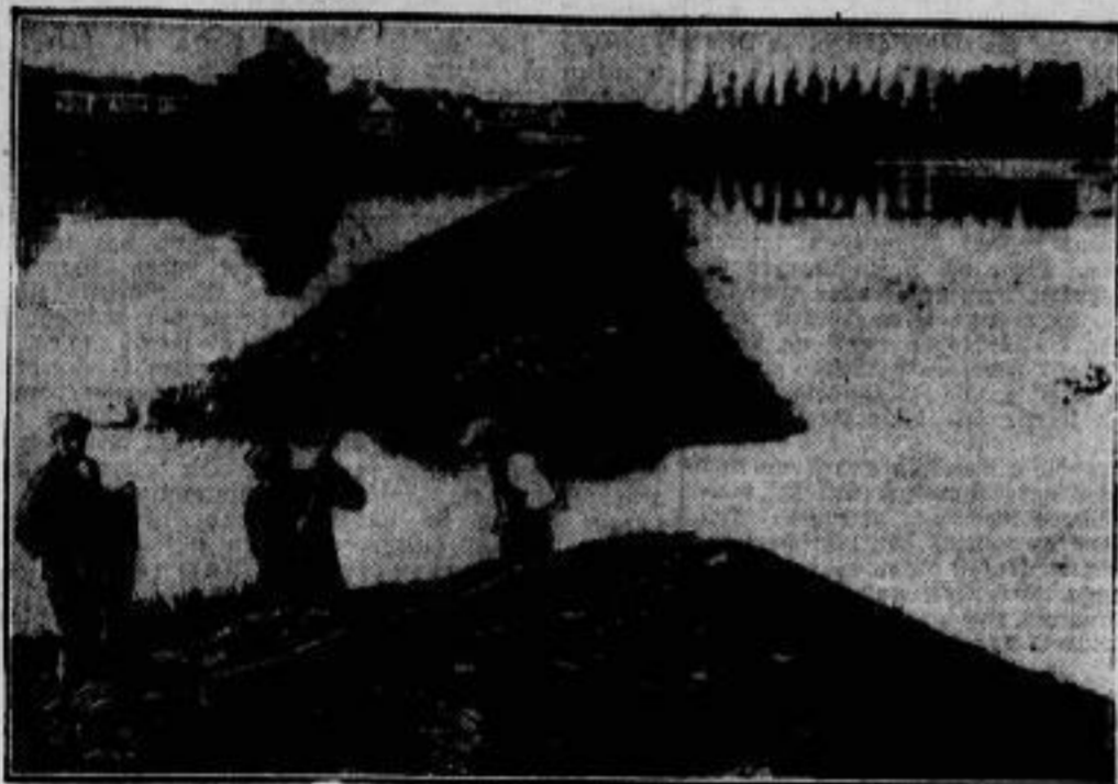
Ein Dammbrech bei dem Hochwasser in Belgien, das durch die anhaltenden Regengüsse der letzten Zeit hervorgerufen wurde, setzte bei Pierre in der Provinz Antwerpen große Landstriche unter Wasser und richtete außerordentlichen Schaden an.