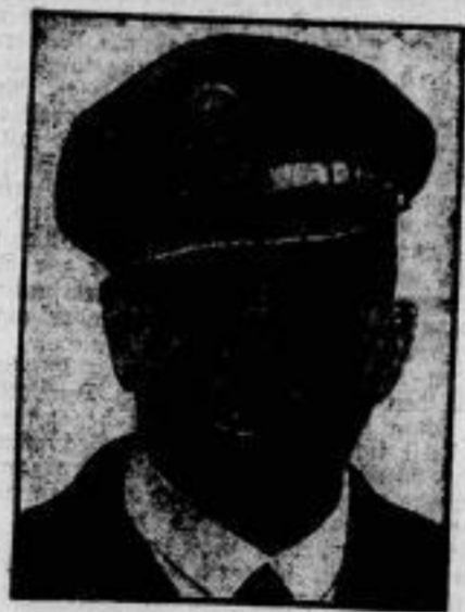
Graf Ludner erkrankte ernstlich. Graf Felix Ludner — im Weltkrieg der Kommandant des durch seine rühmlichen Fahrten bekannten Hilfskreuzers „Secadler“ — hat bei einem Autounfall in den Vereinigten Staaten Schädel-, Brust- und Rippenverletzungen erlitten.