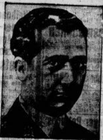
Der Hauptführer der Revolte war der Ozeanflieger Major Franco, der — vor kurzem aus dem Militärgefängnis entlassen — die Besatzung des Madrider Flugplatzes Cuatro Vientos zur Revolution aufgewiegelt hatte und nach dem Scheitern der Bewegung im Flugzeug nach Portugal flüchtete.