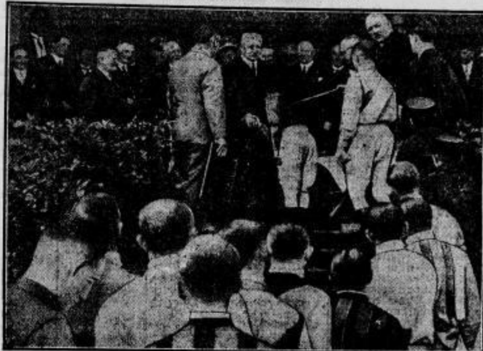
Hindenburg-Tag in Hoppegarten.

Auch in diesem Jahre ließ der Reichspräsident es sich nicht nehmen, dem nach ihm benannten Rennen auf der Berlin-Hoppegartener Rennbahn beizuwohnen. Nach dem Rennen überreichte Hindenburg dem Sieger den Ehrenpreis und empfing alle Jockeys, die am Rennen teilgenommen hatten.