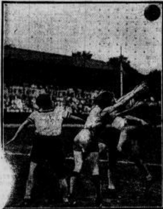
Die Deutsche Damen-Handballmeisterschaft. Im letzten Mal-Countdown in Magdeburg ausgetragen, endete mit dem Siege von Sportklub Charlottenburg (Schwarze Hölse) über Viktoria-Hamburg.