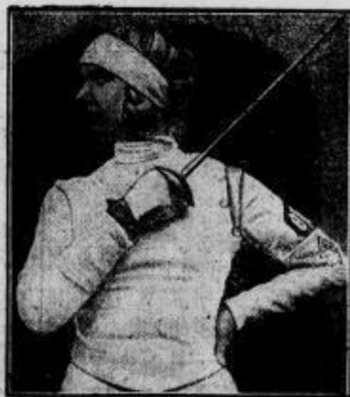
Europameisterin Helene Mayer. Bei den Europameisterschaften im Rechten wurde Helene Mayer-Frankfurt a. M., die Olympiasiegerin von 1928, Europameisterin. Sie hat damit zum zweiten Male diesen Titel an sich gerissen.