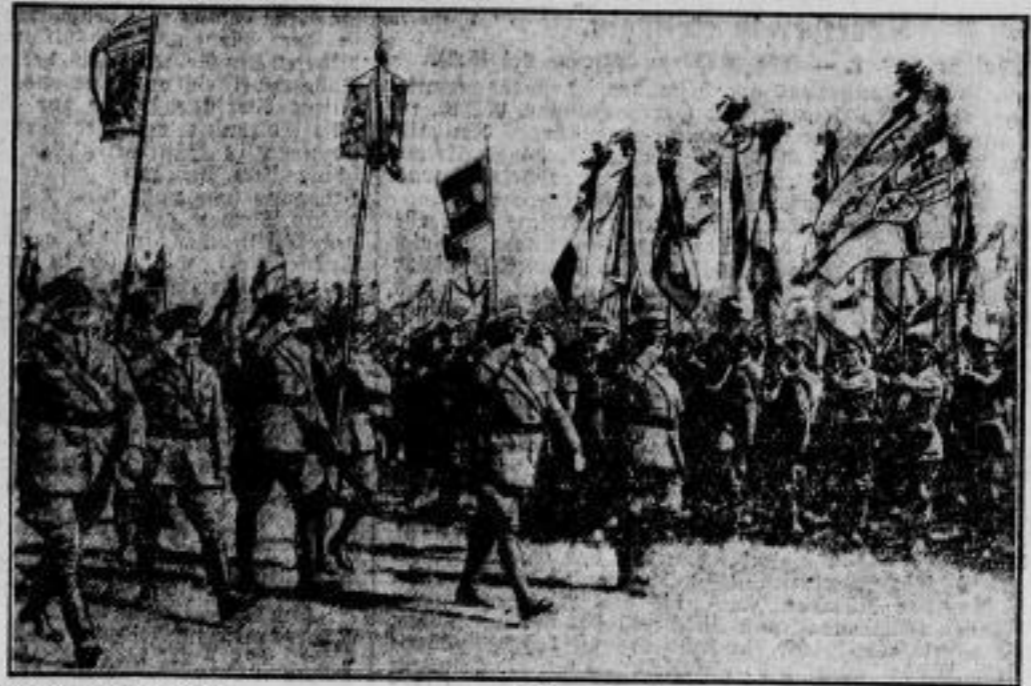
Vom 12. Reichsfrontsoldatentag in Breslau.