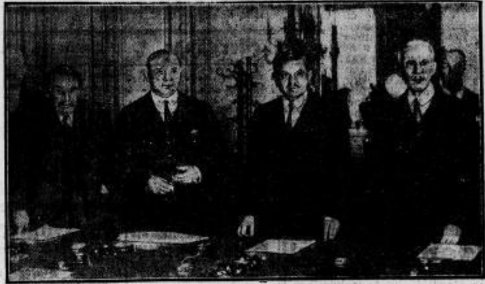
Der Kampf um den Zahlungsausschub. Der amerikanische Finanzminister Mellon in der Konferenz mit den französischen Politikern. Von links: Briand — der amerikanische Botschafter in Paris Edge — Ministerpräsident Cavalet — Finanzminister Mellon.

Bild rechts. Neuer Bergsteiger-Rekord. Mitgliedern der unter Führung des Engländer's Emthel stehenden Himalaja-Expedition ist es als ersten gelungen, den 8000 Meter hohen Gipfel des Mount Kamet zu besteigen und damit alle bisherigen Bergsteiger-Rekorde zu überbieten. Bisher waren neun vergebliche Versuche gemacht worden, diese Spitze zu bezwingen.