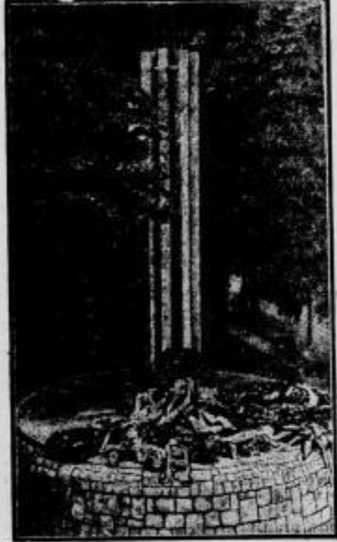
Studentenehrenmal in Kiel. In Kiel wurde ein von dem Düsseldorfer Architekten Runger — dem Schöpfer des Marine-Ehrenmals in Laboe — geschaffenes Ehrenmal zur Erinnerung an die 500 im Weltkrieg gefallenen Dozenten und Studenten der Kieler Christian-Albrechts-Universität feierlich eingeweiht.