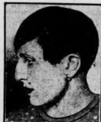
Neubekanntung in die Akademie der Künste.

Die Architekten Erich Mendelsohn (links) und Wies van der Rohe (Mitte) sowie die Bildhauerin Renée Sintenis (rechts), die mit einer Reihe anderer Bildender Künstler zu Mitgliedern der Preussischen Akademie der Künste ernannt wurden.