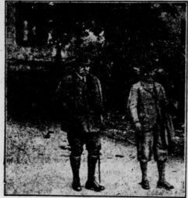
Hindenburg in Dietramsdorf.