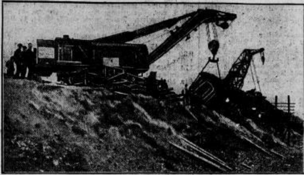
Die Wagen gehoben.

Wie unsere Aufnahme zeigt, hat man die schweren Wagen durch riesige Krananlagen gehoben und abtransportiert.