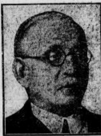
Kapitän zur See Götting, bisher Leiter der Wehrmachtsteilung im Reichswehrministerium, ist zum Kommandanten des Flottenflaggschiffes „Schleswig-Holstein“ ernannt worden.