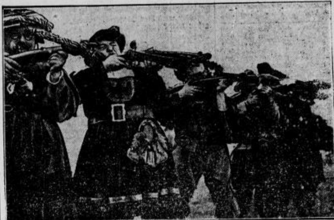
Das traditionelle Oktoberfest. Auf der Theresienwiese in München hat das berühmte Oktoberfest begonnen. Unter den historischen Festgruppen boten bei der Eröffnung die Armbrustschützen ein malerisches Bild.