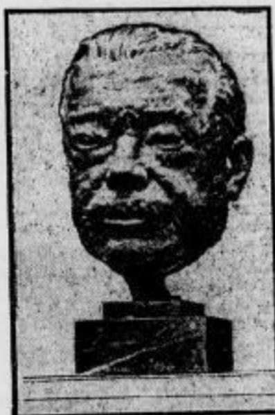
James-Simon-Büste im Deutschen Museum. Anlässlich des 80. Geburtstages von Dr. James Simon ist im Deutschen Museum in München eine Büste des Jubilars aufgestellt worden. James Simon hat den Staatlichen Museen unzählige Schenkungen gemacht, von denen die bekannteste der Kopf der Königin Kofredekete ist.