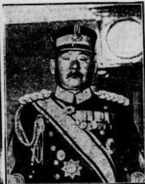
Der Kampf um die Mandschurei. Der japanisch-chinesische Konflikt verschärft sich weiter. Der Oberbefehlshaber der japanischen Streitkräfte in der Mandschurei, General Minami (rechts), hat Verstärkungen angefordert, der sowjetrussische Kriegsminister Woroschilow (links) soll nach dem Fernen Osten fahren, nachdem die Sowjetregierung erklärt hat, sie könne den Vorgängen im Osten nicht unbeteiligt gegenübersehen.