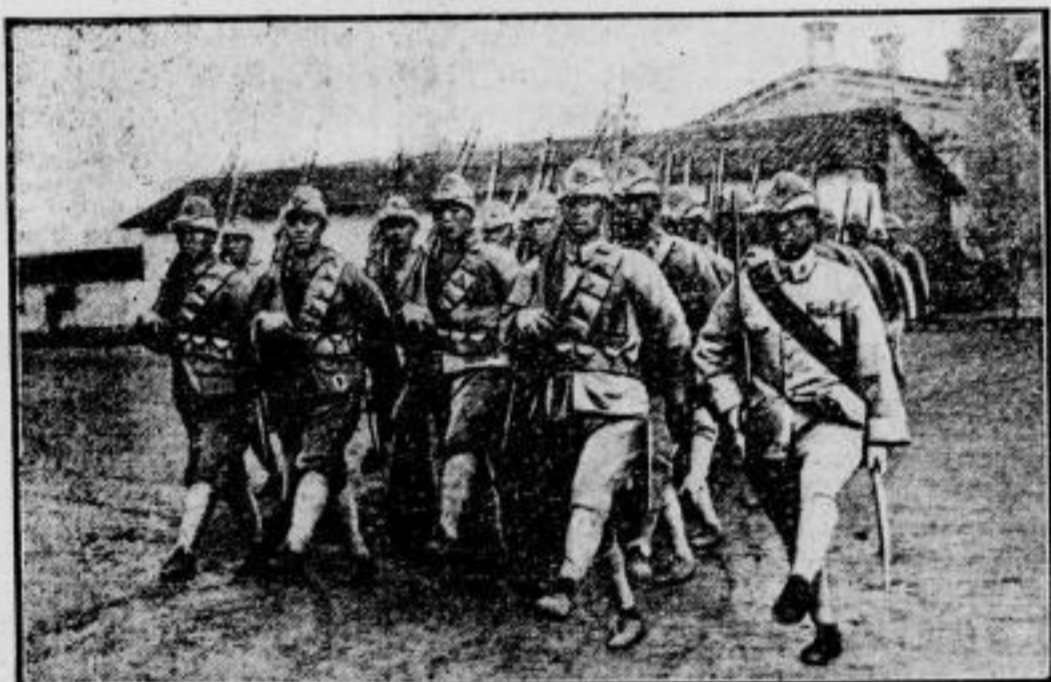
Zu den Kämpfen im Fernen Osten. Truppen der Chinesischen Nordarmee, die mit den Japanern im Kampf steht, beim Exerzieren.