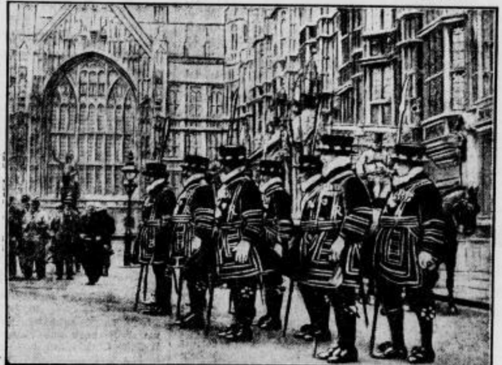
England — das Land der Tradition. Immer wieder ist der Fremde erstaunt über die alten Bräuche, die England bewahrt pflegt. So auch am Tage der Parlamentsöffnung: die Kapitäne der Garde treten auf dem Hof des Unterhauses in ihren historischen Uniformen an und durchsuchen die Keller des Gebäudes nach Sprengstoffen. Dieser Brauch wurde eingeführt und ist bis jetzt auch immer eingehalten worden, nachdem im Jahre 1804 das Parlament durch Pulver in die Luft gesprengt werden sollte — ein Anschlag, der in letzter Minute verraten wurde.