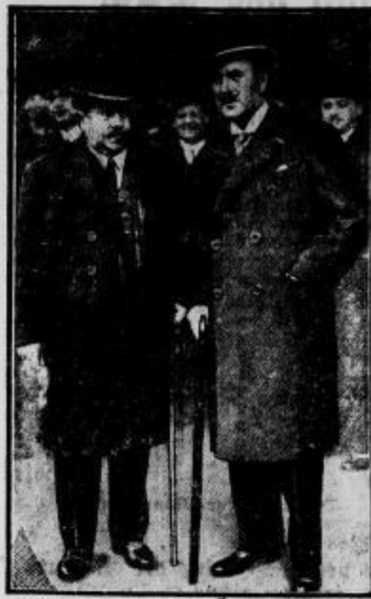
Minister Painlevé besucht Deutschland. Der frühere französische Ministerpräsident Painlevé (links) traf zu einem mehrtägigen Besuch Deutschlands in der Reichshauptstadt ein, wo er von dem französischen Botschafter in Berlin, Francois Poncet (rechts) begrüßt wurde.