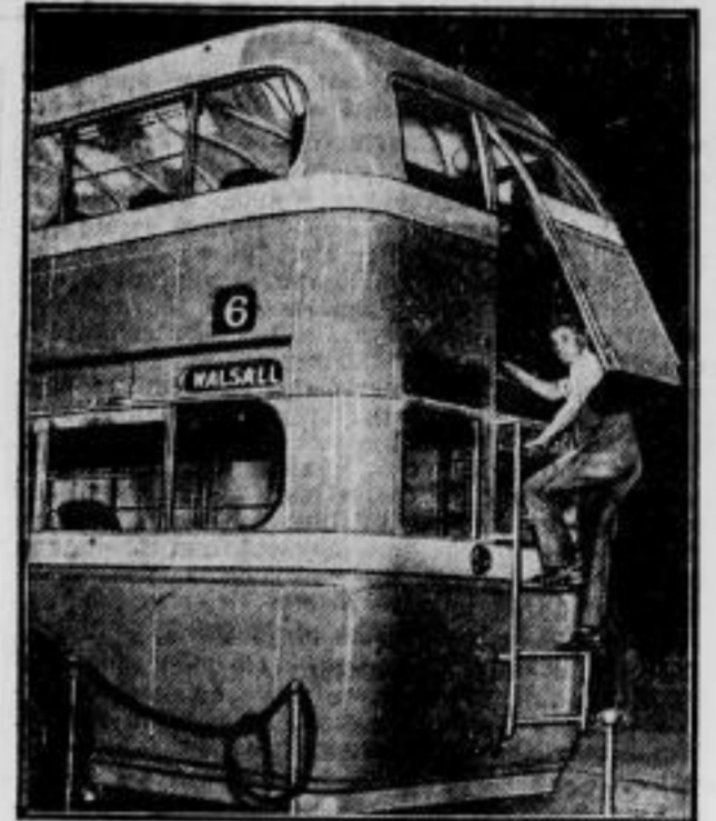
„Ausgang nur bei Gefahr!“ Auf der großen Motorshow in London wird gegenwärtig dieser Autobus mit Notausgang gezeigt, der es den Fahrgästen des „Oberstocks“ ermöglicht, in Fällen dringender Gefahr den Wagen sofort zu verlassen. Eine seltene Ausnahme von den englischen