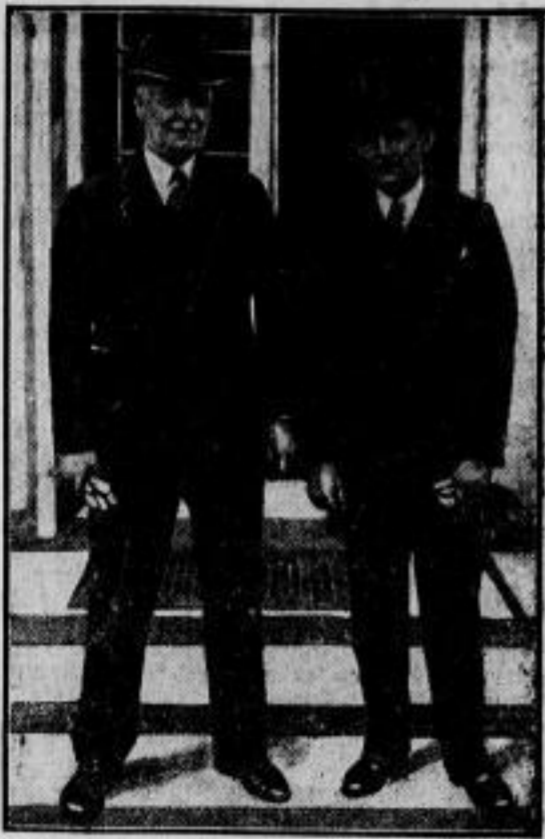
Gehelmrat Cuno nach seinem Besuch bei Hoover. Dr. Cuno (links), der Generaldirektor der Dapag, weist gegenwärtig in Amerika. Er hatte auch eine Aussprache mit dem Präsidenten der Vereinigten Staaten, Hoover, der auch der deutsche Botschafter in Washington, von Prittway-Gassron (rechts), betwohnte.