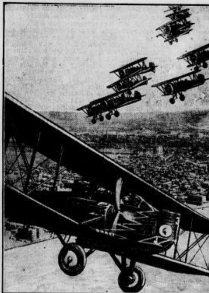
Luftkampf über Newyork. Bei den Manövern der amerikanischen Luftflotte wurde diese wundervolle Aufnahme gemacht: ein „feindliches“ Bombenflugzeug (im Vordergrund) hat einen Teil der Stadt Newyork mit Bomben belegt und wird nun von einem Abwehrgeschwader verfolgt.