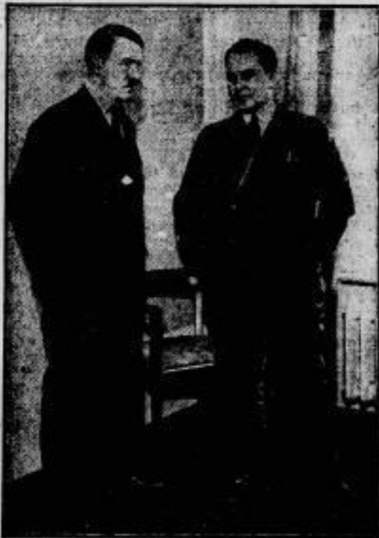
Adolf Hitler und Hauptmann Goring in ihrem Zimmer im Hotel Kaiserhof, wo die Führer der ausländischen Presse empfangen wurden, um über die Einstellung der Nationalsozialisten zum Ausland informiert zu werden.