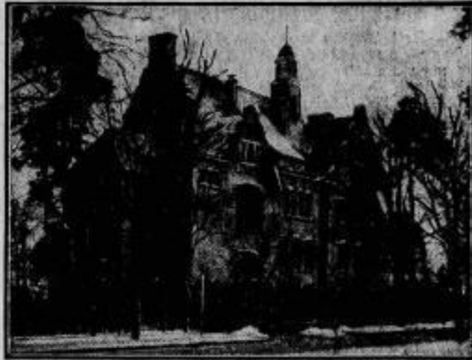
Jubiläum der Preussischen Landes-Fischerei-Anstalt. Die Preussische Landesanstalt für Fischerei, der die wissenschaftliche Untersuchung der deutschen Fischerei und die biologische Erforschung der Fische und ihrer Lebensbedingungen zum Nutzen der Fischerei obliegt, kann in diesen Tagen ihr 25-jähriges Bestehen feiern.