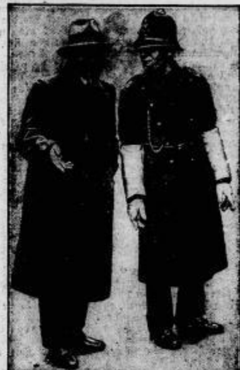
Rosenbergs in London. Der Reichstagsabgeordnete Rosenbergs im Gespräch mit einem „Bobbs“ während seines Londoner Aufenthaltes, wohin er von Hitler geschickt wurde.