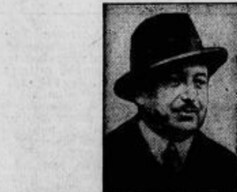
Zum Vorsitzenden der Baseler Reparationskonferenz wurde der italienische Abgeordnete Professor Alberto Beneduce gewählt.