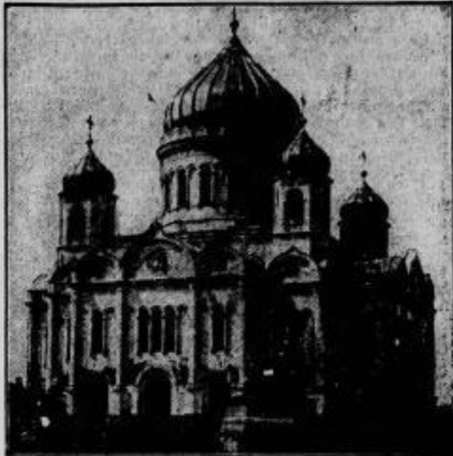
Die Erlöserkirche in Moskau in die Luft gesprengt. Die Erlöserkirche in Moskau, die zu den schönsten Baudenkmälern der Welt zählt und deren fünf Kuppeln zu den charakteristischsten Wahrzeichen der Stadt gehörten, ist mit sechs Dynamitladungen in die Luft gesprengt worden. An ihrer Stelle soll nun der „Palast der Sowjets“ errichtet werden.