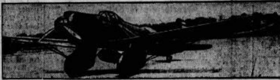
Material für die Weltabklärungskonferenz! In Amerika hat man ein neues Kampfflugzeug gebaut, speziell als Angriffsmaschine gegen einzelne Truppenkörper. Die Maschine erreicht eine Durchschnittsgeschwindigkeit von 800 Stundenkilometern und ist mit sechs Maschinengewehren und verschiedenen Bomben bewaffnet.