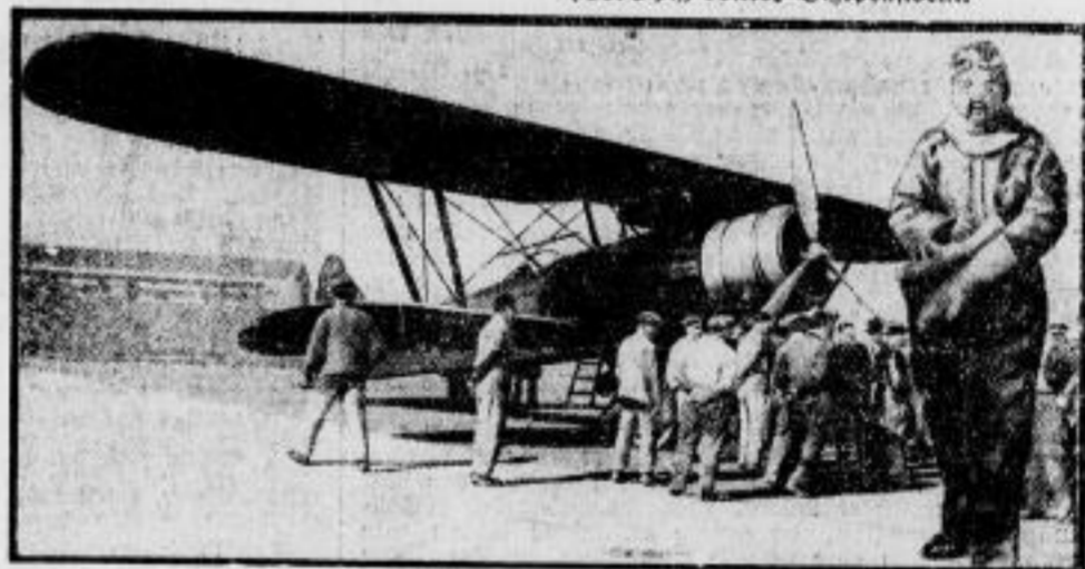
Neuer Höhenweltrekord für Flugzeuge. Der französische Piloter Lemoine (im Vordergrund) stellte jetzt mit der hier abgebildeten Maschine einen neuen Höhenweltrekord von 12.800 Metern auf.