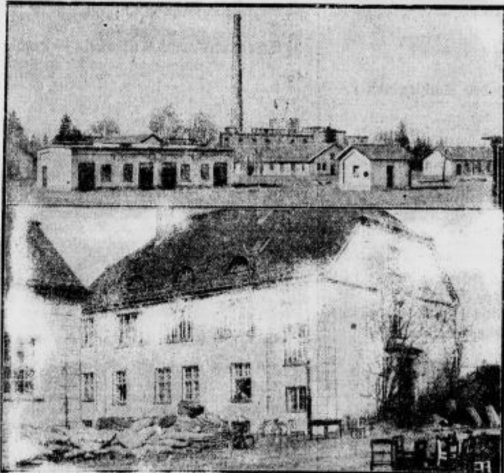
Die ersten Bilder aus dem Konzentrationslager Dachau. Wir zeigen hier die ersten Aufnahmen von dem ersten Konzentrationslager auf dem Gelände der ehemaligen Pulver- und Munitionsfabrik in Dachau bei München. In diesem Lager, das ein Fassungsvermögen für 5000 Personen besitzt, sollen Kommunisten- und Reichsbannerführer sowie