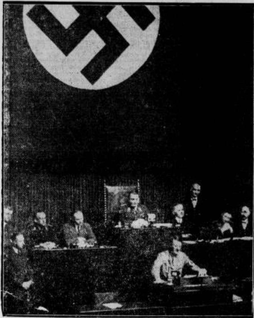
Reichskanzler Adolf Hitler vor dem Deutschen Reichstag. Unser Bild zeigt Reichskanzler Adolf Hitler während seiner Regierungserklärung vor dem Deutschen Reichstag.