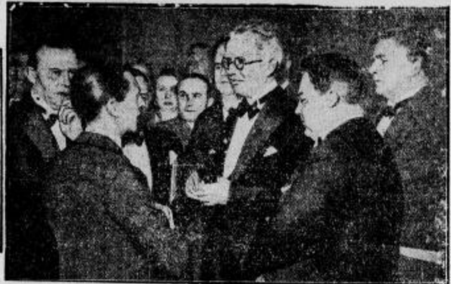
Landtagspräsident Kerkel — kommissarischer Justizminister. Der Präsident des Preussischen Landtages, Kerkel, ist zum Reichskommissar für das preussische Justizministerium ernannt worden.