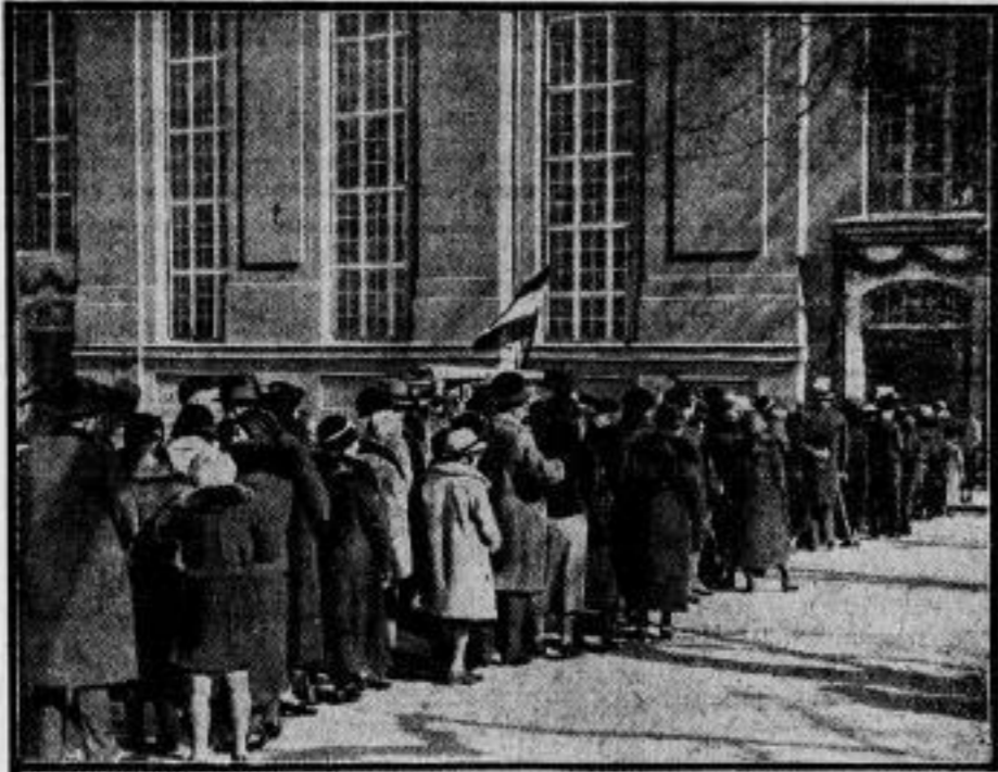
Die Potsdamer Garnisonkirche — das Ziel von Tausenden.