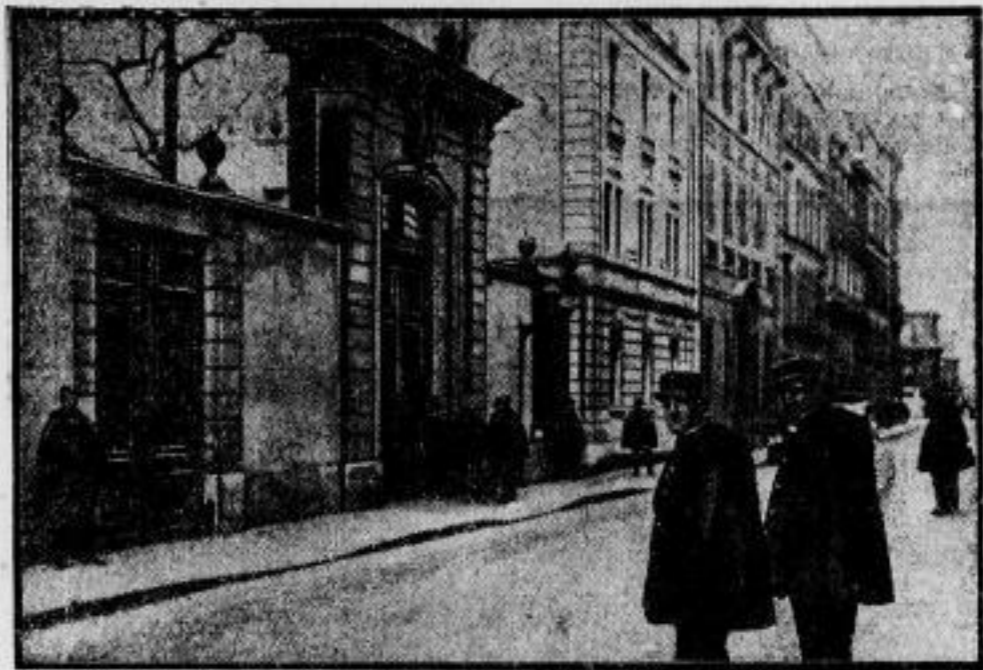
Polizeikolon für die deutsche Botschaft in Paris.

öffnung des Reichstages der nationalen Erhebung am demütigen 21. März ansehen wollen. Wie man aus unserer Aufnahme erieht, trägt die Kirche noch den Schmuck vom Festtag.