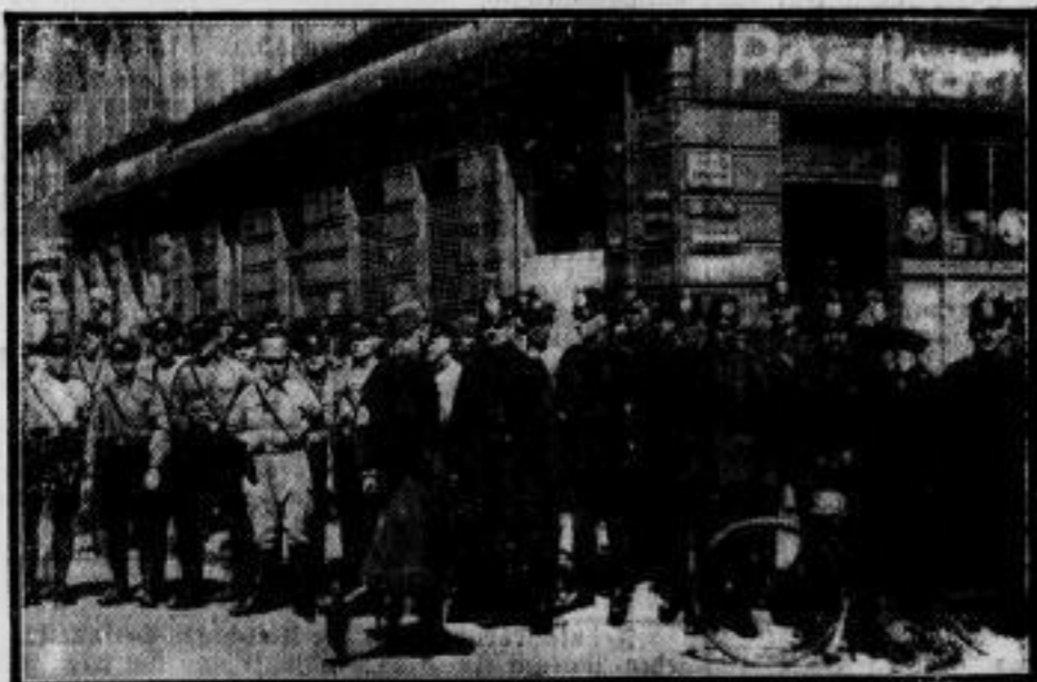
Erfolgreiche Kommunistenrazzia im Hamburger Gängeviertel. Unser Bild berichtet von der überraschenden Durchsuchung des berühmtesten Hamburger Gängeviertels durch Polizei und SA-Hilfspolizei, bei der zahlreiches verbotenes Material und Waffen beschlagnahmt wurden.