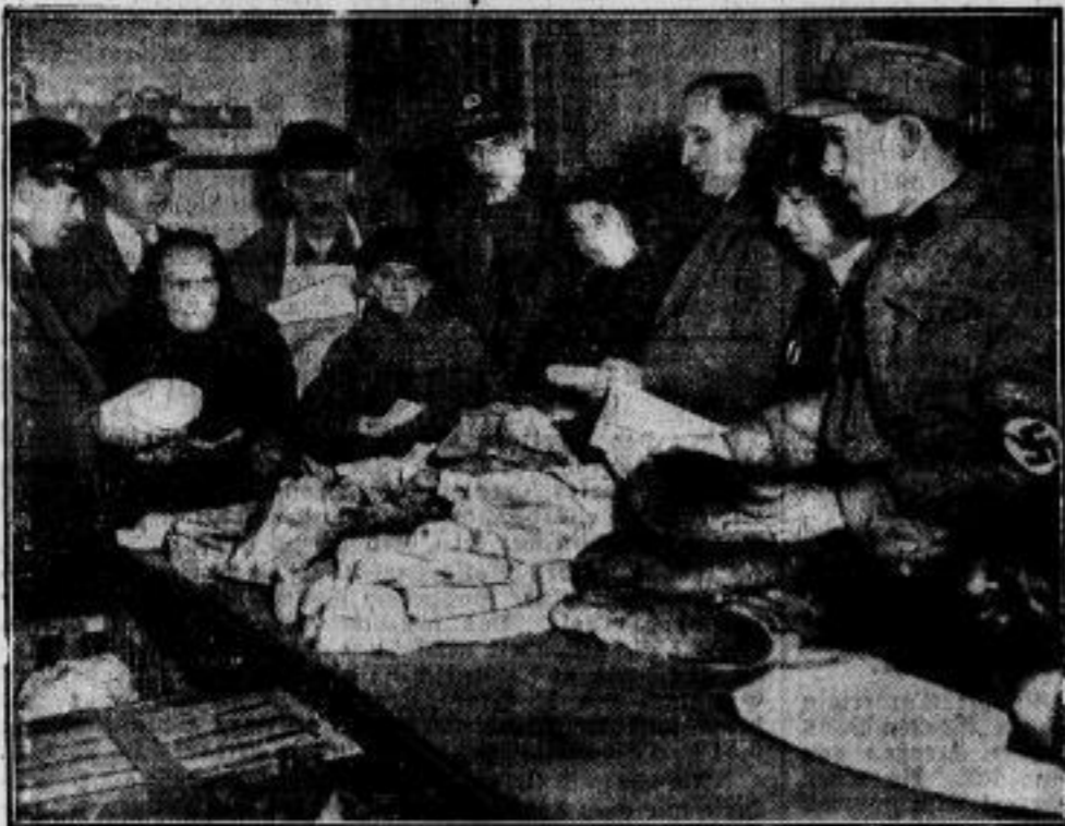
Die Hitler-Geburtsstagsspende wird verteilt. Anlässlich des Geburtstages des Reichskanzlers Adolf Hitler wurde durch Sammlungen eine Hitler-Geburtsstagsspende ins Leben gerufen, die eine Verteilung von Lebensmitteln an alle Unterstützungsempfänger ohne Rücksicht auf deren politische und konfessionelle Einstellung vorsieht. Unsere Aufnahme zeigt die Verteilung der Zuweisungsscheine an die bedürftigen Volksgenossen, die am Geburtstag des Reichskanzlers alle ihre Sorgen vergessen und an einem gedeckten Tisch sitzen sollen.

Der neue Führer des Deutschen Beamtenbundes. Der Leiter der Beamtenabteilung der NSDAP, Sprenger, hat die Führung des Deutschen Beamtenbundes übernommen.