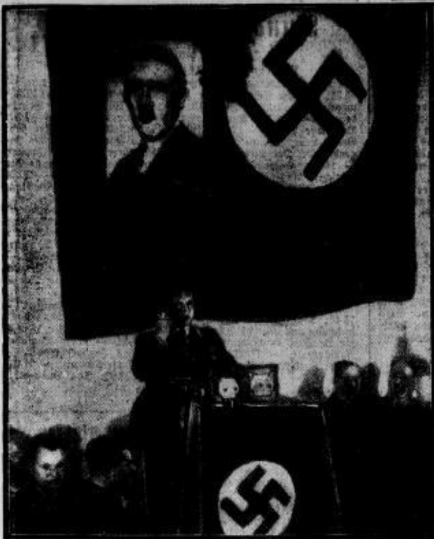
Das erste Bildtelegramm von der Hitler-Geburtsstagsfeier in Rom.

Die deutsche Kolonie in Rom veranstaltete zum bevorstehenden Geburtstag des Reichskanzlers eine Feier, von der unser Bildtelegramm berichtet; Reichsminister Göring leitete die Festrede unter dem Bild des Reichskanzlers Hitler und dem Hakenkreuzbanner.