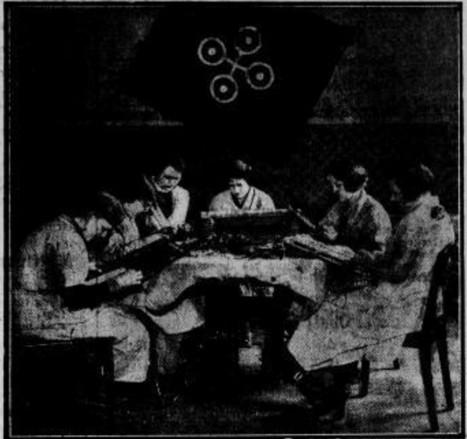
Das Berufsjahr der Abiturienten beginnt. In diesen Tagen beginnen überall in Deutschland die Kurse des freiwilligen Arbeitsdienstes für die jetzt schulentlassenen Abiturienten vor Beginn ihrer Hochschulzeit. Die Verteilung in den Arbeitslagern soll so sein, daß jeweils ein Drittel Abiturienten mit zwei Dritteln Angehörigen aus allen Volksschichten zusammenkommen. Unser Bild zeigt schulentlassene Abiturientinnen am ersten Tag ihrer Tätigkeit im Arbeitslager.