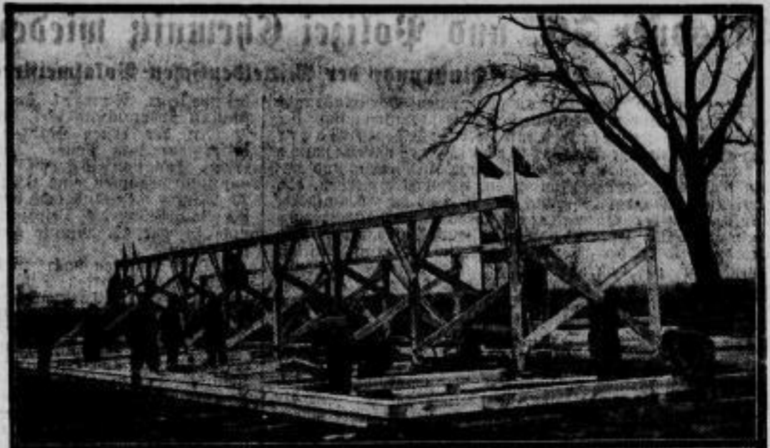
Hieberhaft wird zum Fest der Nationalen Arbeit gewerkelt. Wie man aus unserem Bilde ersieht, sind die Vorbereitungen zum Fest der Nationalen Arbeit am 1. Mai auf dem Tempelhofer Feld in Berlin in vollem Gange: riesige Tribünen für die Regierung, Presse, Zuschauer und Ehrengäste entstehen hier, um auch dem äußeren Rahmen des Festes ein würdiges Gepräge zu geben.