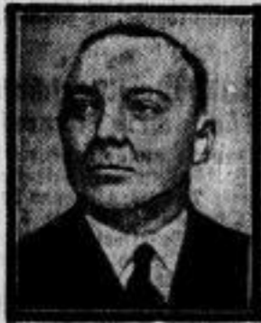
Reichstagsabgeordneter Koerner — preussischer Staatssekretär. Der nationalsozialistische Reichstagsabgeordnete Koerner ist zum Staatssekretär des preussischen Staatsministeriums ernannt worden.