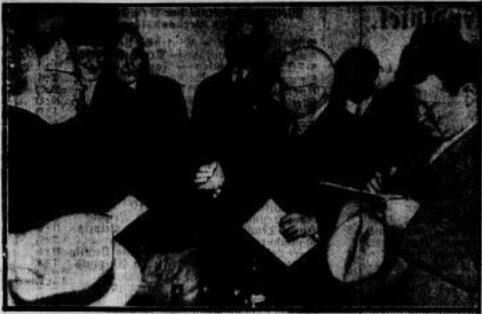
Deutschlands neuer USA-Botschafter vor der amerikanischen Presse. Der kürzlich neuernannte deutsche Botschafter für die Vereinigten Staaten, der frühere Reichsbankpräsident Dr. Hans Luther, wird nach seiner Ankunft in New York von amerikanischen Journalisten interviewt.