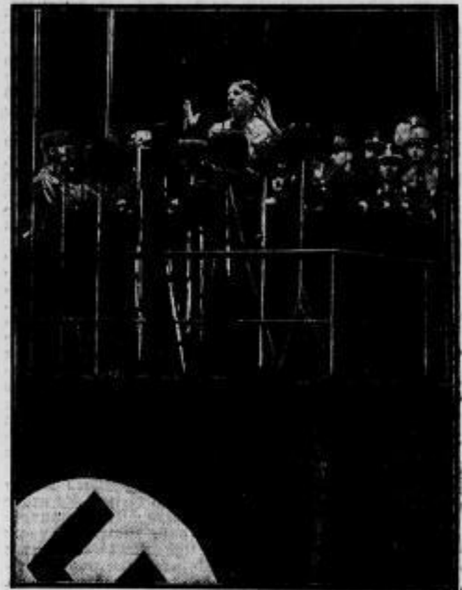
Der Höhepunkt des Feiertags der Nationalen Arbeit war die Ansprache des Reichskanzlers Adolf Hitler zu den deutschen Volksgenossen.