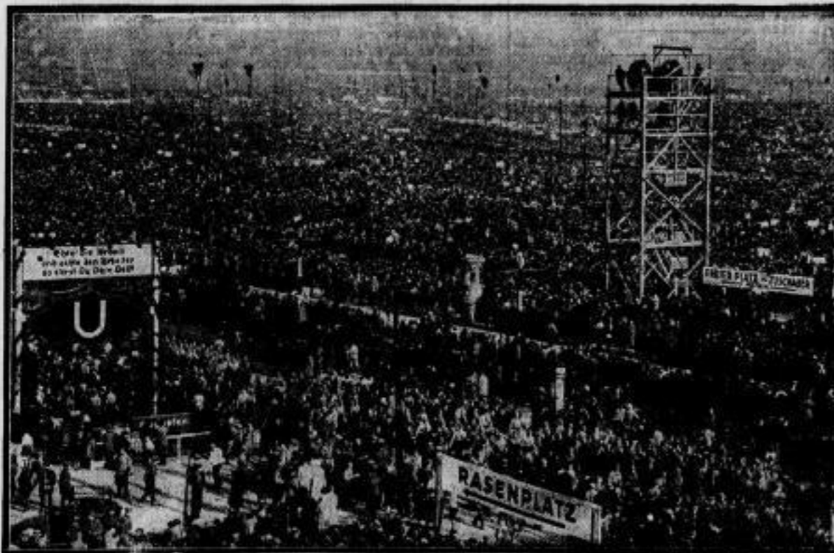
Die Millionenmassen auf dem Tempelhofer Feld. Ein Blick über das Tempelhofer Feld in Berlin, wo unzählige Menschenmassen dem feierlichen Staatsakt am Tage der nationalen Arbeit bewohnten.