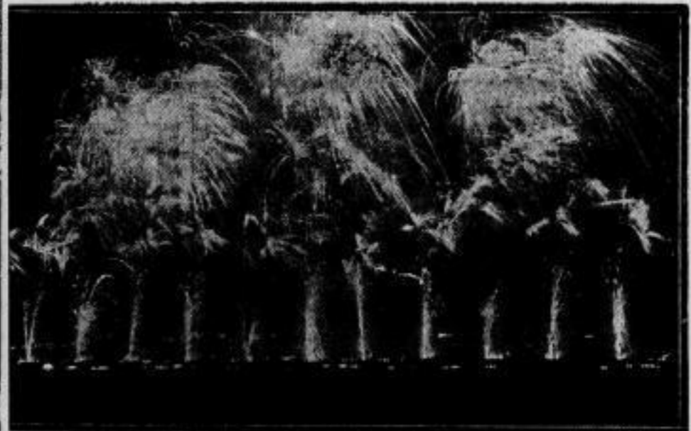
Das größte Feuerwerk, das die Welt je gesehen. Ein Blick auf das Riesfeuerwerk, das als Abschluß der großen Kundgebung am Tage der nationalen Arbeit auf dem Tempelhofer Feld in Berlin gesetzt wurde.