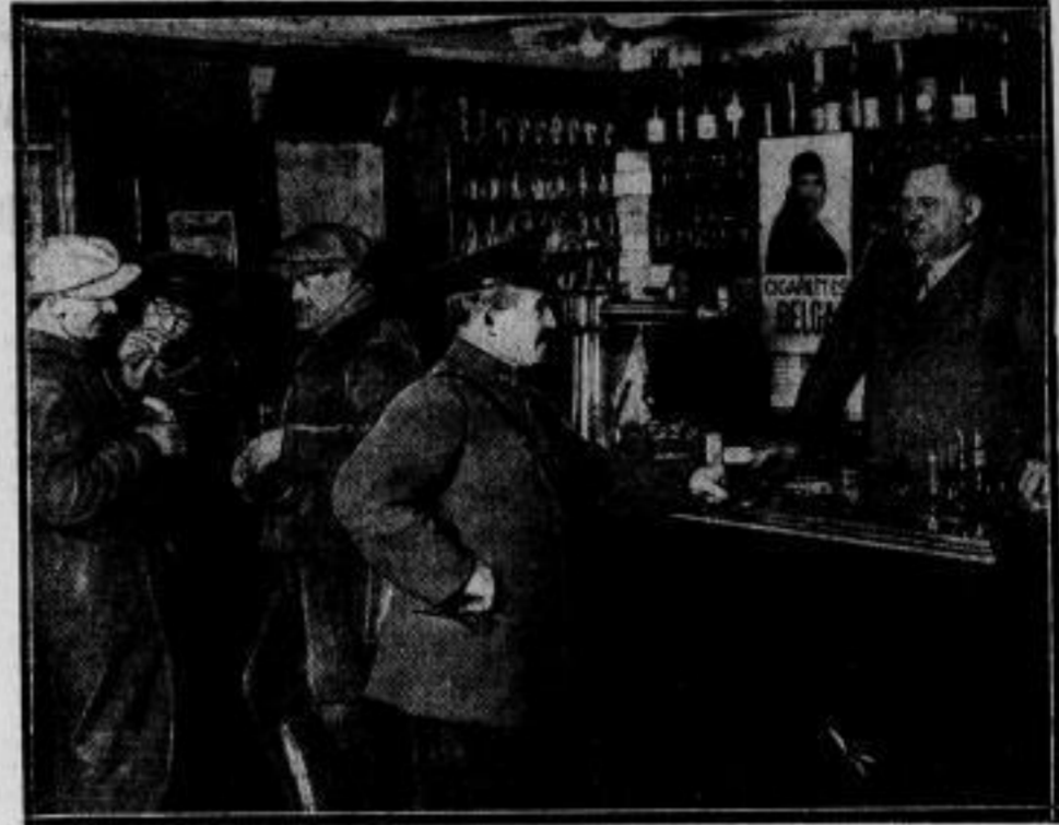
Der Unsinn der Grenzziehung. Eupen-Malmedy, der kleine Landstrich an der deutschen Westgrenze, ist bekanntlich durch das Versailles Diktat von seinem Mutterland abgetrennt worden. Die willkürliche Grenzziehung, die hierdurch entstanden ist, hat zu allen

möglichen merkwürdigen Zuständen geführt: durch diese Gastwirtschaft zum Beispiel läuft die Grenze. Während der Wirt mit dem Schankstisch sich im Auslande befindet, stehen die Gäste auf deutschem Boden und trinken dort das ausländische Bier.