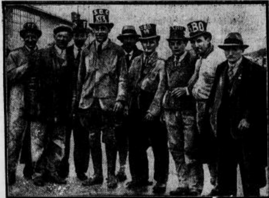
Im Zeichen des Uniformverbots in Oesterreich. Bei der Ankunft der deutschen Minister in Wien war auch diese lustige Gruppe zu sehen, Mitglieder der NSDAP, die wegen des Uniformverbots in diesem eigenartigen Anzuge erschienen waren. Sie wurden wenige Minuten später von der Polizei, die augenscheinlich diesen Spaß nicht verstand, verhaftet.