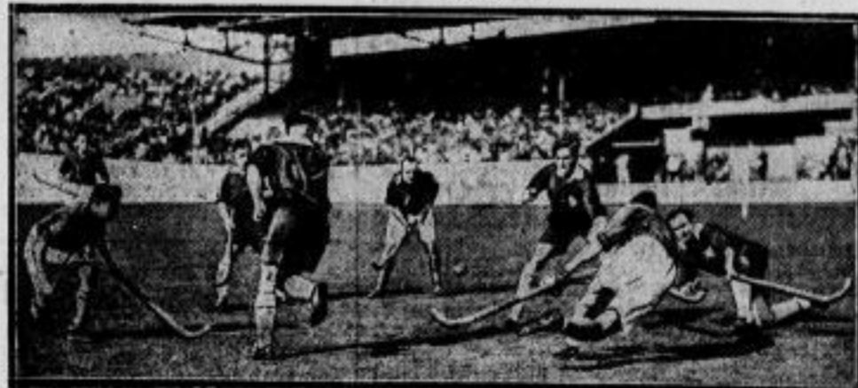
Hockeyländerkampf Deutschland-Holland unentschieden. Unser Bild berichtet vom 8. Hockeyländerkampf, der im Amsterdamer Stadion zwischen den Nationalmannschaften von Deutschland und Holland ausgetragen wurde und mit einem 4:4-Unentschieden endete. Die Deutschen tragen schwarze Hosen, schwarzes Hemd — die Holländer weiße Hosen, schwarzes Hemd.